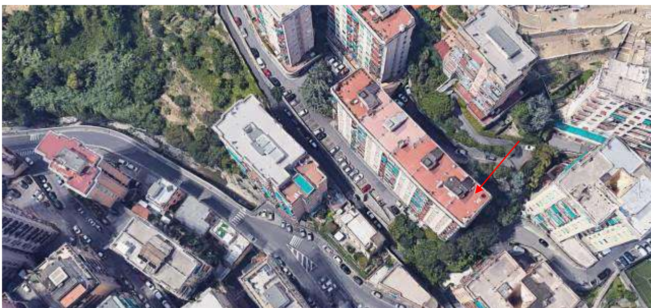
Foto 6, 7 e 8 - Viste tridimensionali della situazione immobiliare tratta da google map del 20.10.2019