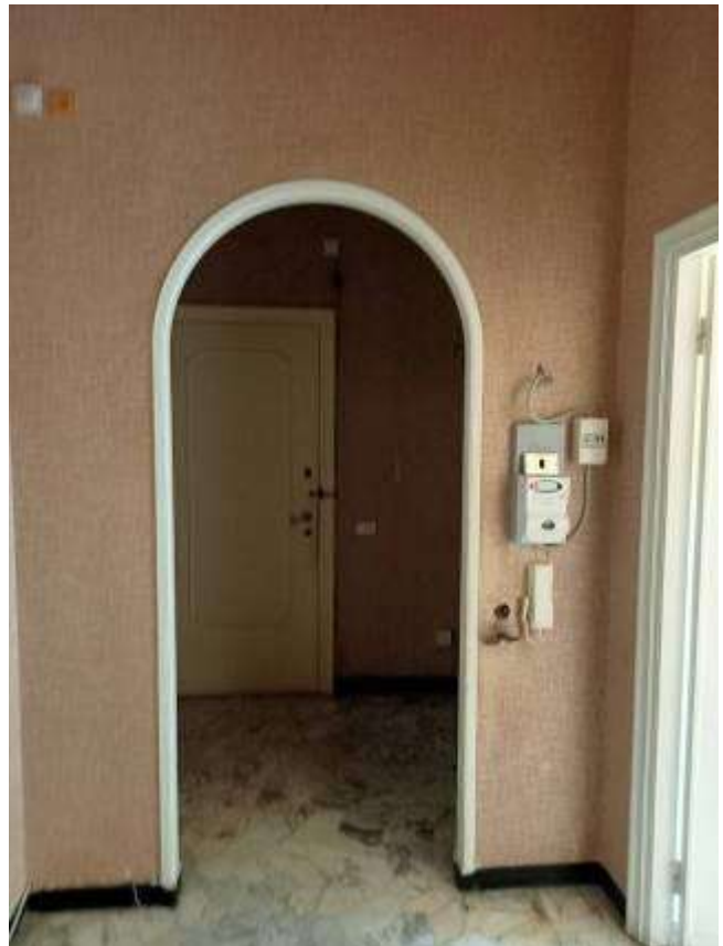
Foto 14 e 15 - Vista della porta di ingresso