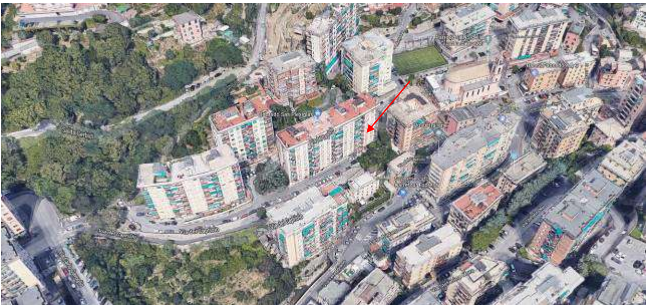
Foto 3, 4 e 5 - Viste tridimensionali della situazione immobiliare tratta da google map del 20.10.2019