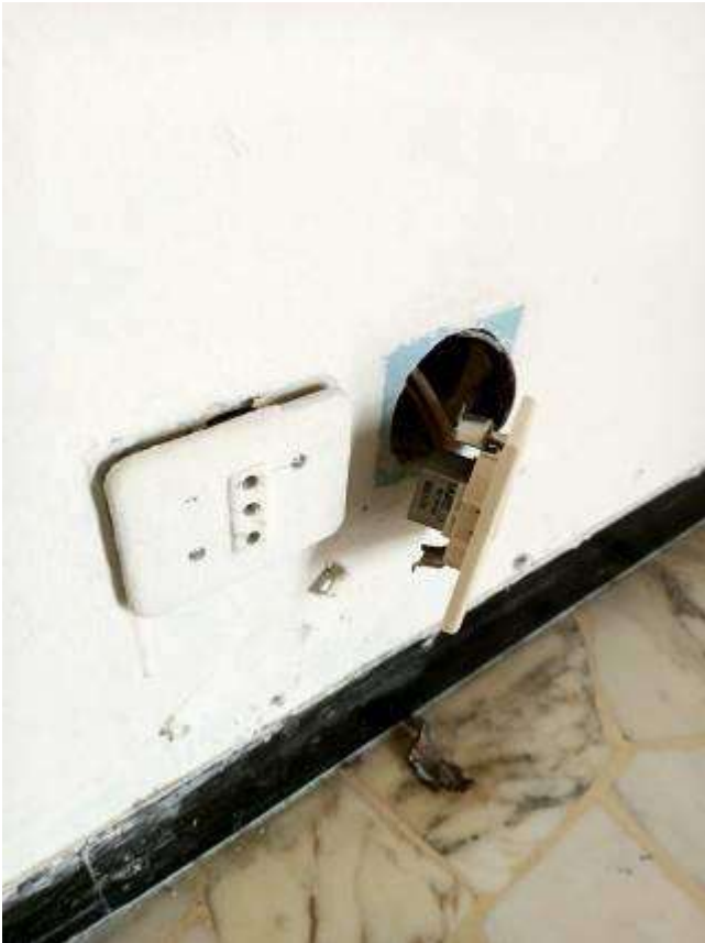
Particolare delle prese elettriche con impianto non sfilabile