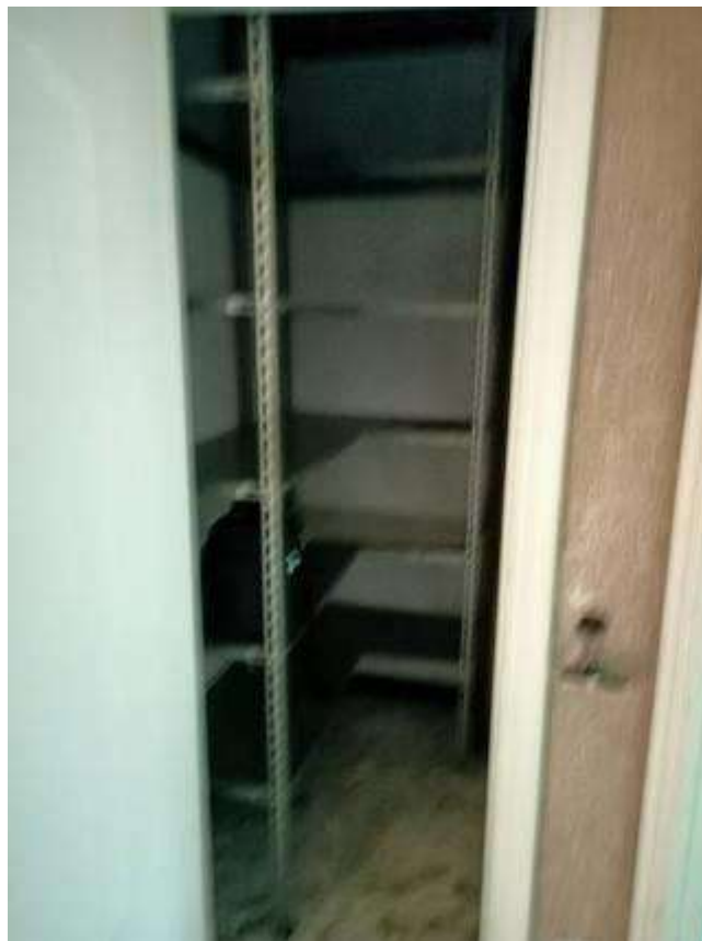
Foto 17 - Vista interna del ripostiglio