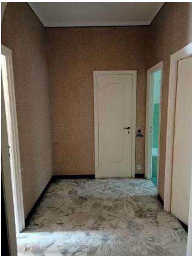
Foto 16 - Vista della porta del ripostiglio