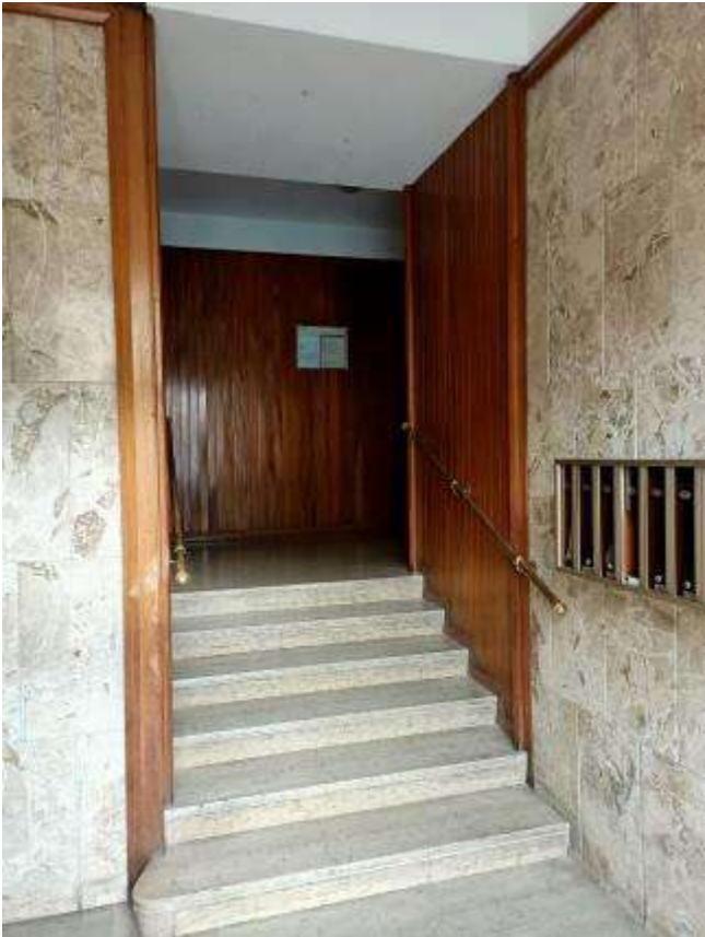
Foto 12 - Vista dell'androne di ingresso al condominio