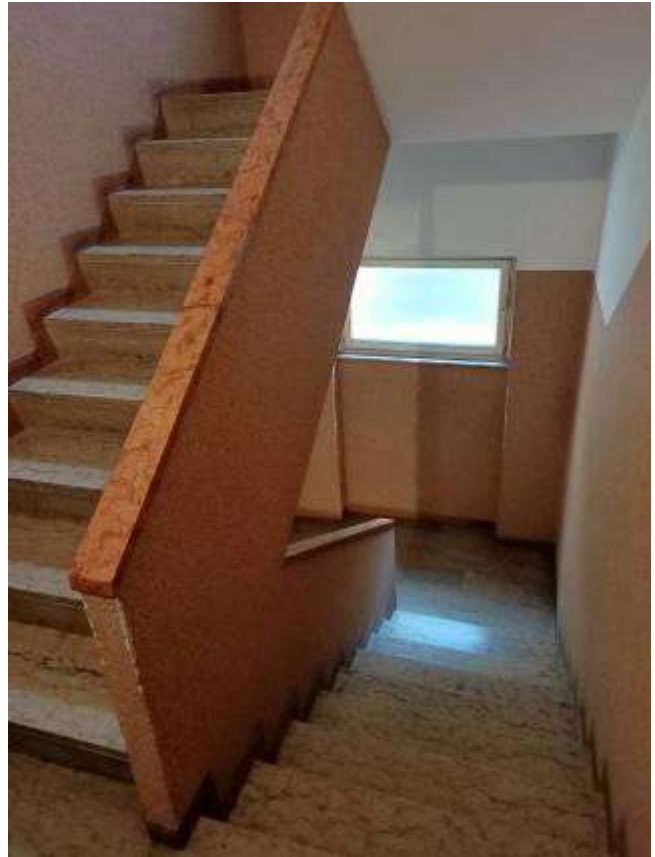
Foto 13 - Vista della scala condominiale