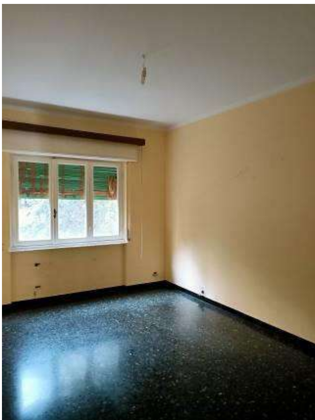
Foto 18 e 19 - Vista della camera