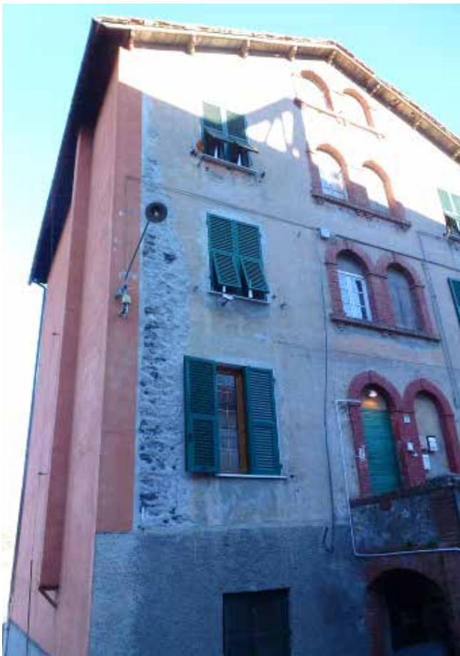
Foto 5 - Vista dello spigolo sudovest del civico 59