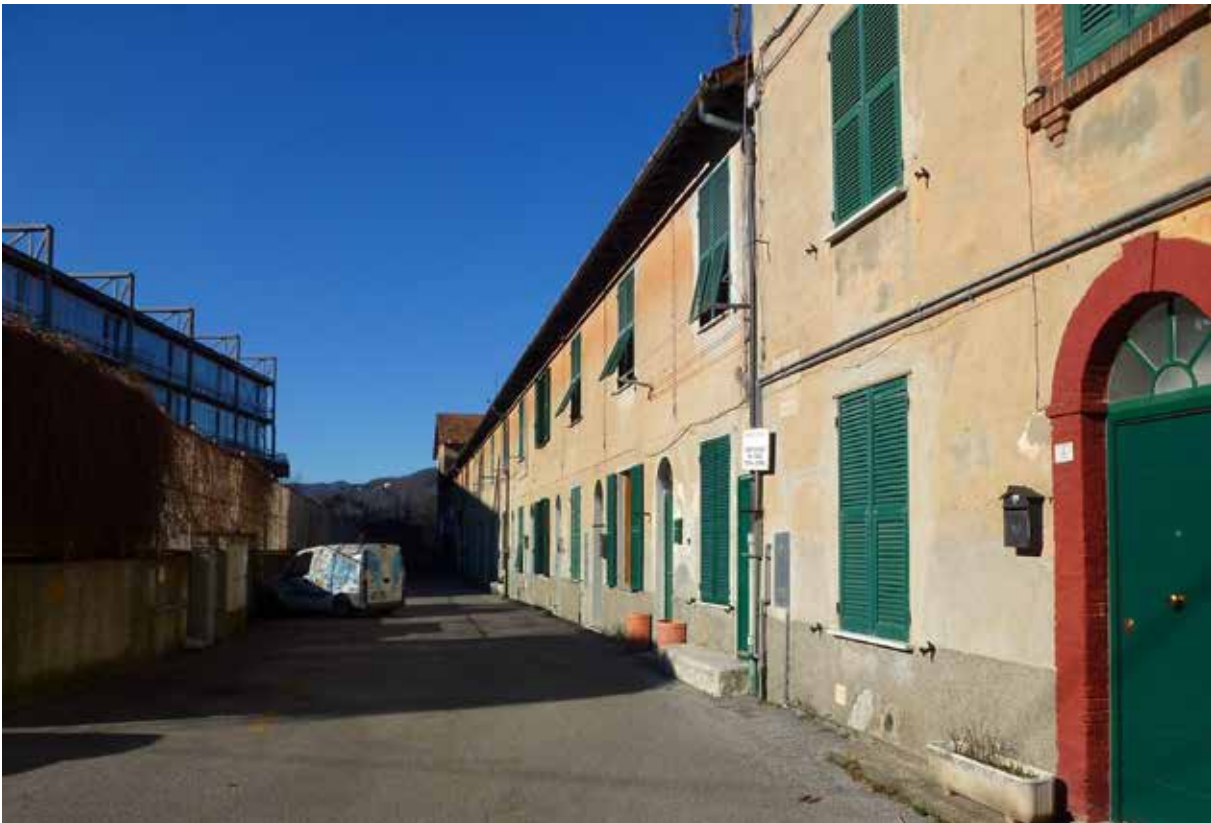
Foto 3 - Vista del civico 59 dall'imbocco della via Paverano