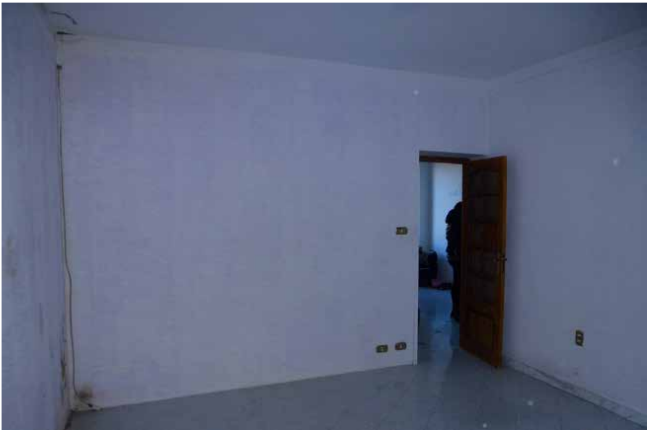
Foto 23 - Vista della camera sudovest verso la porta