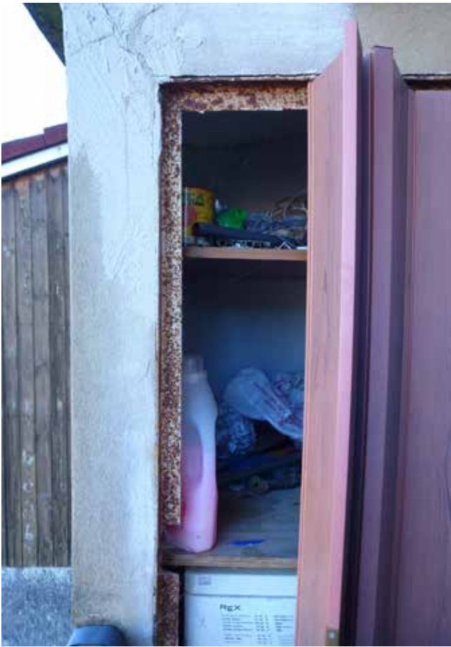
Foto 14 - Vista del ripostiglio esterno