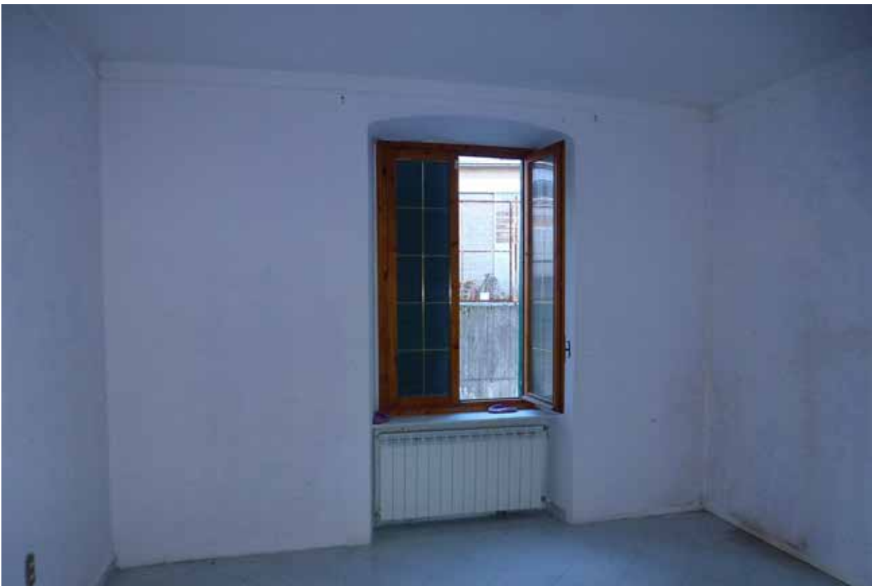
Foto 25 - Vista della camera sudest verso la finestra