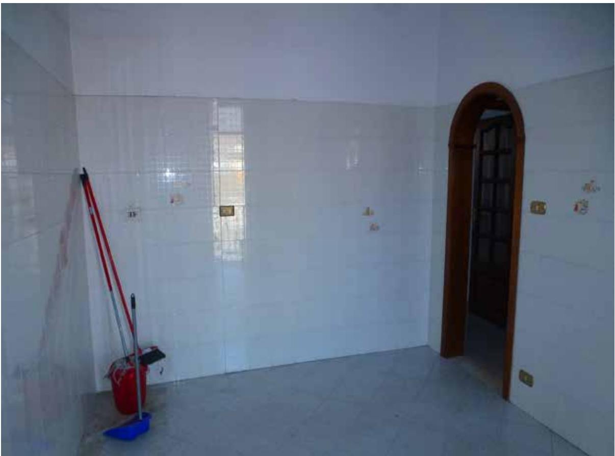
Foto 10 - Vista della cucina verso la porta