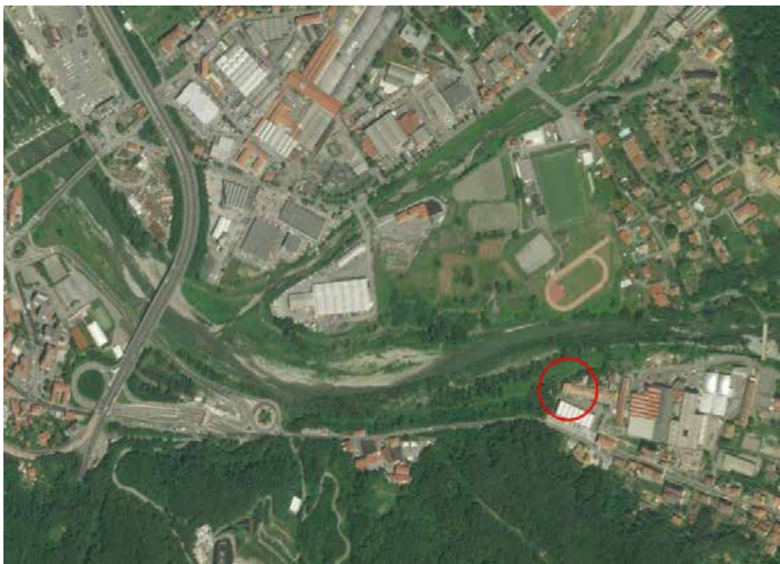
Foto 2 - Vista aerea del civico 59 nel contesto territoriale