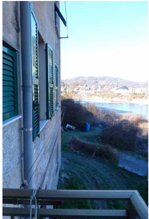
Foto 12 - Vista laterale dal balcone della cucina