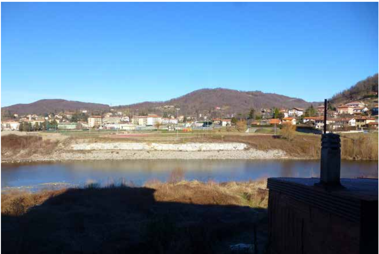
Foto 13 - Vista dalle finestre verso nord