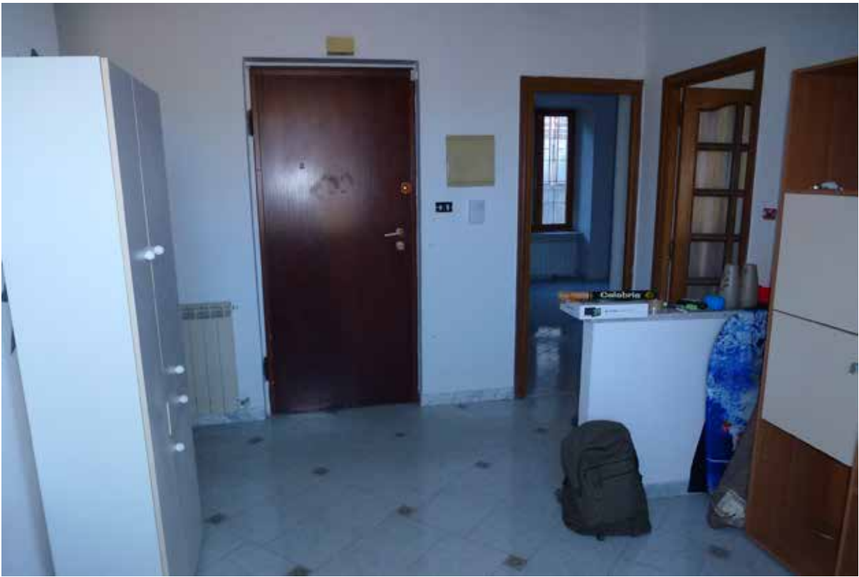
Foto 9 - Vista del vano di ingresso verso la porta