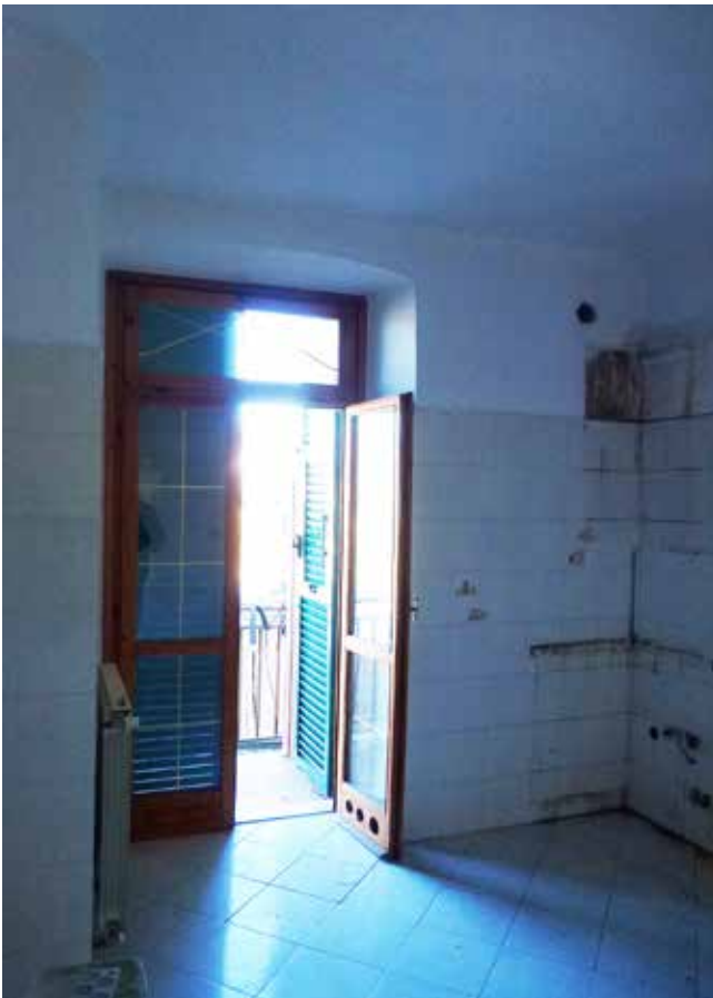
Foto 11 - Vista della cucina verso la finestra