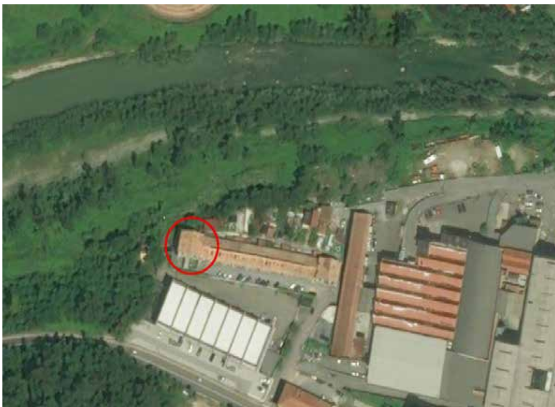
Foto 1 - Vista aerea del civico 59