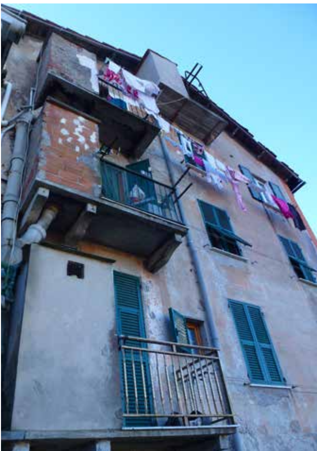
Foto 7 - Vista esterna del balcone dell'immobile