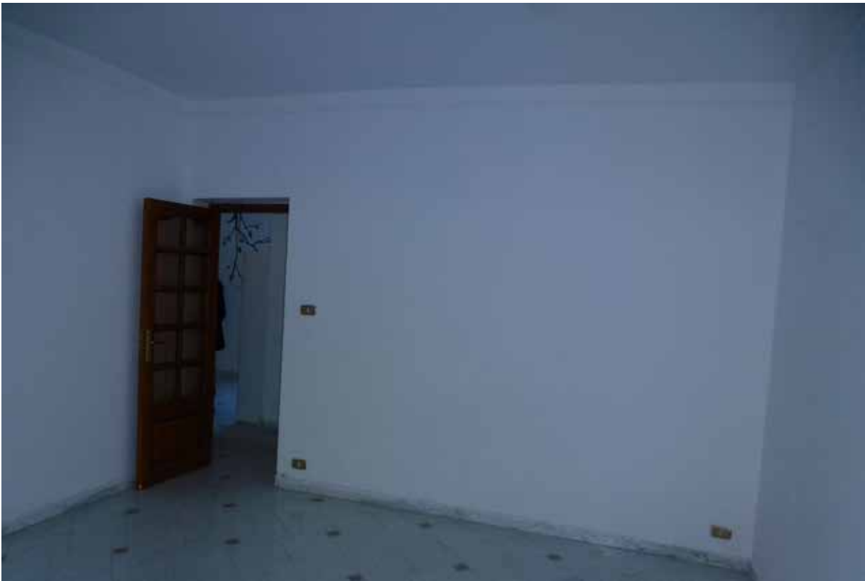
Foto 20 - Vista della camera sudest verso la porta