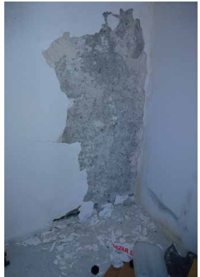
Foto 17 - Dettaglio delle infiltrazioni nella camera nordovest