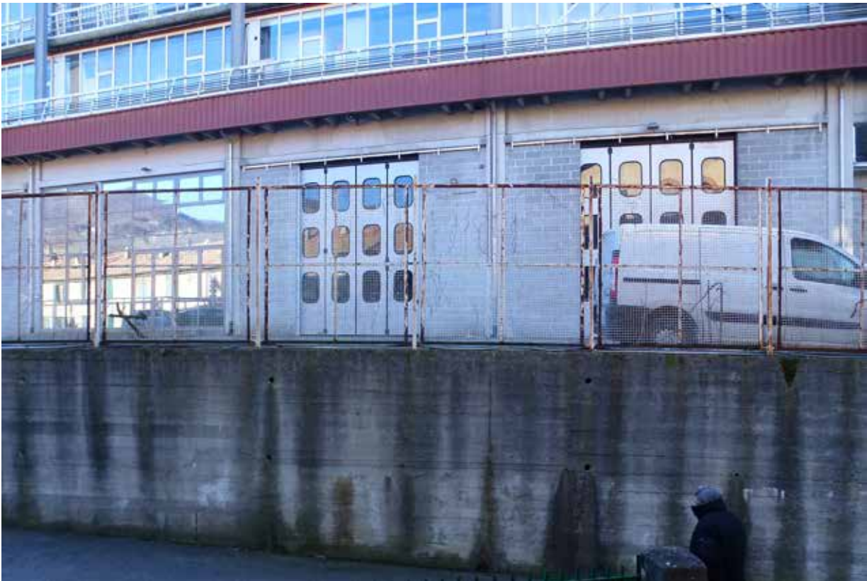
Foto 22 - Vista dalle camere sul fronte sud