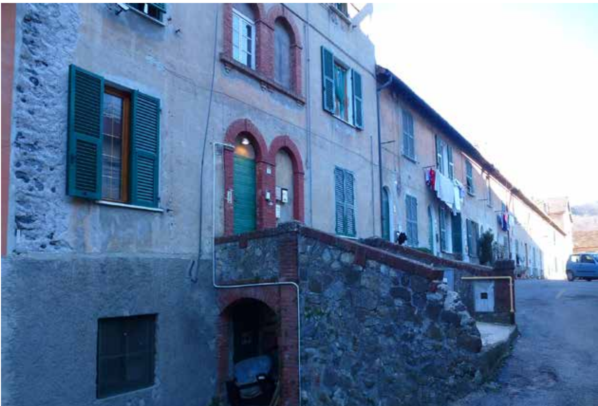
Foto 4 - Vista del civico 59 in corrispondenza dell'accesso