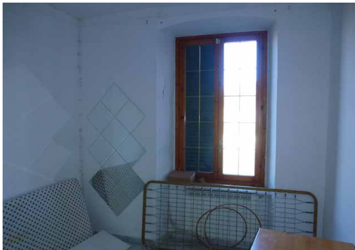
Foto 19 - Vista della camera nordovest verso la finestra