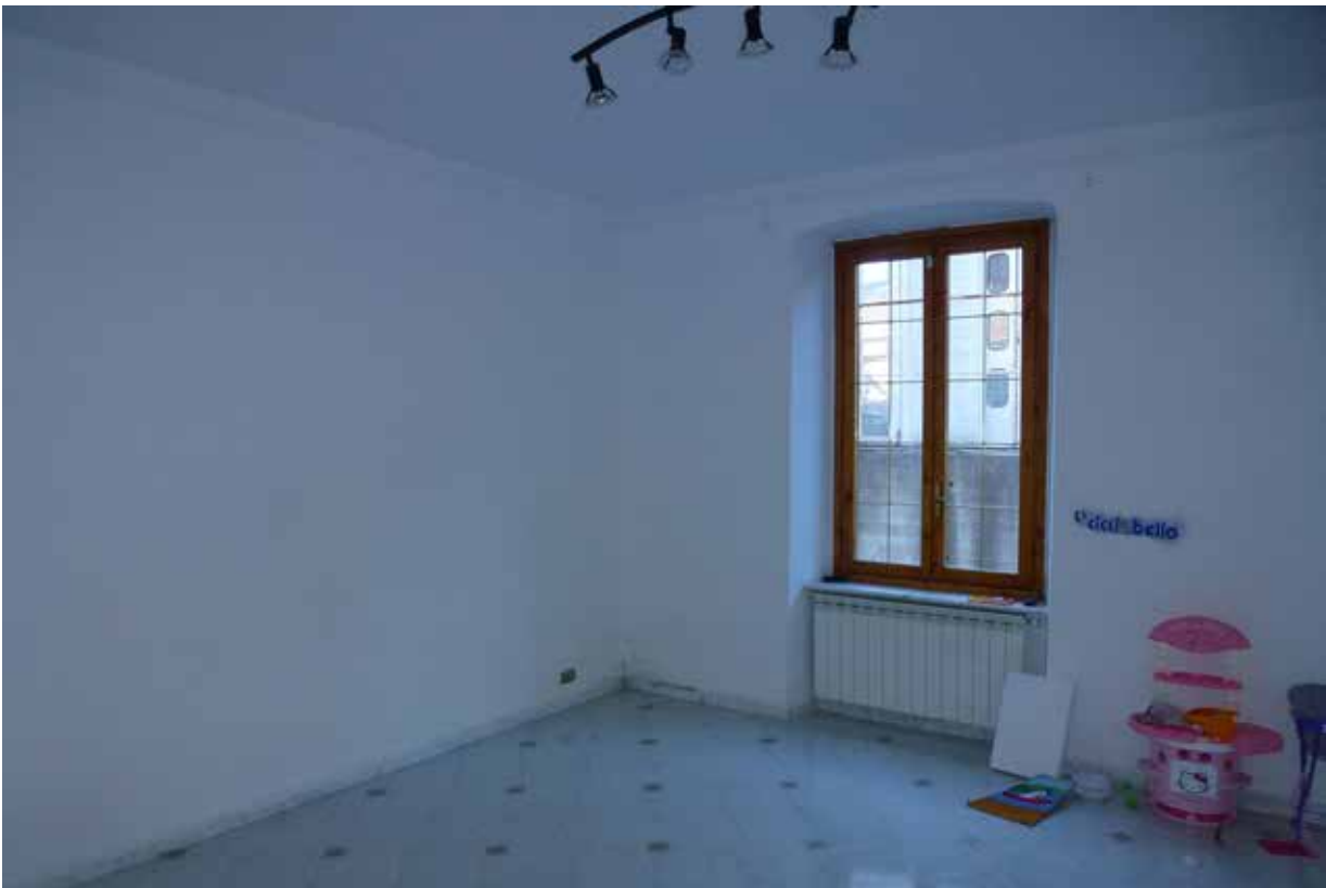
Foto 21 - Vista della camera sudest verso la finestra