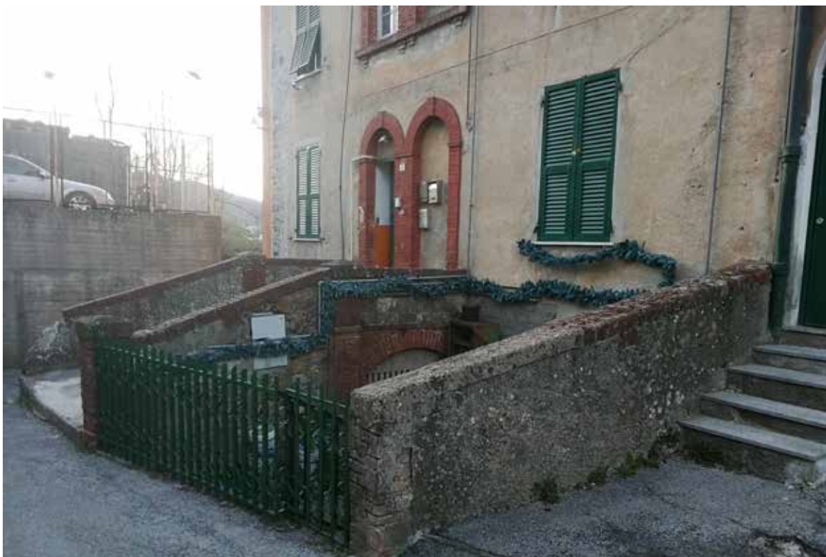
Foto 26 - Vista del giardino ("cortile" sulla planimetria catastale)