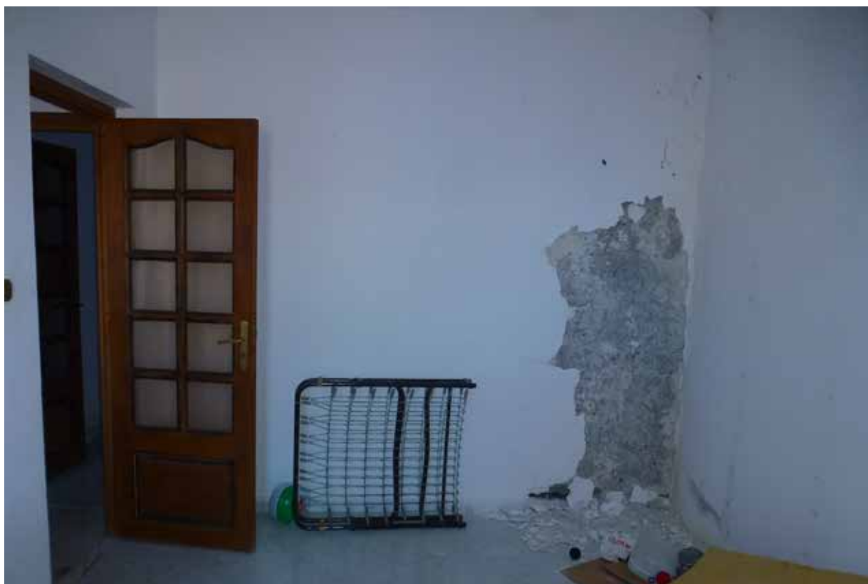
Foto 18 - Viste della camera nordovest verso la porta