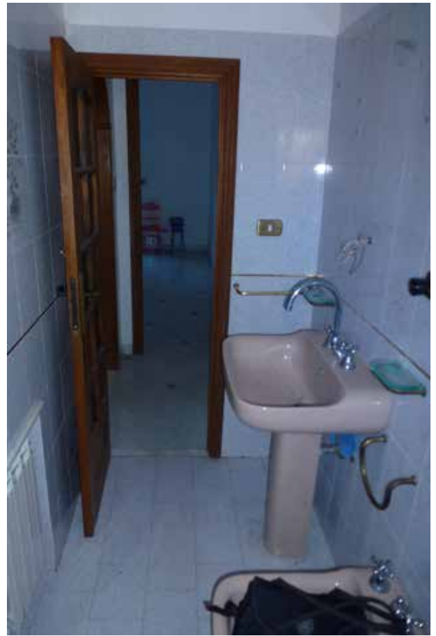
Foto 15 - Vista del bagno verso la porta