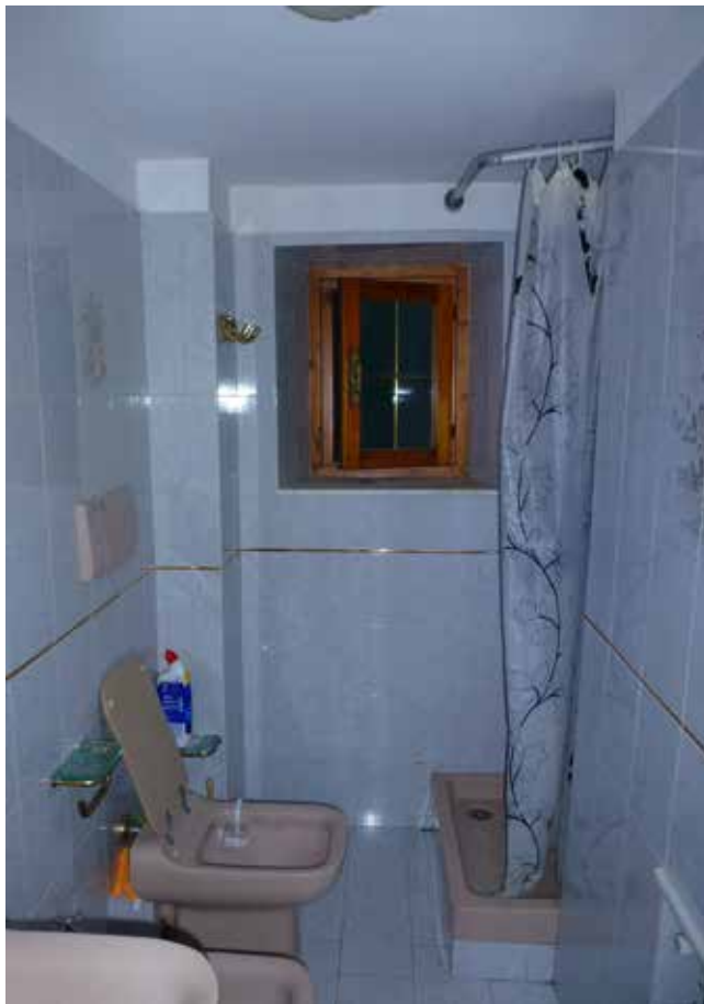
Foto 16 - Vista del bagno verso la finestra