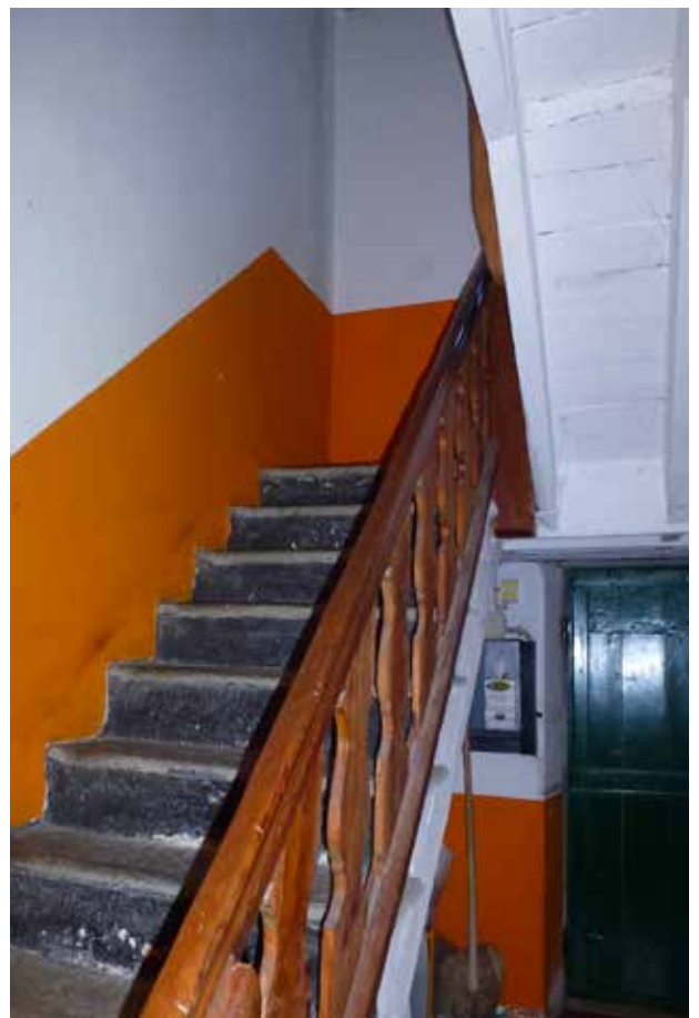
Foto 8 - Vista dell'atrio di ingresso del civico 59