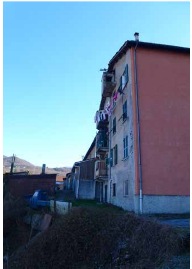
Foto 6 - Vista del fronte del civico 59 sul fiume