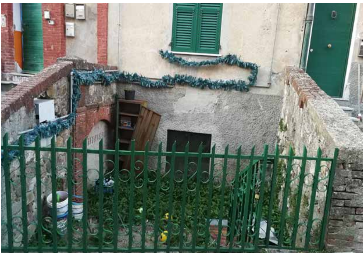
Foto 27 - Vista del giardino dal suo ingresso