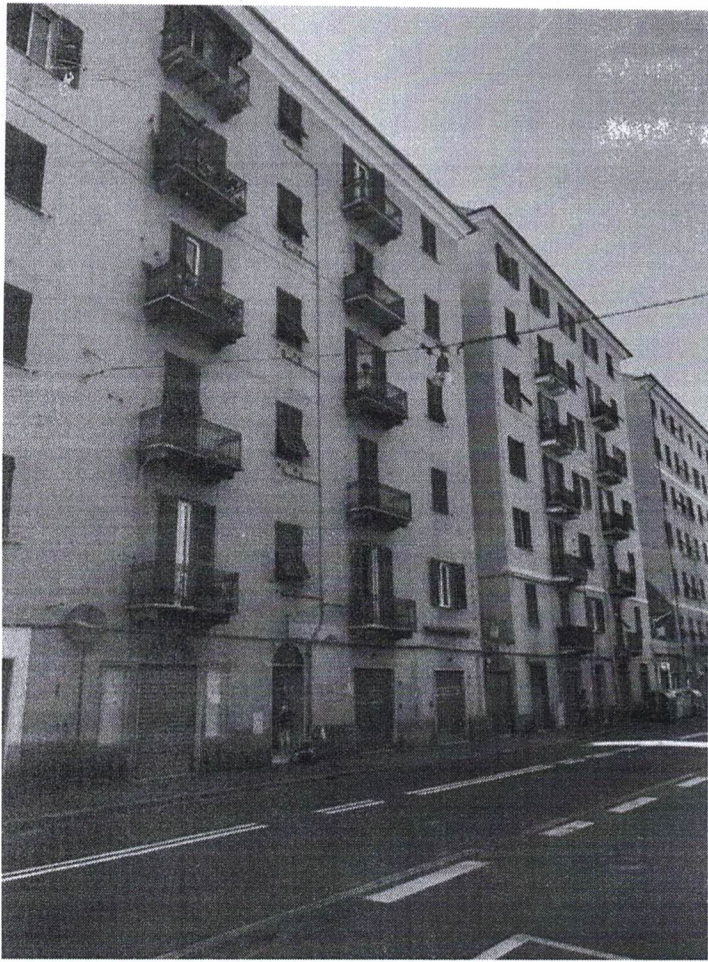
1) Prospetto su Via Walter Fillak