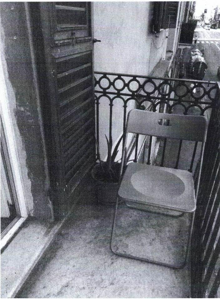
11) Particolare Balcone