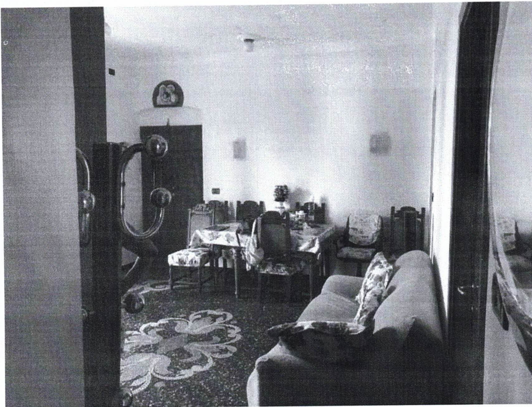
7) Locale Ingresso/Soggiorno