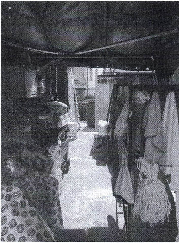
25) Particolare Terrazzo