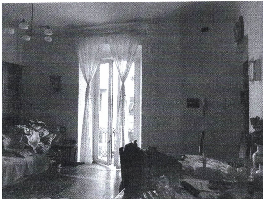
8) Particolare Locale Ingresso/Soggiorno