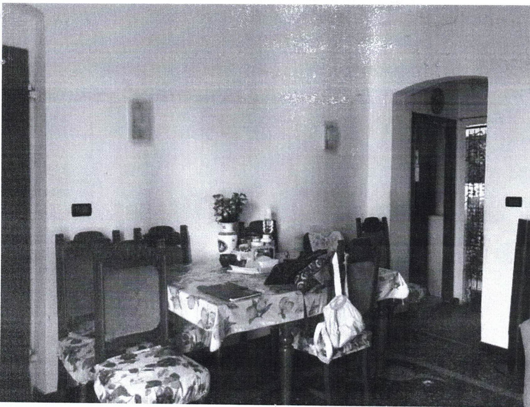
9) Portone di Ingresso