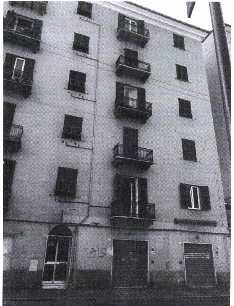
2) Prospetti Nord-Ovest