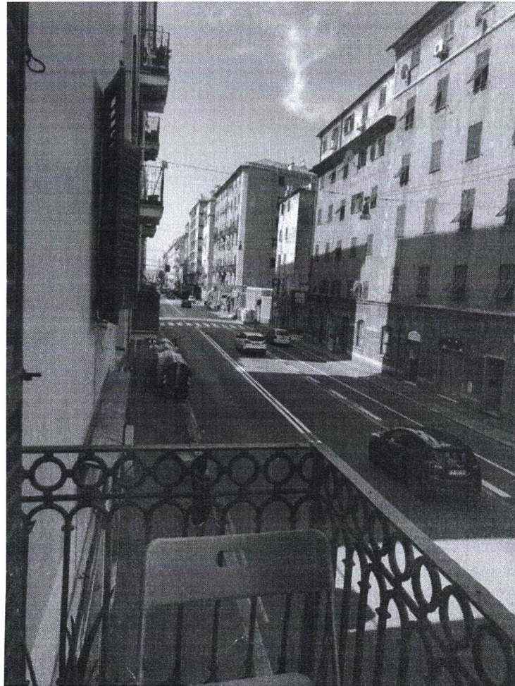
12) Particolare vista su Via Walter Fillak