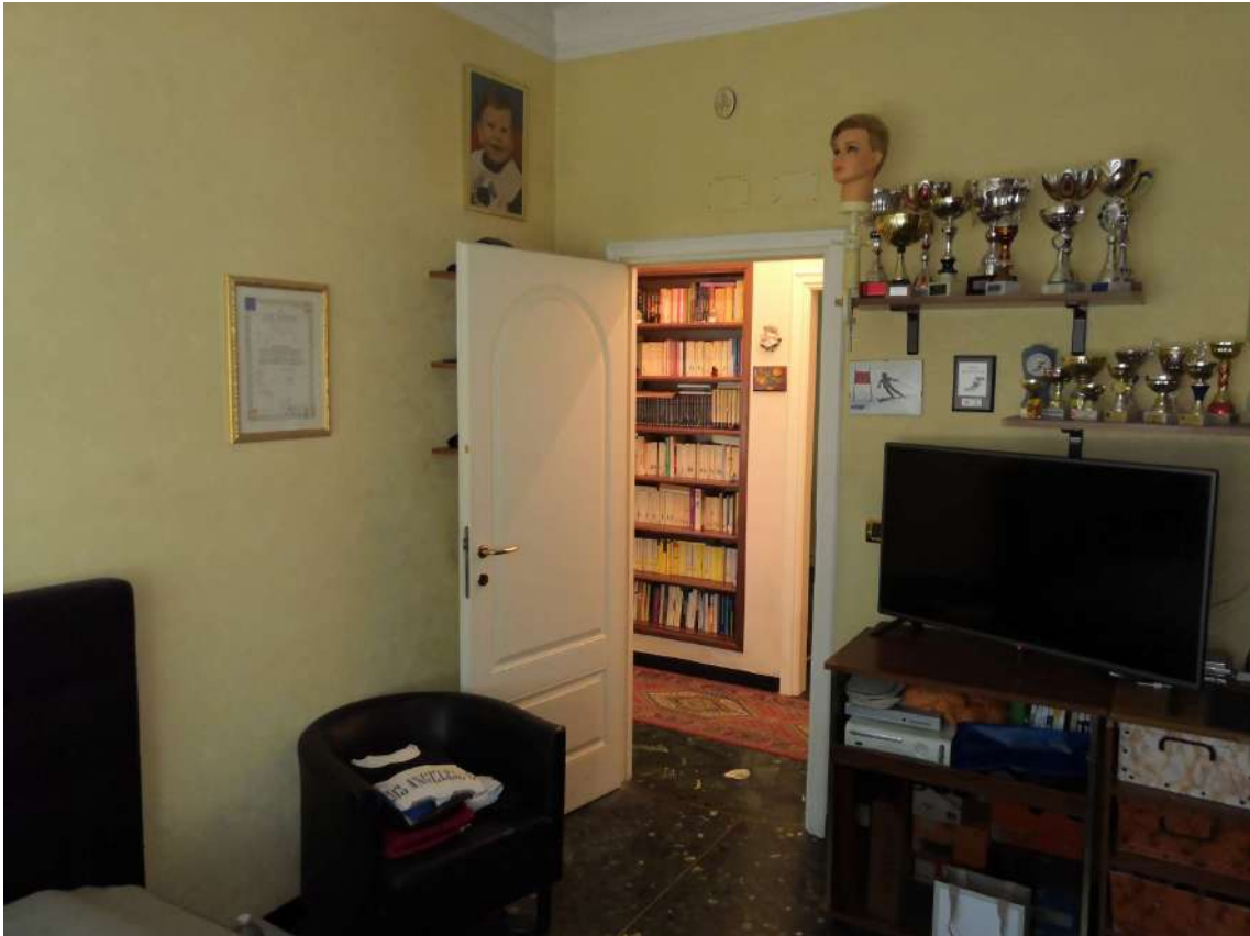
FOTO N. 31 - CAMERA