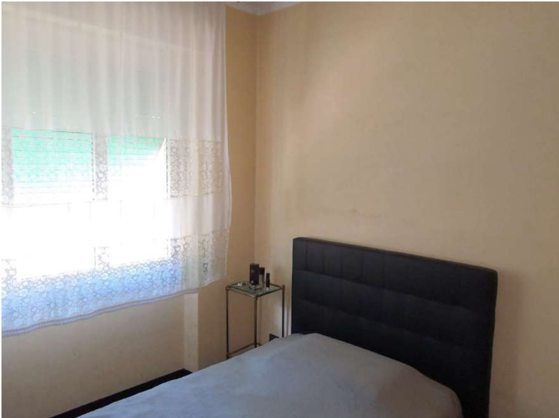
FOTO N. 32 - CAMERA