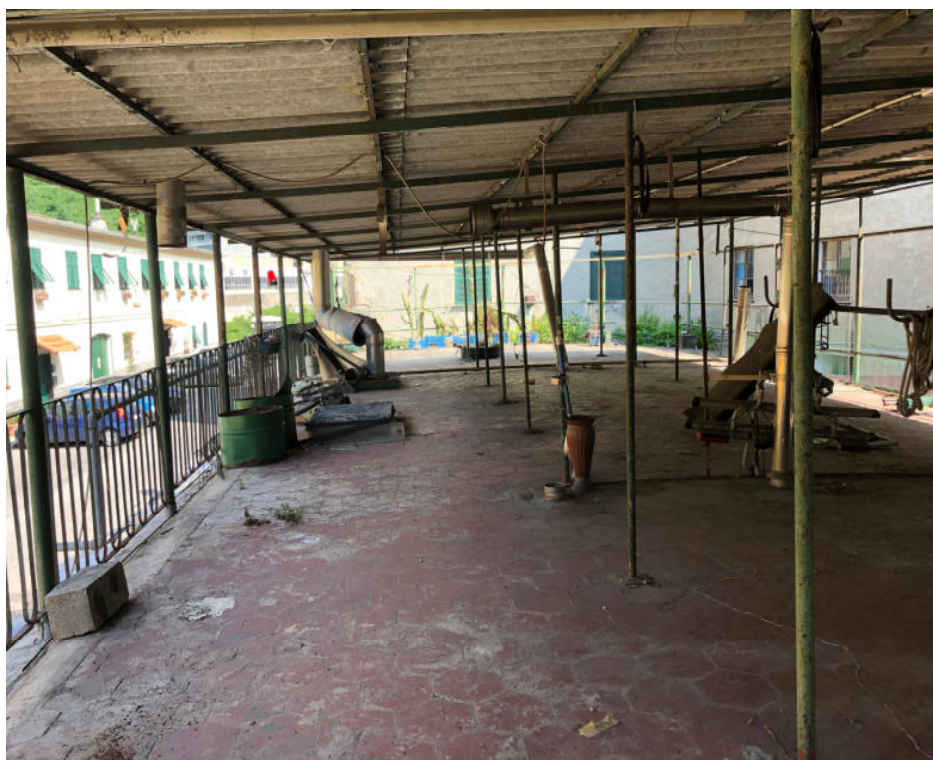
Foto 26— vista dalla scala esterna verso Nord del lastrico solare

Le fotografie di cui sopra rappresentano lo stato reale dei luoghi.