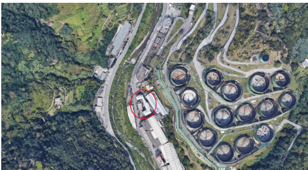
fg. 43, mapp. 297, sub. 1