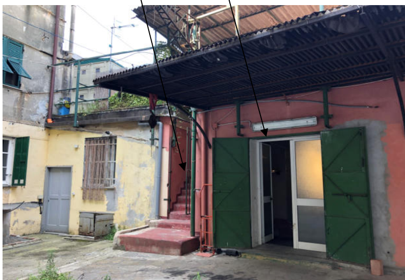
Foto 11—vista dell'accesso al locale laboratorio sul lato Nord e della scala esterna adiacente di collegamento tra il cortile e il lastrico solare

Le fotografie di cui sopra rappresentano lo stato reale dei luoghi.