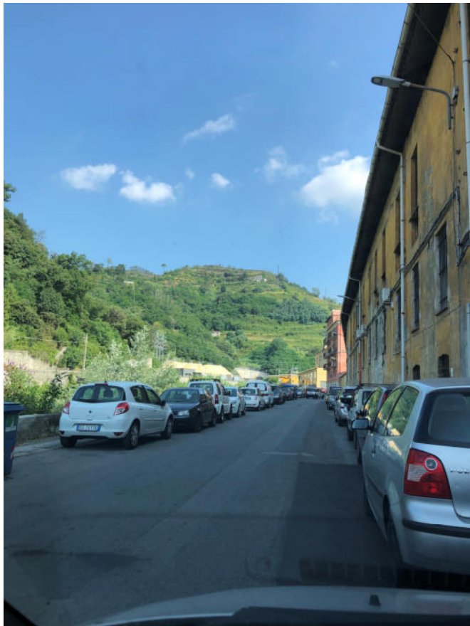
Foto 4—vista da sud di Via P. Cassanello ultimo tratto in prossimità dell'immobile