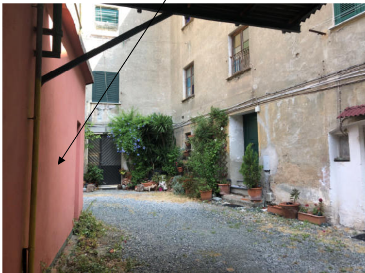
Foto 10— vista del lato Nord- Ovest dell'immobile da Nord del cortile