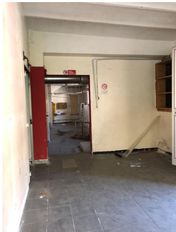
Foto 18/19—vista verso Nord dell'accesso dal locale laboratorio ai locali ad uso ufficio / vista verso Sud dell'accesso dagli uffici al locale laboratoriale

Le fotografie di cui sopra rappresentano lo stato reale dei luoghi.