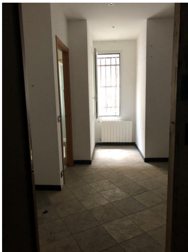
Foto 22/23— vista del locale ad uso deposito verso l'accesso Ovest su Via P. Cassanello /vista del locale ad uso magazzino da Ovest verso Est

Le fotografie di cui sopra rappresentano lo stato reale dei luoghi.