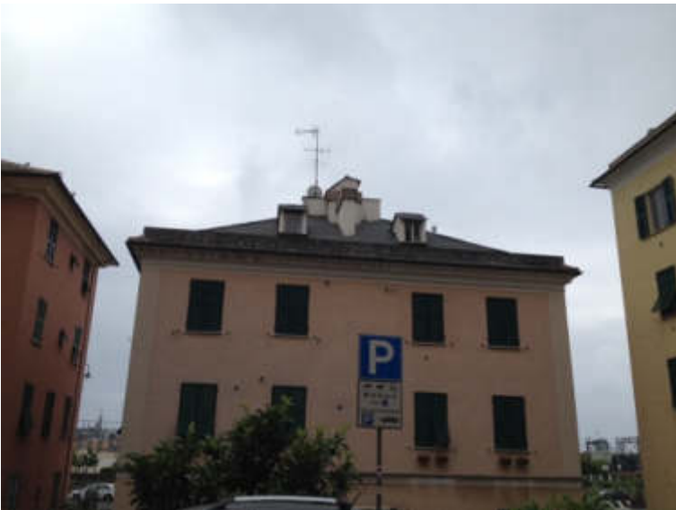
Foto 8 - prospetto nord c.n. 48 di via Prà