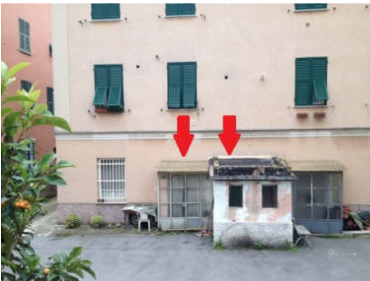
Foto - 9 - volume/tettoia e w.c.