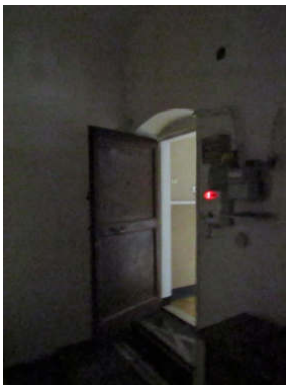
Foto 13 - ingresso