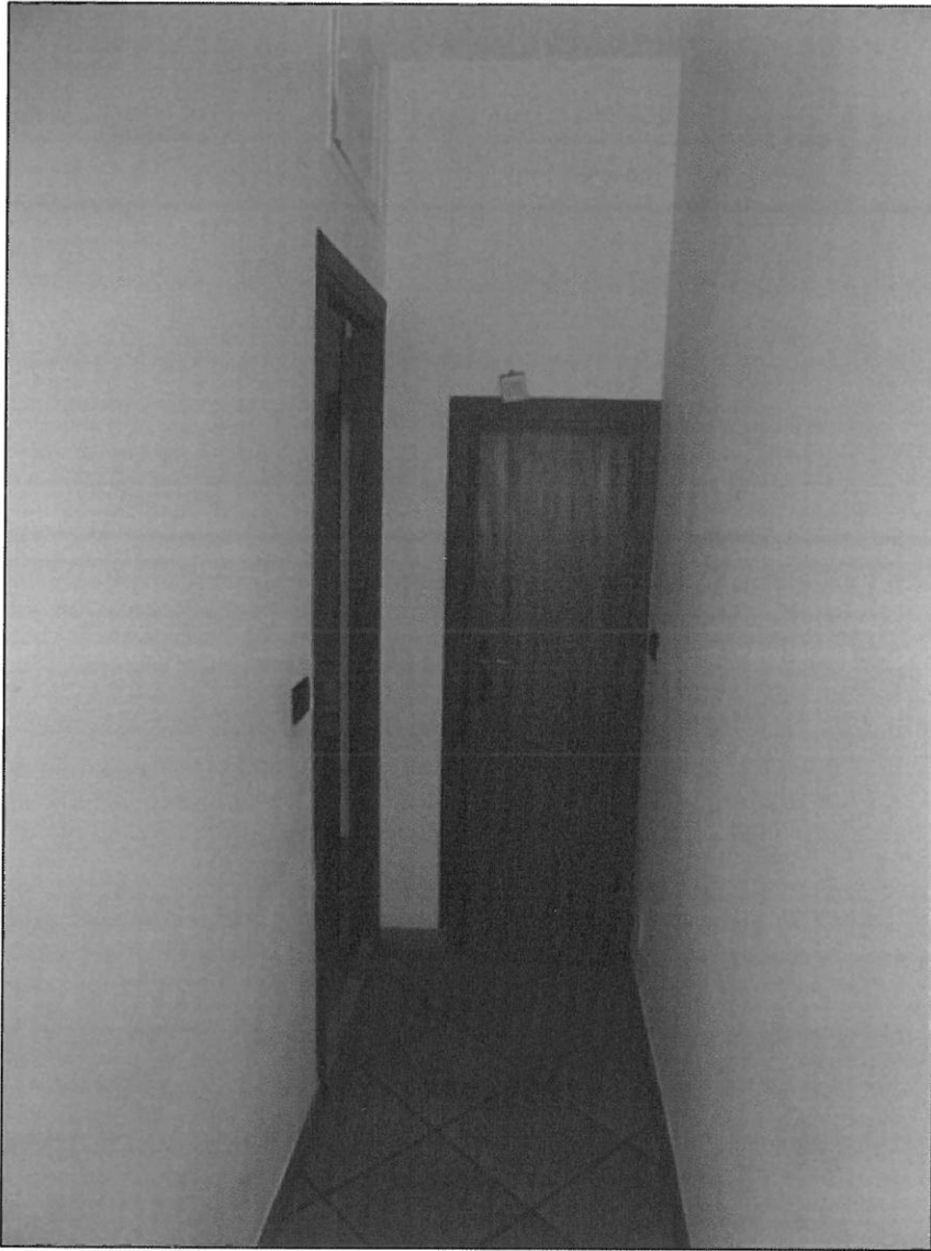
CORRIDOIO CON PORTA BAGNO E RIPOSTIGLIO