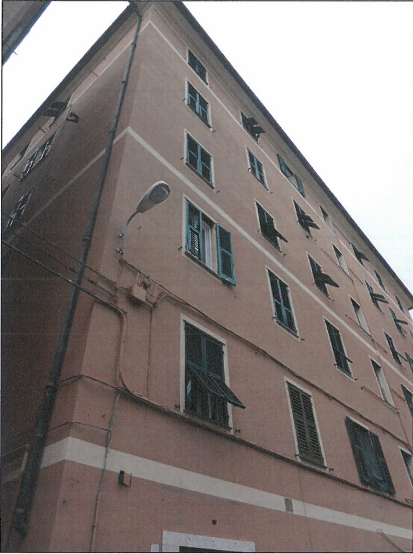
PROSPETTO SU VIA ALBINI