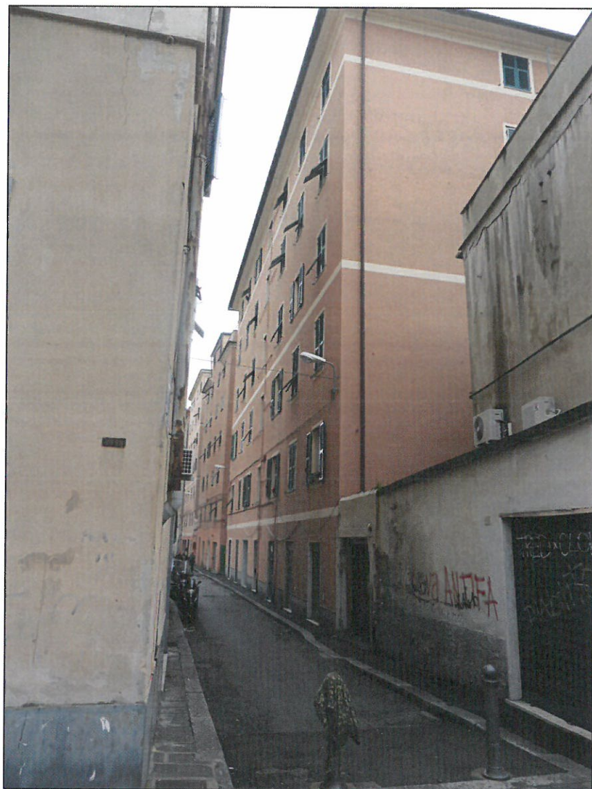
PROSPETTI SU VIA ALBINI E NORD