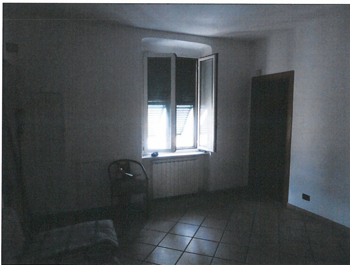
INGRESSO ALLA GENOVESE