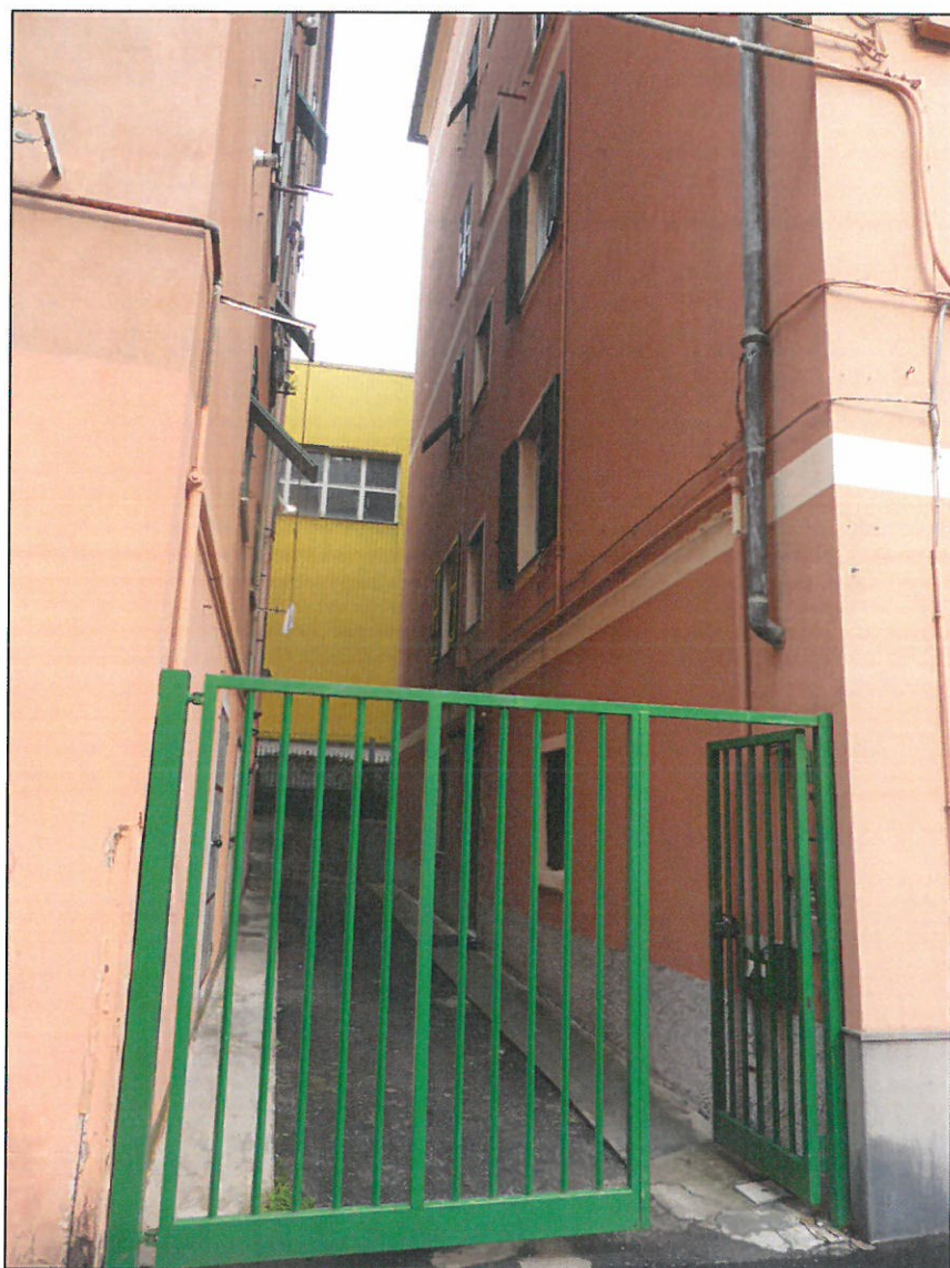
PROSPETTO SUD - INGRESSO CIV. 8