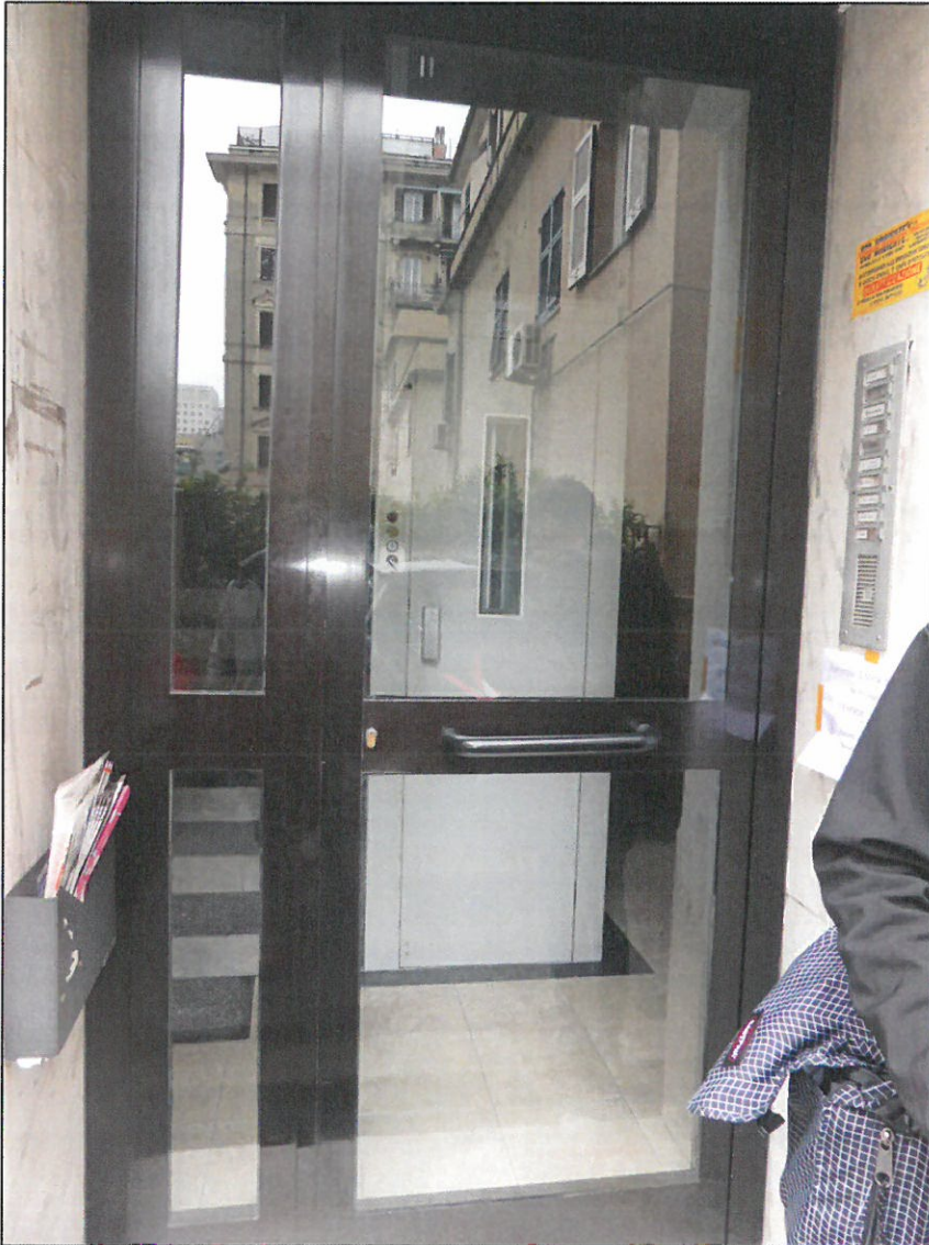
PORTONE D'INGRESSO AL CASEGGIATO