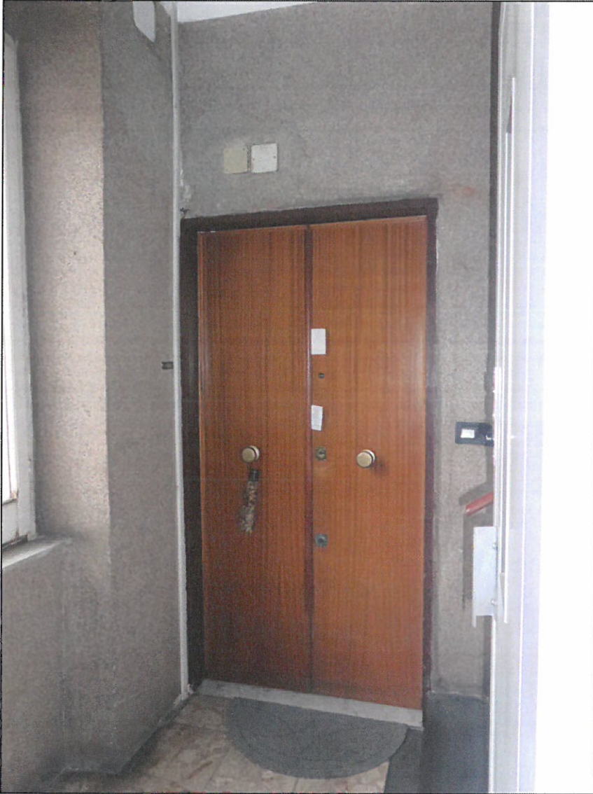
PORTONCINO D'INGRESSO ALL'APPARTAMENTO