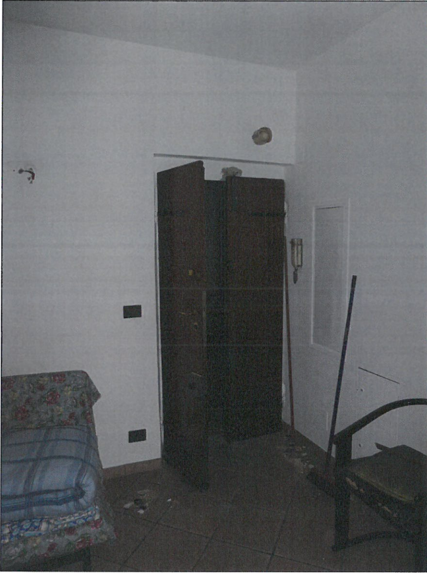
INGRESSO ALLA GENOVESE