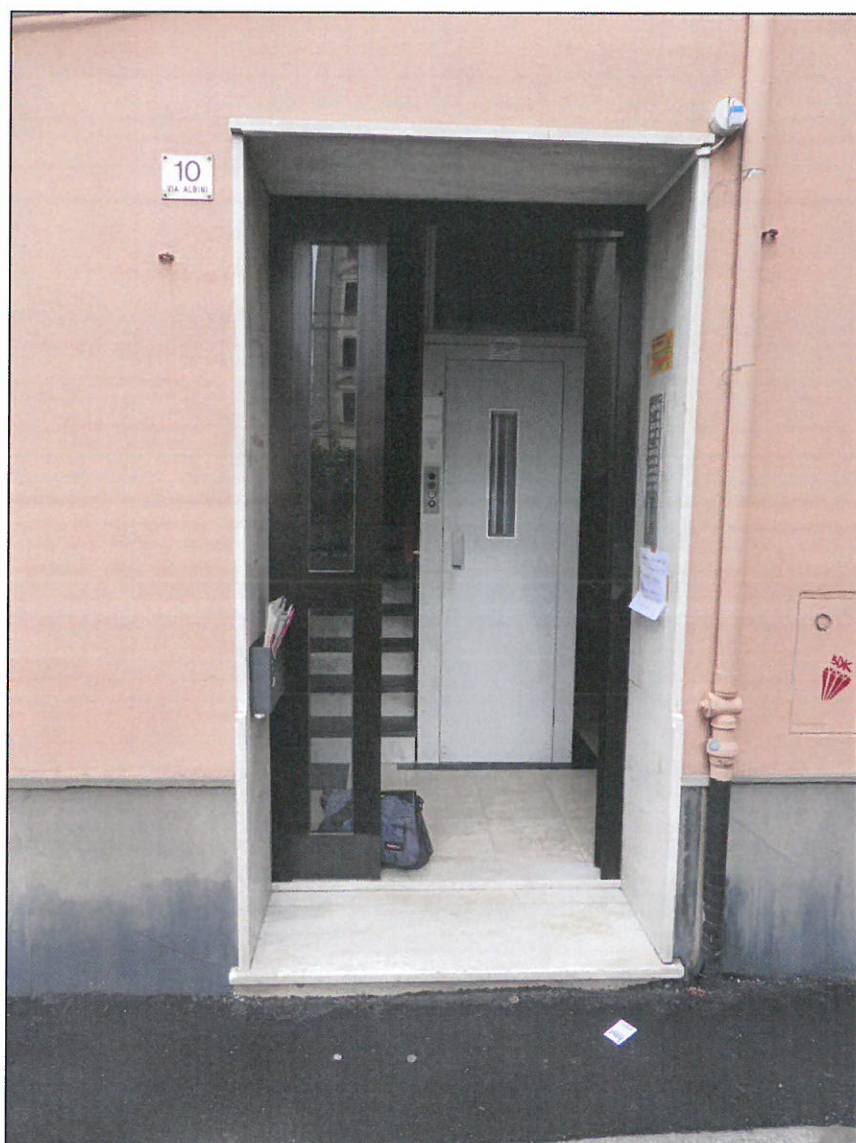
PORTONE D'INGRESSO E ATRIO CON ASCENSORE