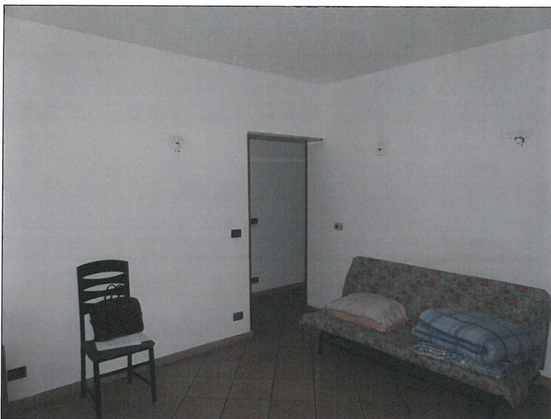
INGRESSO ALLA GENOVESE