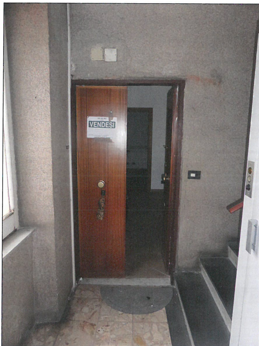
PORTONCINO D'INGRESSO APERTO