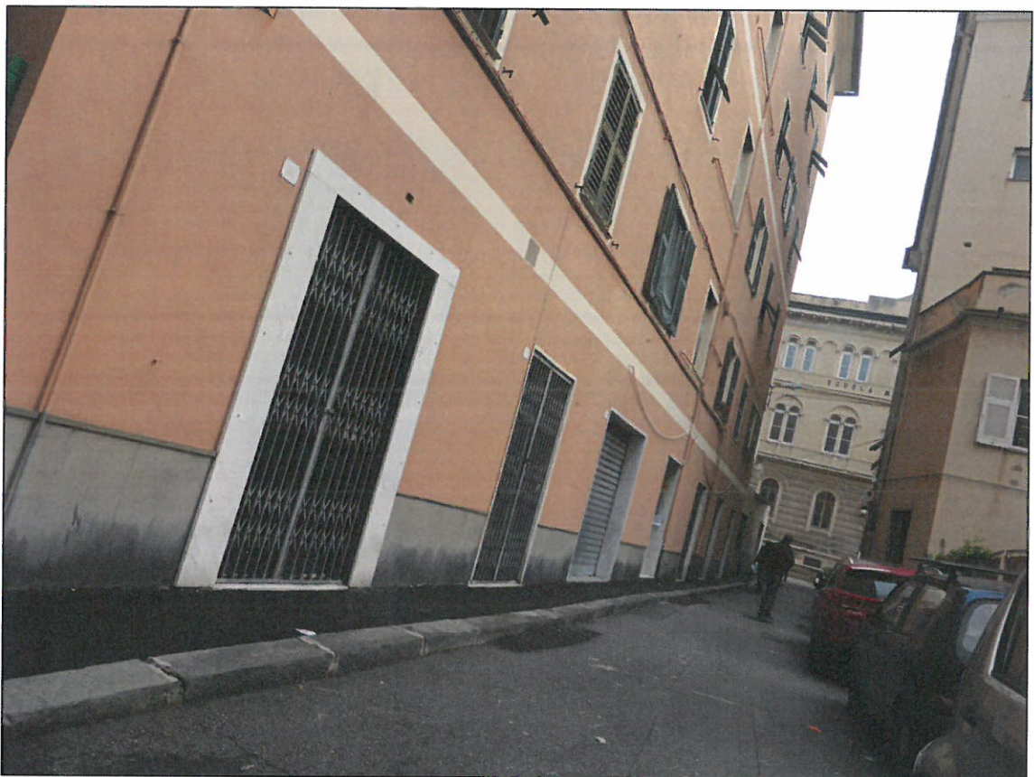
PROSPETTO SU VIA ALBINI CON PORTONE D'INGRESSO