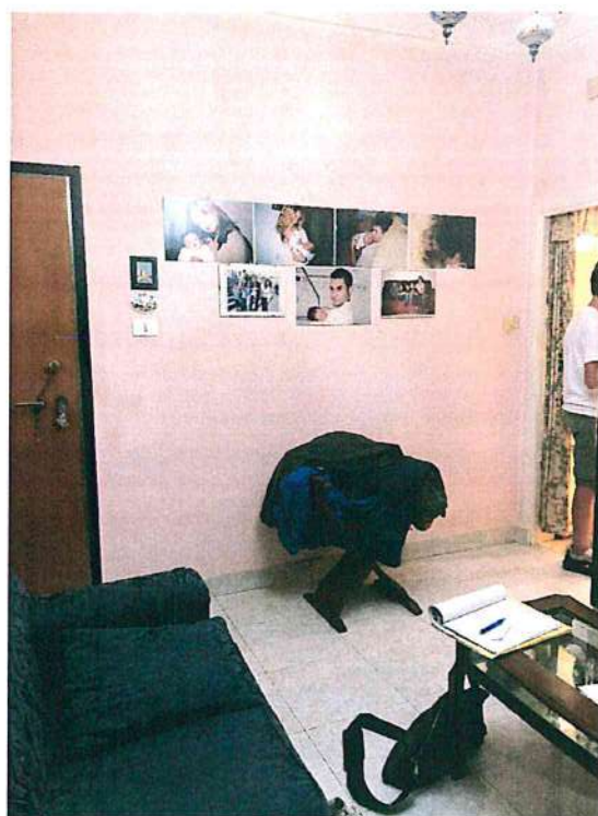
Foto 15—vista del soggiorno verso il vano scala e il disimpegno bagno-cucina.

Le fotografie di cui sopra rappresentano lo stato reale dei luoghi.