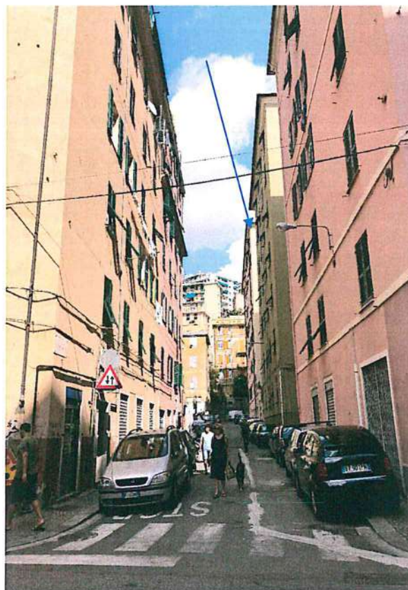
Foto 1—vista di Via V. Armirotti da sud ovest in prossimità dell'accesso al complesso condominiale