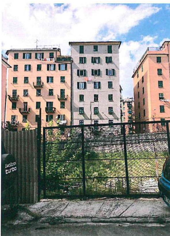
Foto 3— vista vdel contesto erso nord dal lato dell'accesso al cortile condominiale

Le fotografie di cui sopra rappresentano lo stato reale dei luoghi.