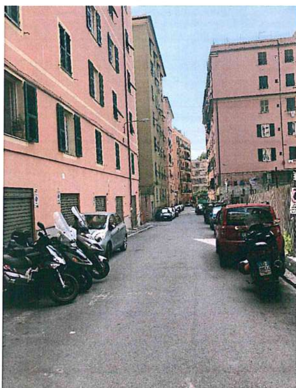
Foto 2— vista di Via V. Armirotti e dell'edificio in oggetto da nord-est