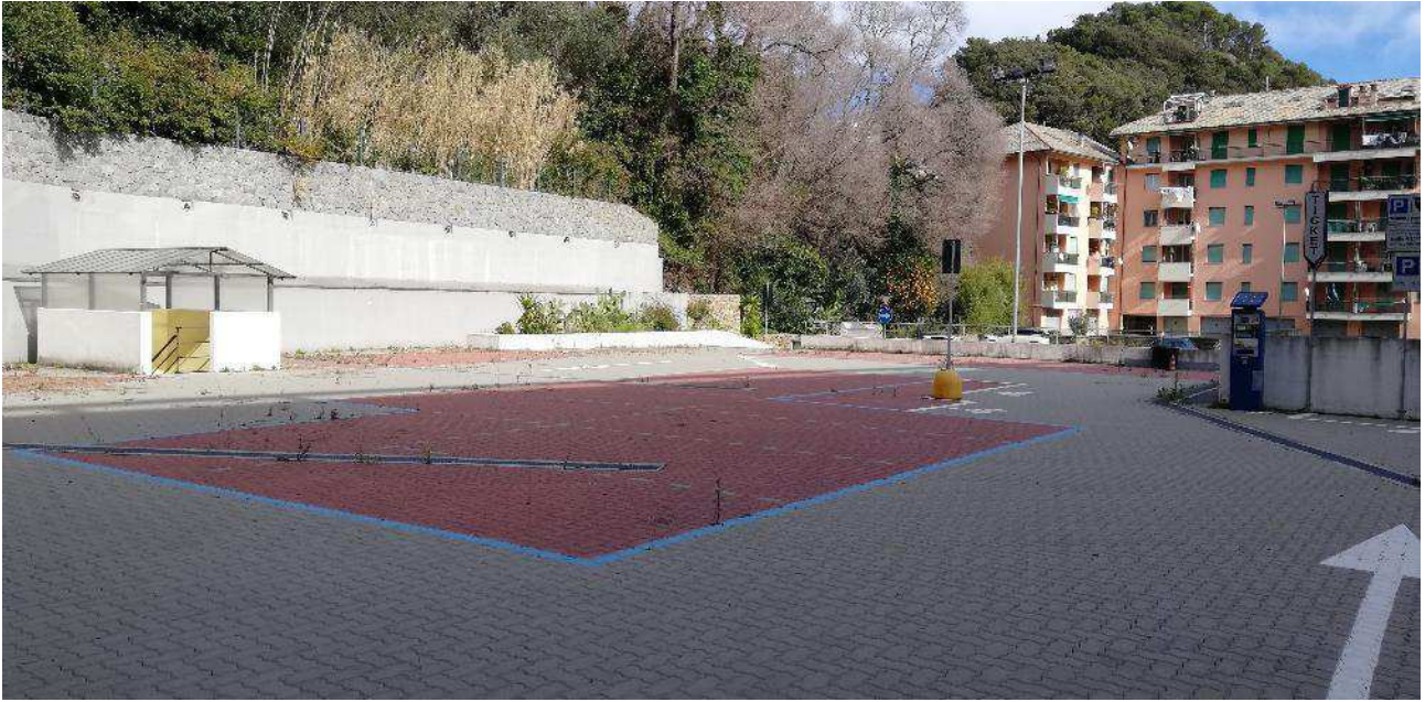
VISTA COPERTURA AUTORIMESSA