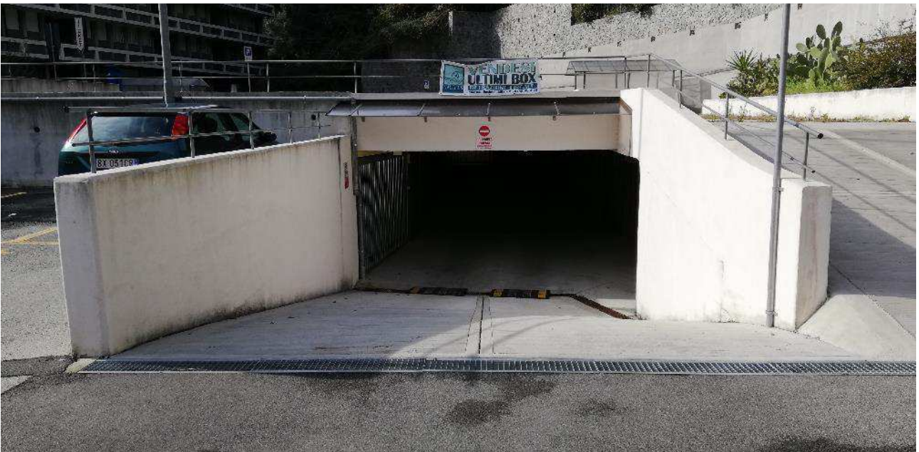
VISTA ACCESSO CARRABILE