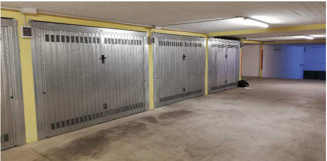
VISTA AREA DI MANOVRA