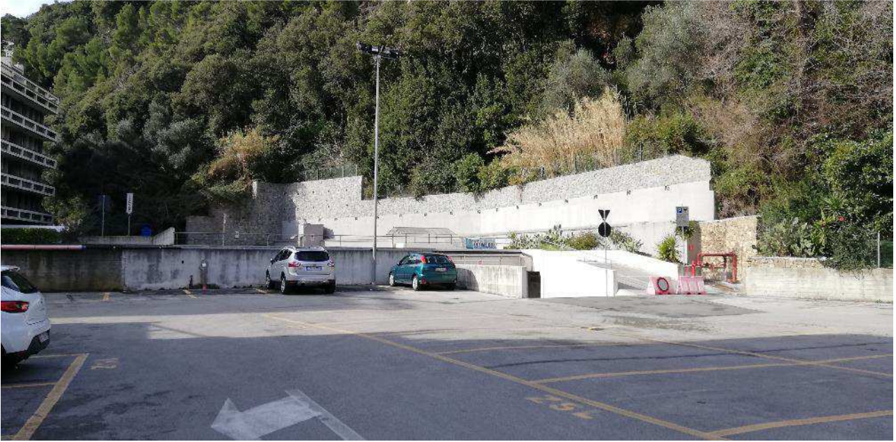
VISTA ESTERNA AUTORIMESSA