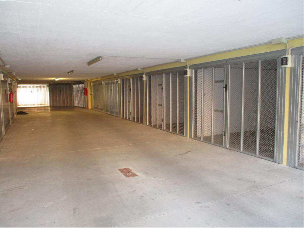
VISTA AREA DI MANOVRA