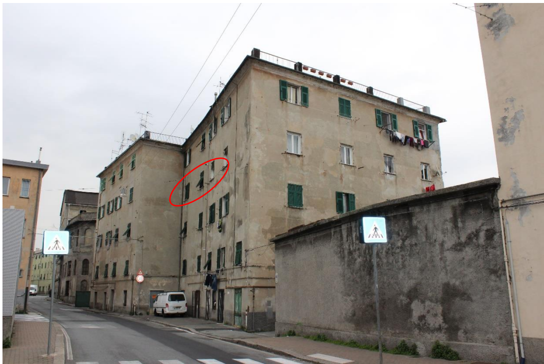
prospetto ovest e prospetto sud