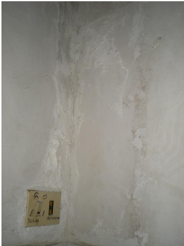
dettaglio parete cucina