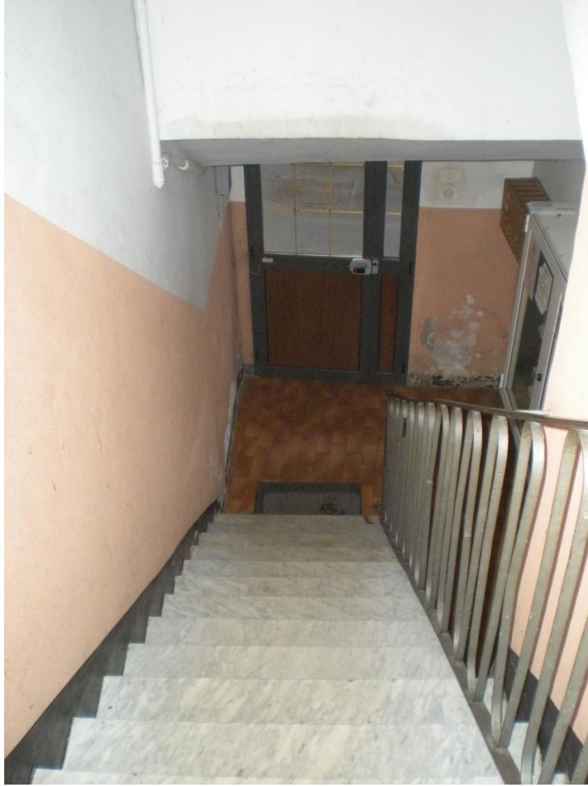
vano scale atrio