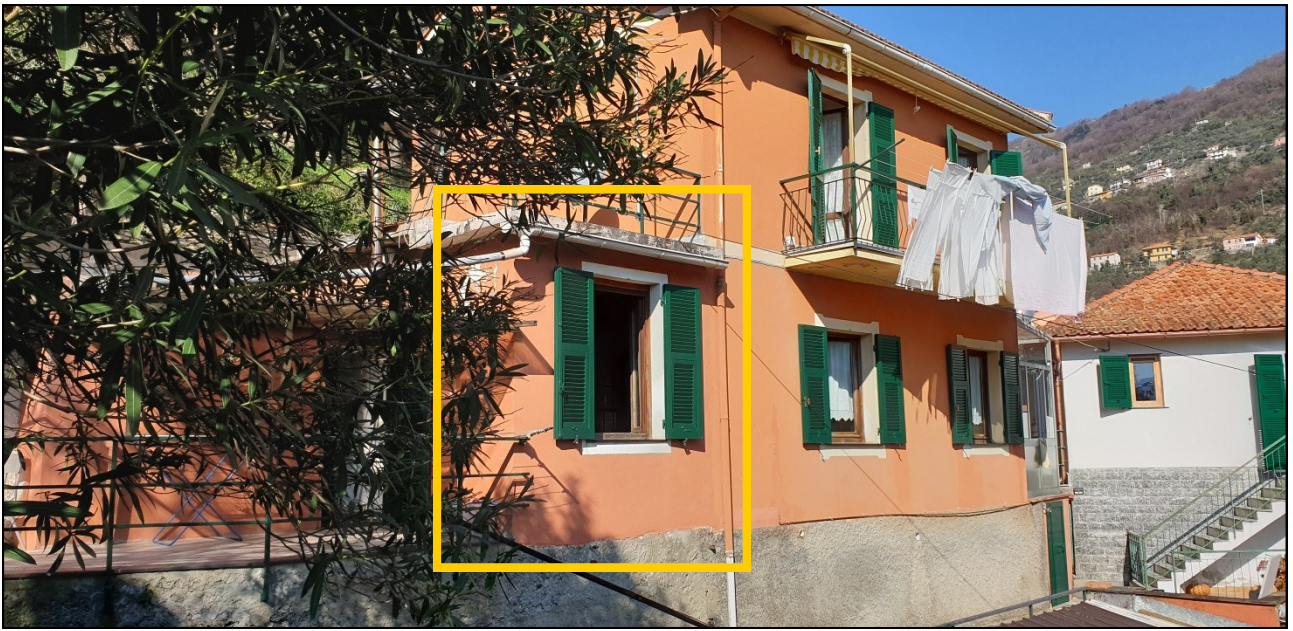
FOTO 4 —VISTA della CASA—(nel riquadro evidenziato ampliamento locale cucina)