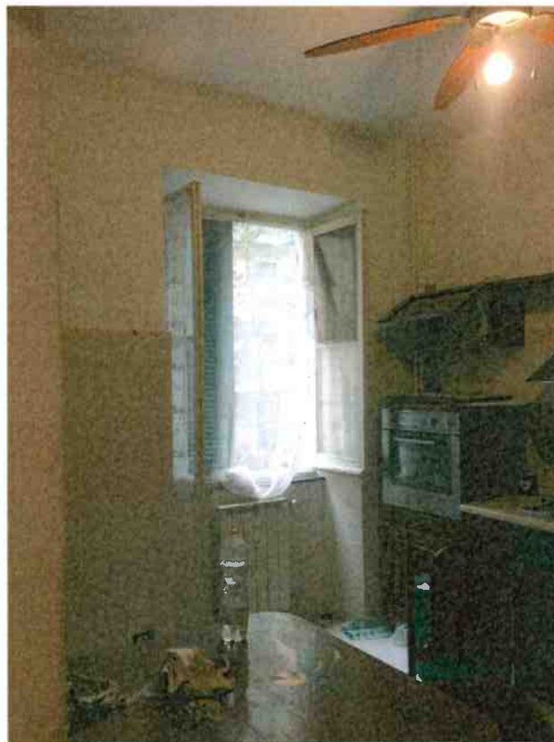
FOTO N. 12 Cucina.