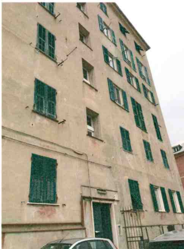
FOTO N. 3 Vista del prospetto est del fabbricato.