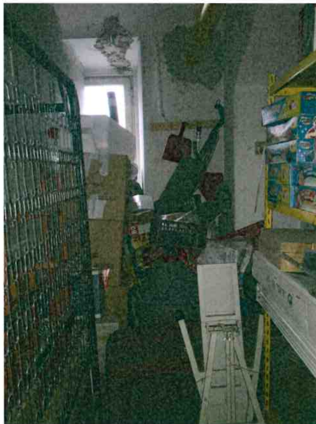
FOTO N. 16 Cantina.