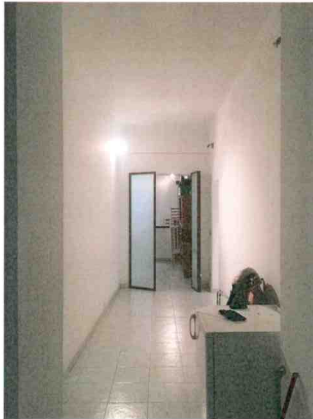
FOTO N. 7 Corridoio.