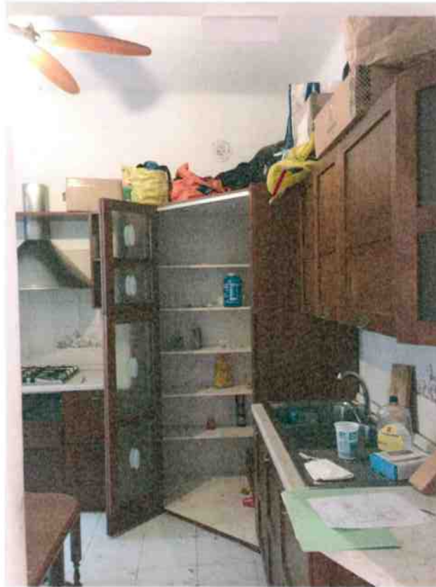
FOTO N. 13 Cucina.