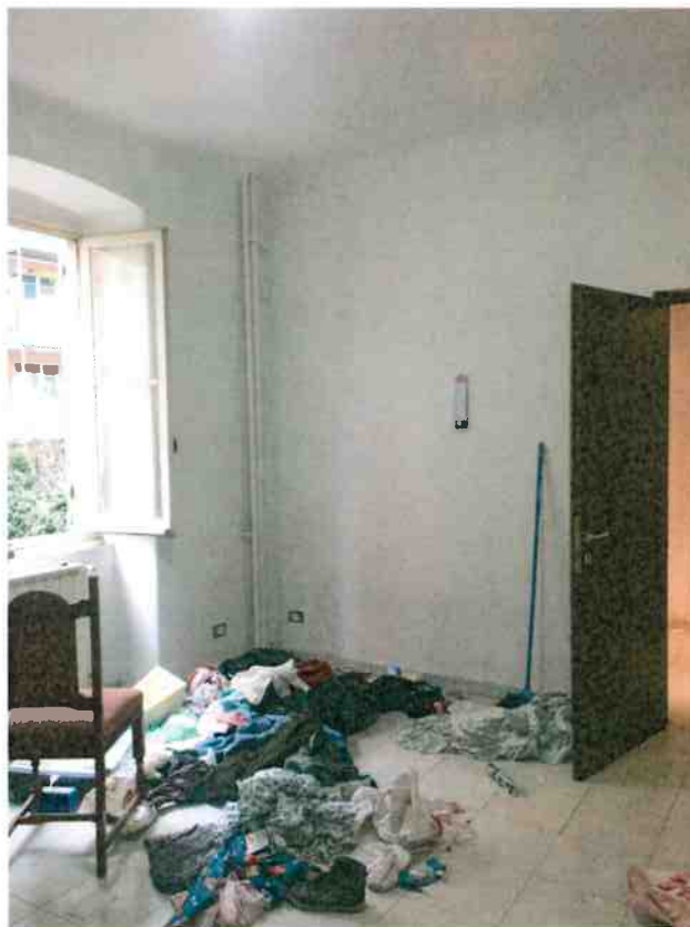
FOTO N. 10 Ulteriore ripresa della camera adiacente al bagno.