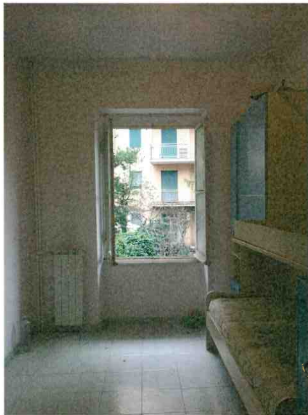
FOTO N. 6 Cameretta adiacente alla cucina.