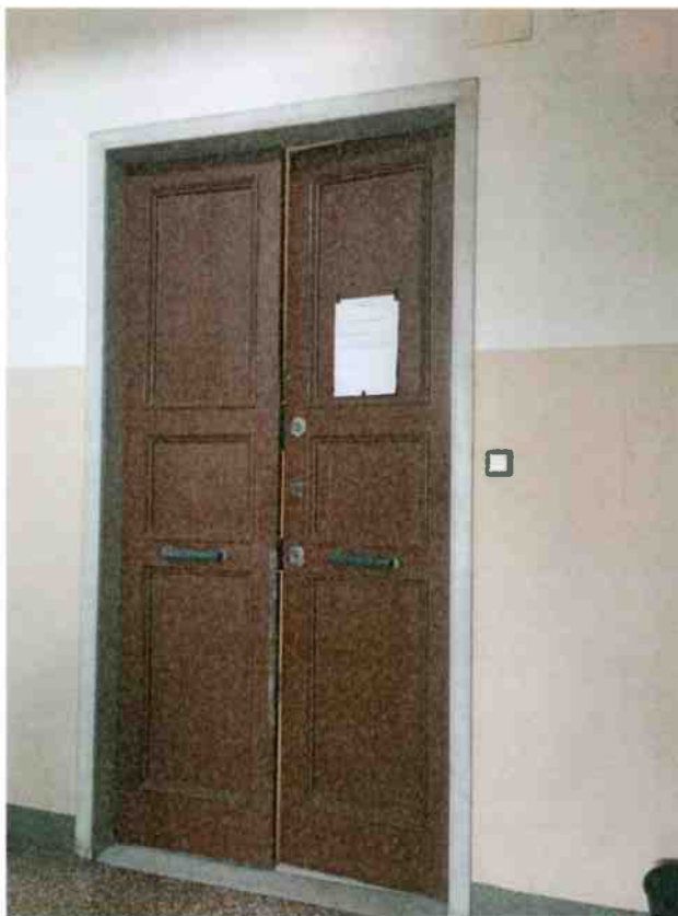
FOTO N. 4 Porta d'ingresso dell'appartamento in oggetto di esecuzione.