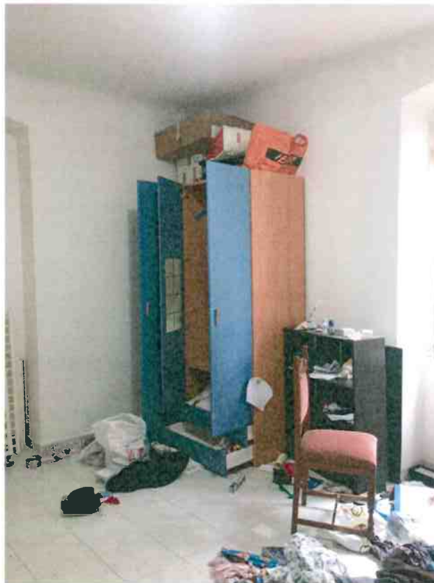
FOTO N. 9 Camera adiacente al bagno.