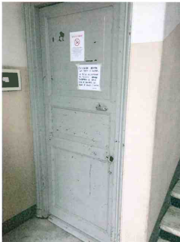
FOTO N. 14 Porta d'ingresso alle cantine, situate nell'edificio civico 7, di Via San Fermo.