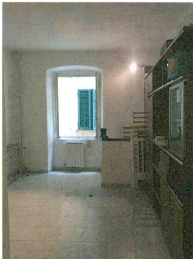
FOTO N. 8 Camera.