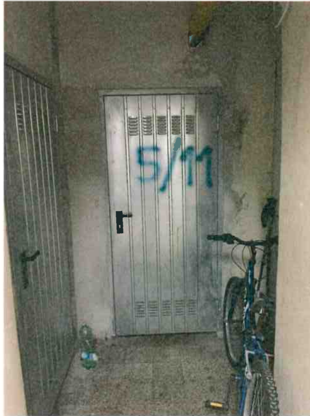
FOTO N. 15 Porta d'ingresso alla cantina dell'appartamento interno 11 di Via San Fermo civico 5.