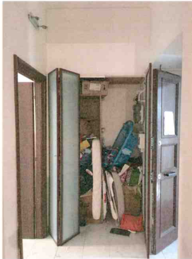
FOTO N. 5 Ingresso.