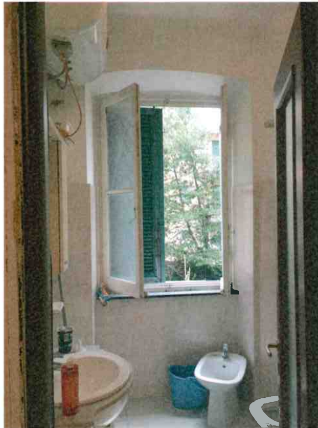
FOTO N. 11 Bagno.