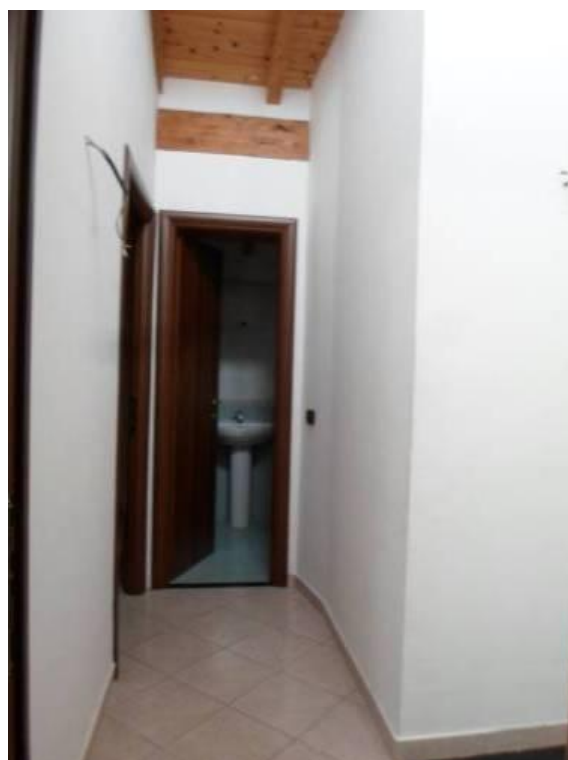
FOTO N. 8 Disimpegno al primo piano mansardato.