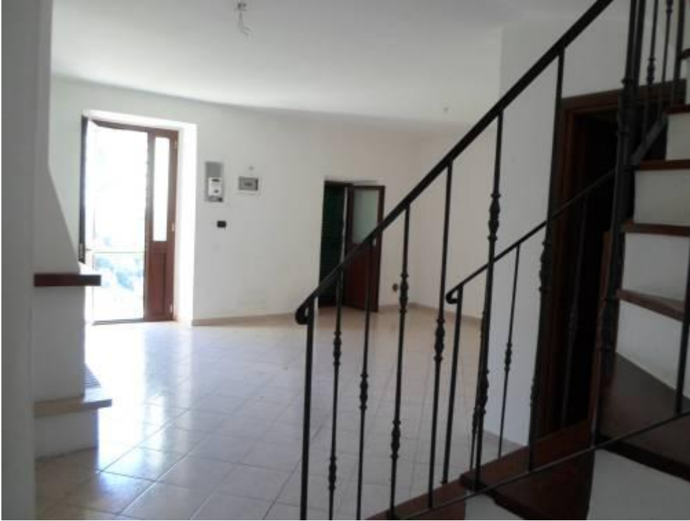
FOTO N. 5 Ripresa del soggiorno.