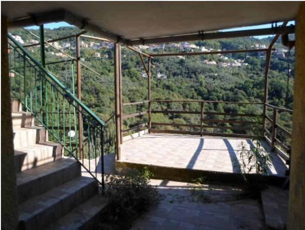
FOTO N. 14 Ripresa fotografica del terrazzo dalla loggia.