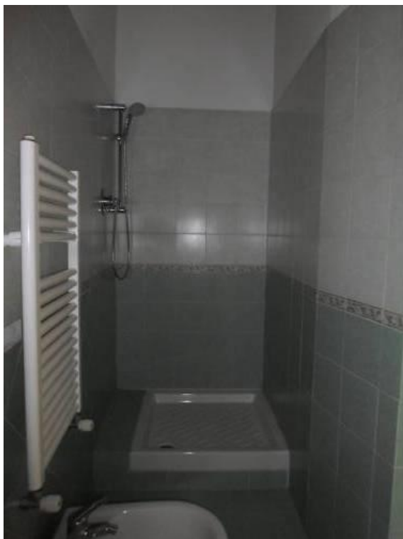
FOTO N. 11 Bagno al piano primo mansardato.