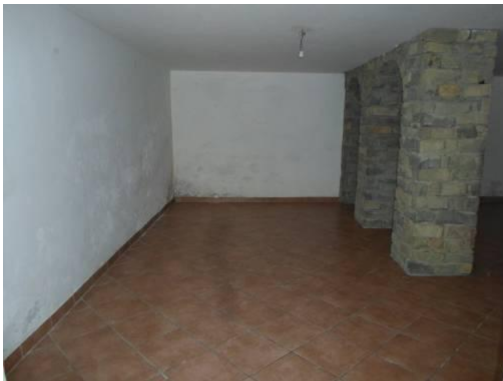
FOTO N. 12 Vista della cantina al piano seminterrato.