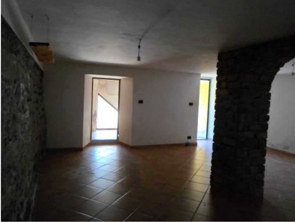
FOTO N. 13 Ulteriore ripresa della cantina e dell'accesso al vano ripostiglio.