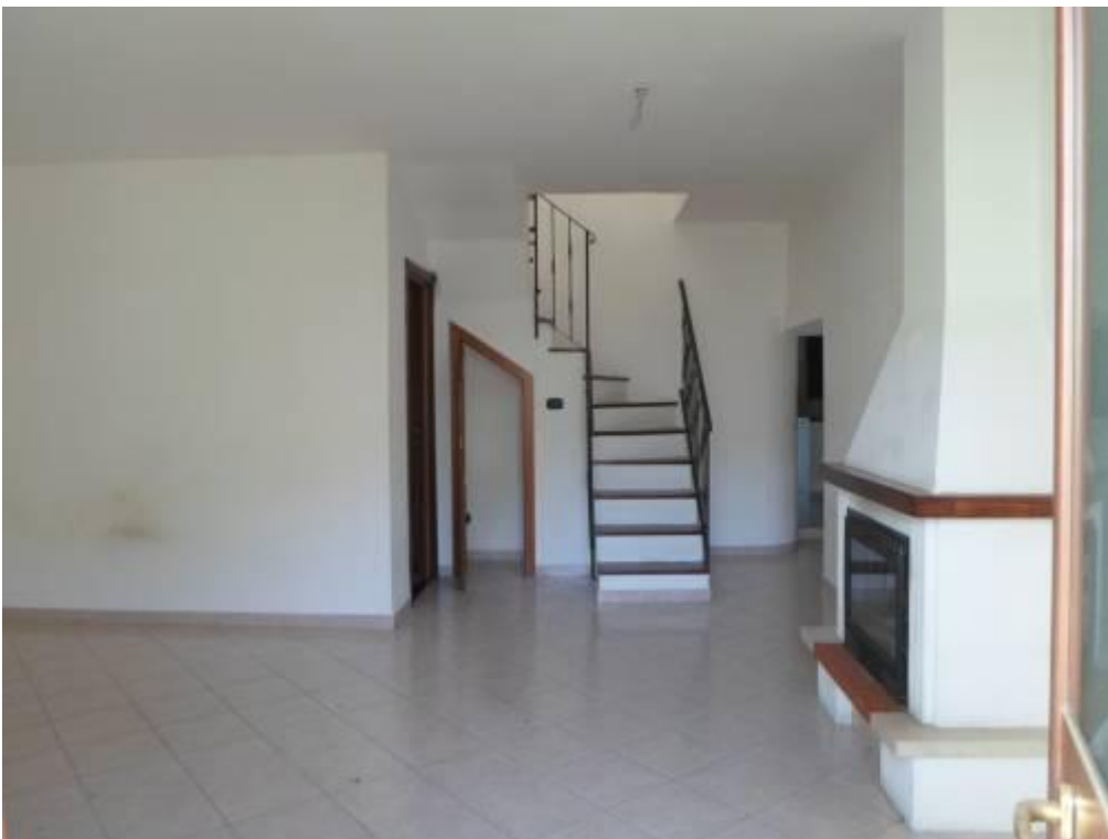
FOTO N. 6 Ulteriore vista del soggiorno.