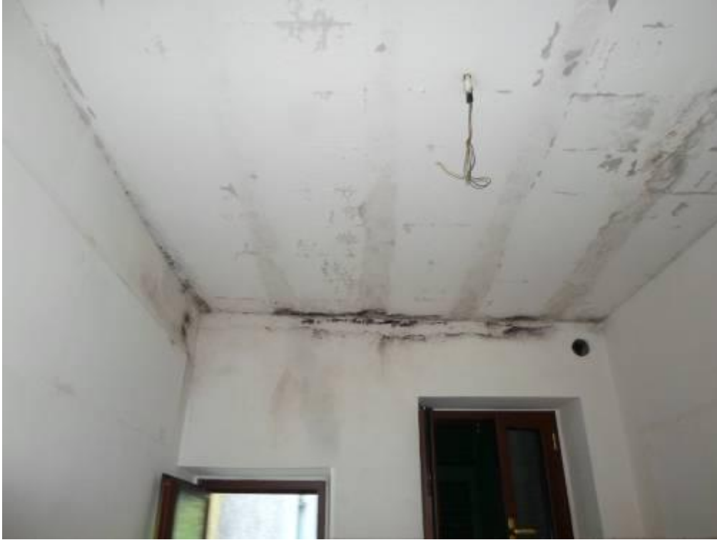
FOTO N. 3 Dettaglio fotografico dei danni causati dall'umidità nel vano cucina.