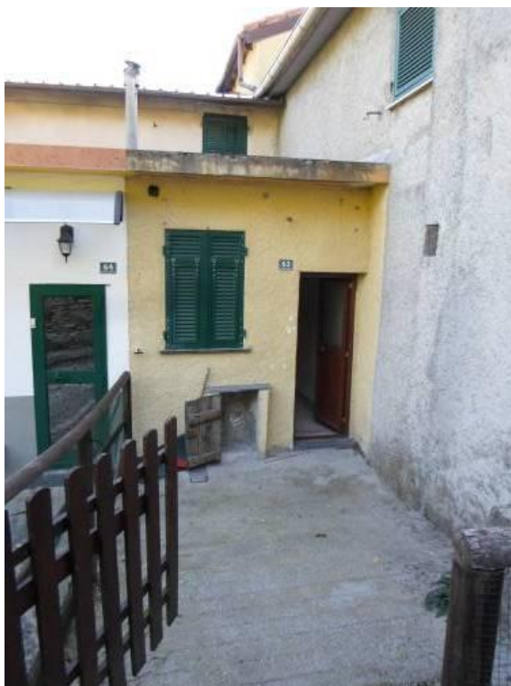
FOTO N. 1 Vista della porta di accesso all'immobile.