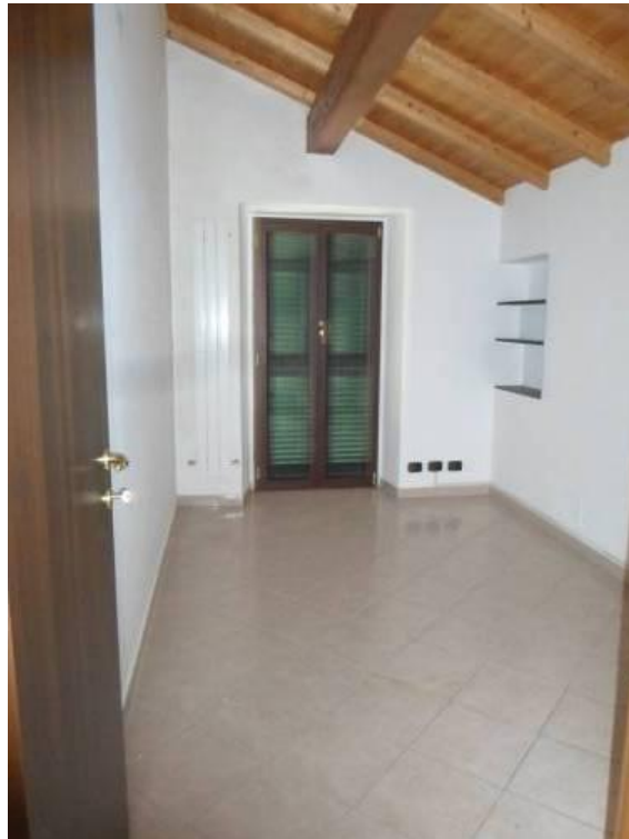
FOTO N. 10 Ripresa della cameretta adiacente al bagno.