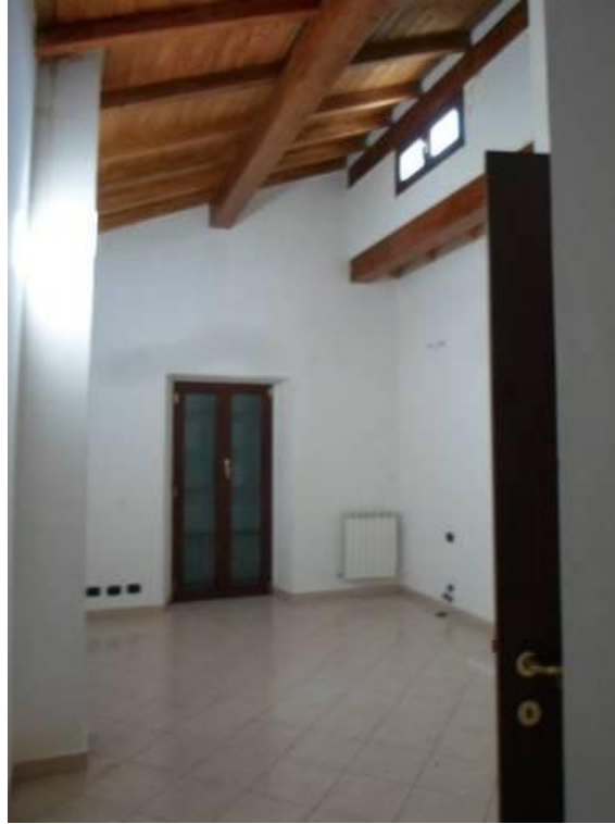
FOTO N. 9 Vista della camera matrimoniale.