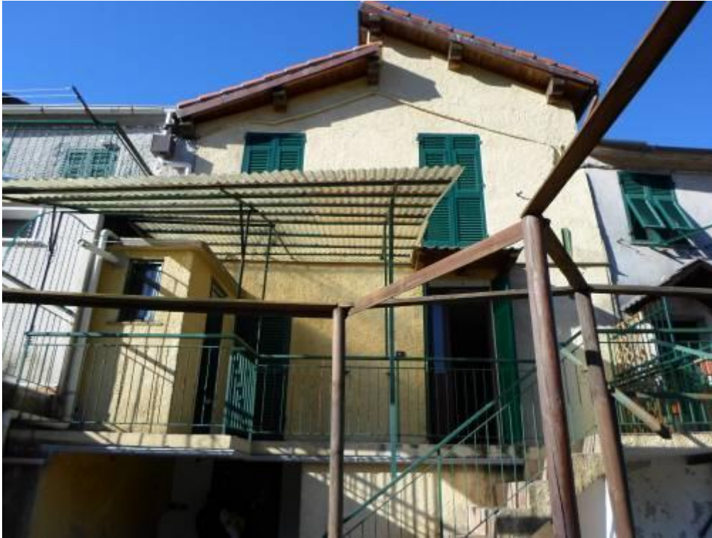
FOTO N. 15 Inquadratura esterna della facciata superiore di nord-ovest dell'abitazione.