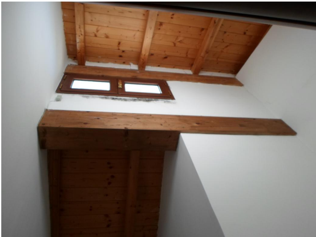
FOTO N. 20 Dettaglio fotografico dei danni causati dall'umidità presenti nella parete del vano scale di collegamento tra il piano terreno e il piano primo mansardato.