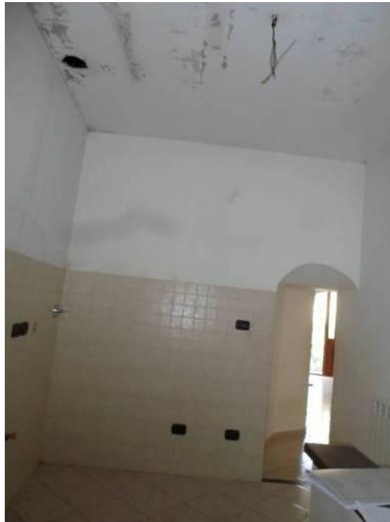
FOTO N. 4 Ulteriore dettaglio fotografico dei danni causati dall'umidità collocati nel vano cucina.