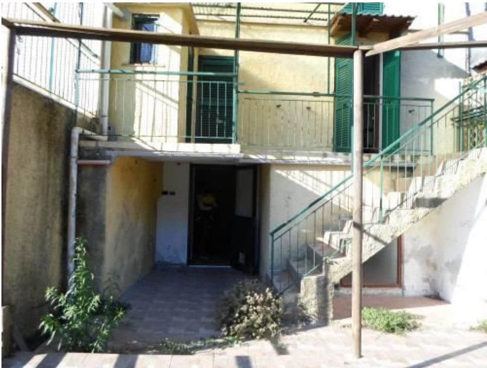
FOTO N. 16 Inquadratura esterna della facciata inferiore di nord-ovest dell'abitazione.