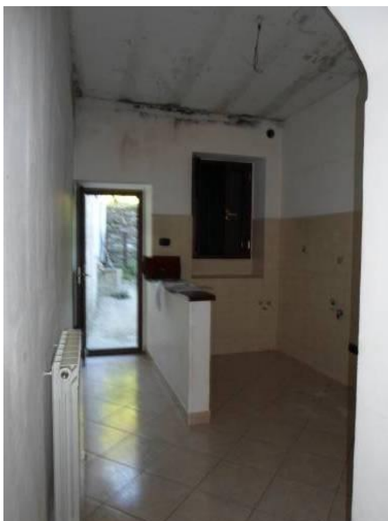
FOTO N. 2 Vista dell'ingresso e della cucina.