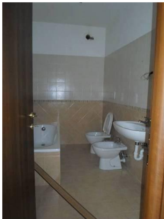
FOTO N. 7 Ripresa del bagno al piano terreno.