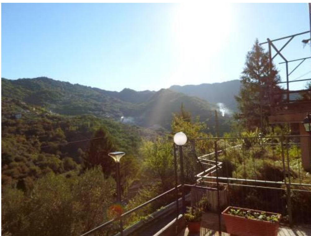
FOTO N. 18 Panoramica della vallata ripresa dal terrazzo.