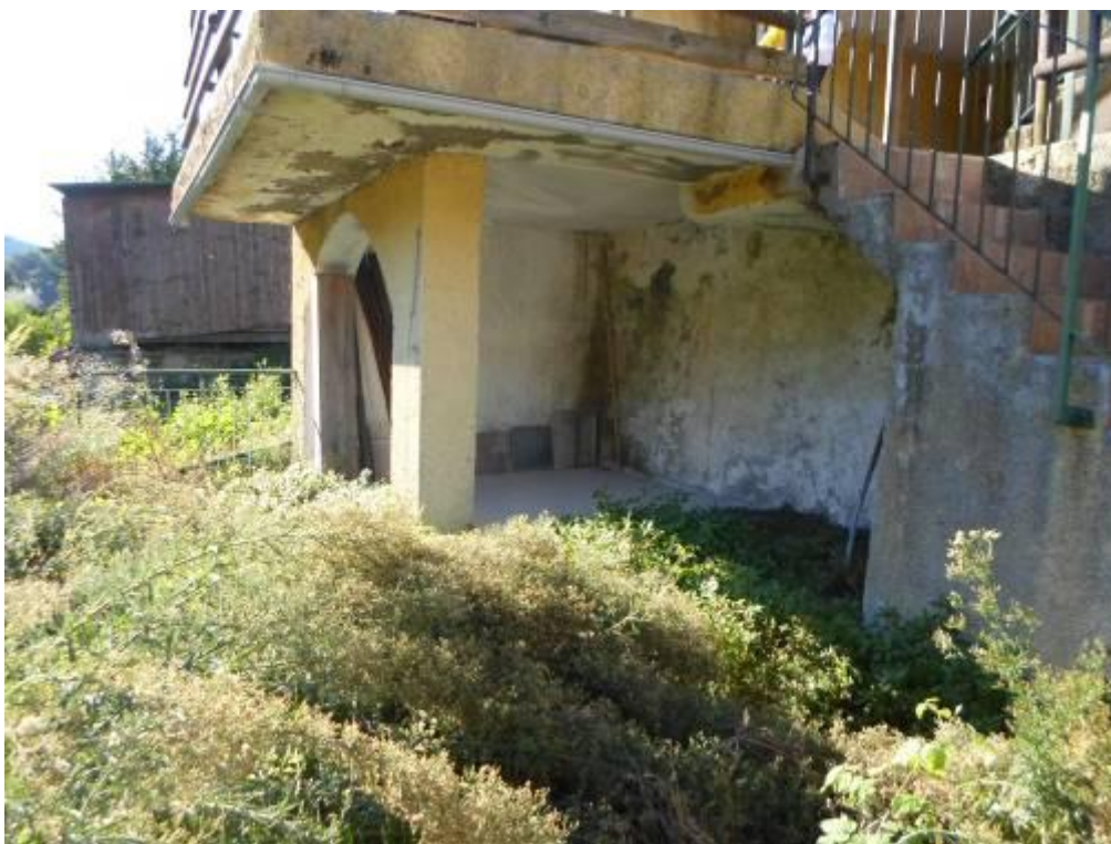
FOTO N. 17 Ripresa del deposito.