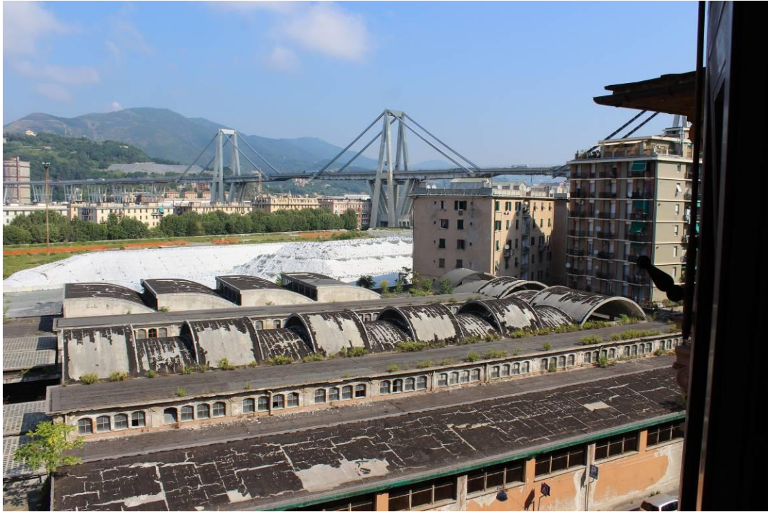
Vista verso nord