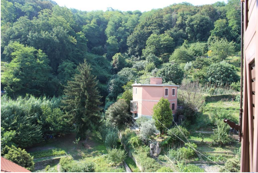
Vista verso sud – Parco odella Nora