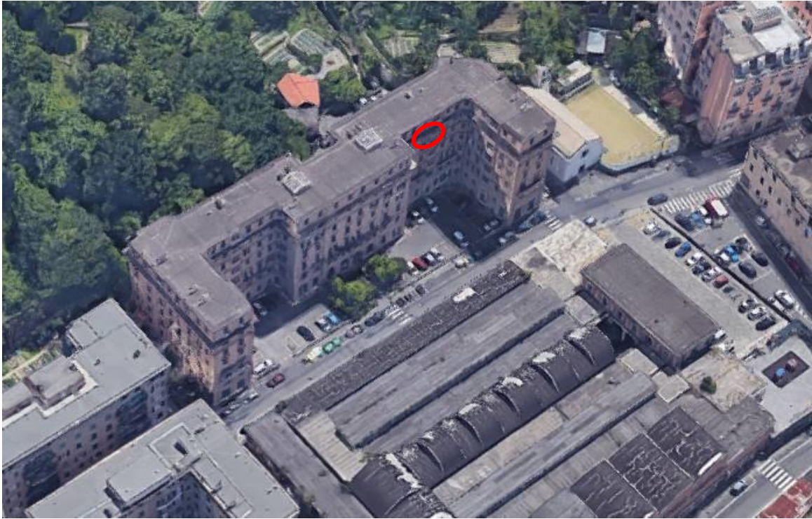
Edificio Via A. Pellegrini civv. 3-13 prospetti nord-ovest e nord-est – in evidenza l'immobile int. 16 del civ. 5