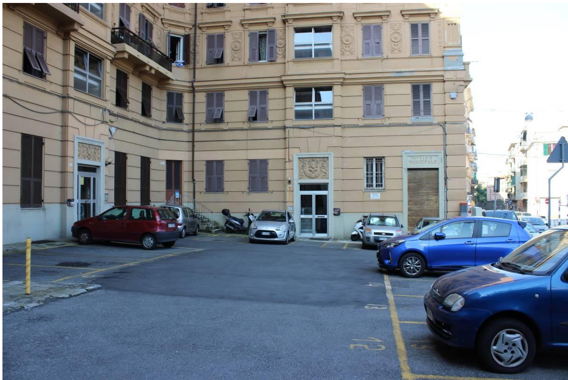
Spazio condominiale antistante l'edificio – I posti auto sono di proprietà