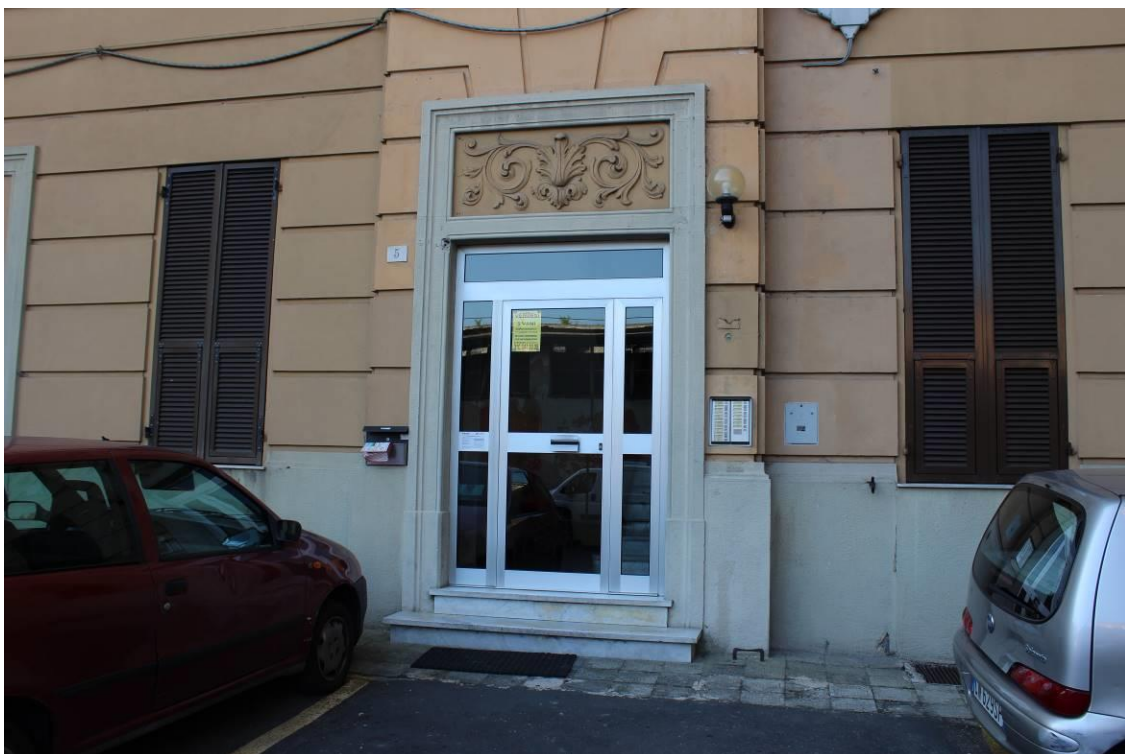
Civico 5 di Via A. Pellegrini