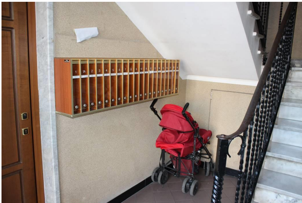
Androne civ. 5