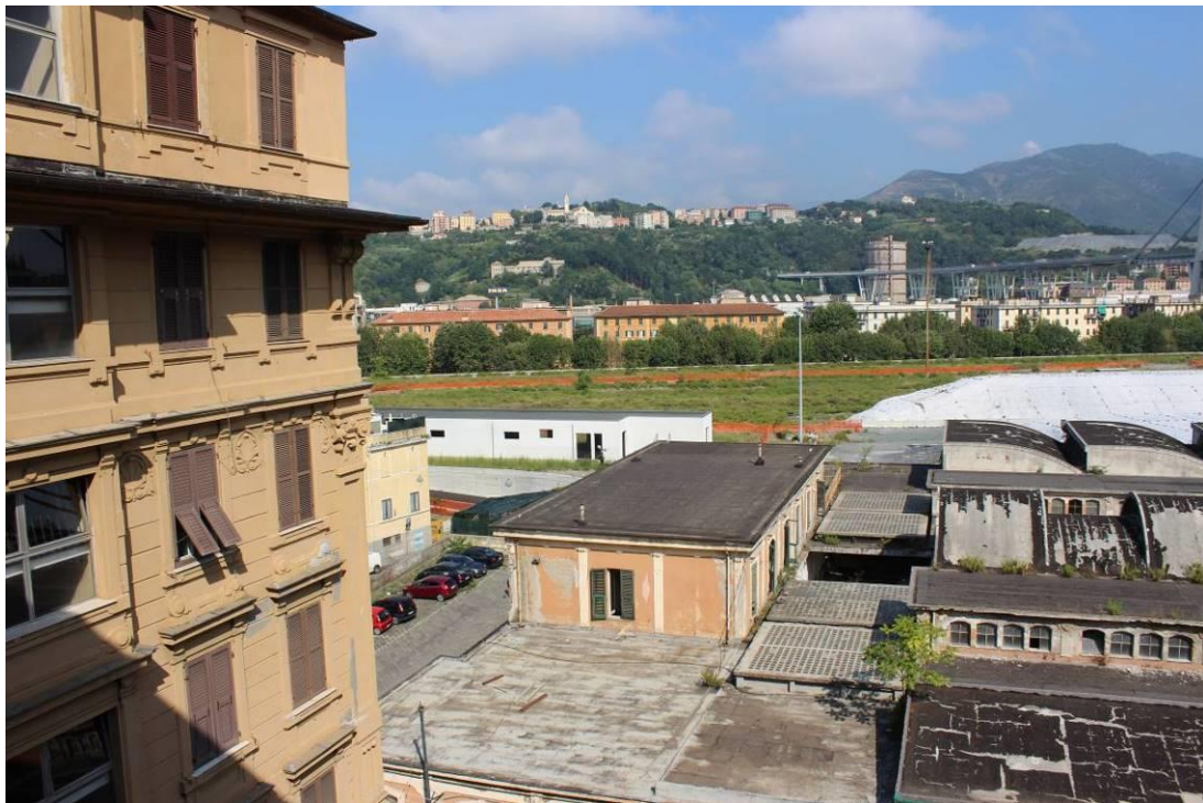
Vista verso ponente