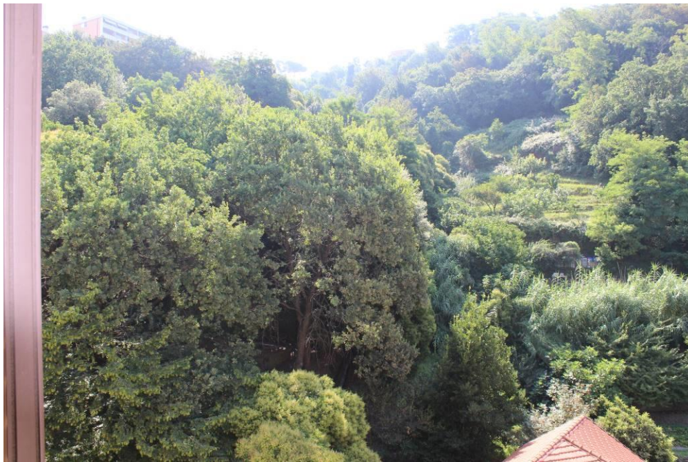
Vista verso levante – Parco della Nora