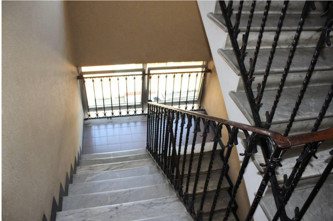
vano scale civ. 5