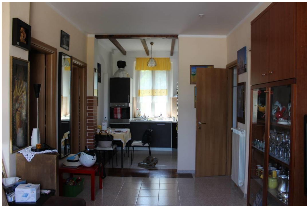
Cucina vista dal soggiorno