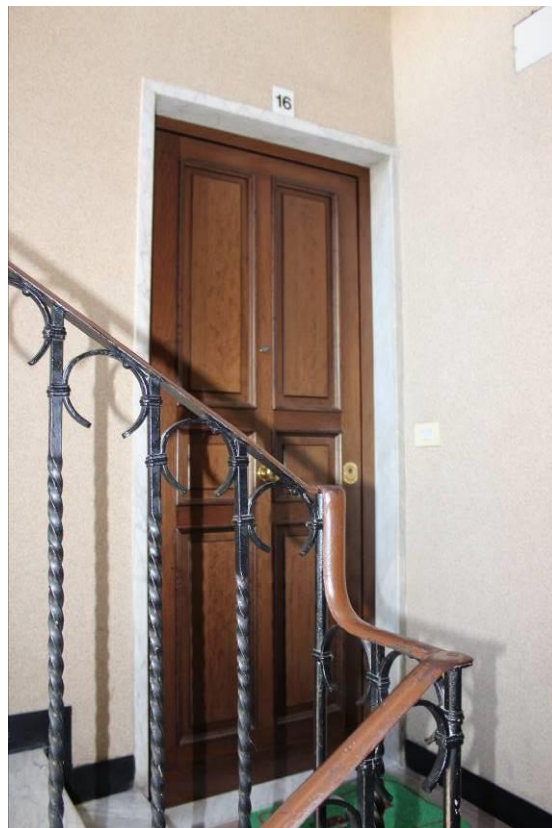
Porta caposcala interno 16