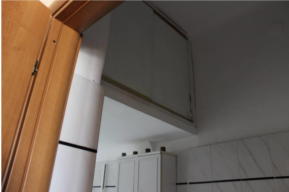
Soppalco nel servizio igienico