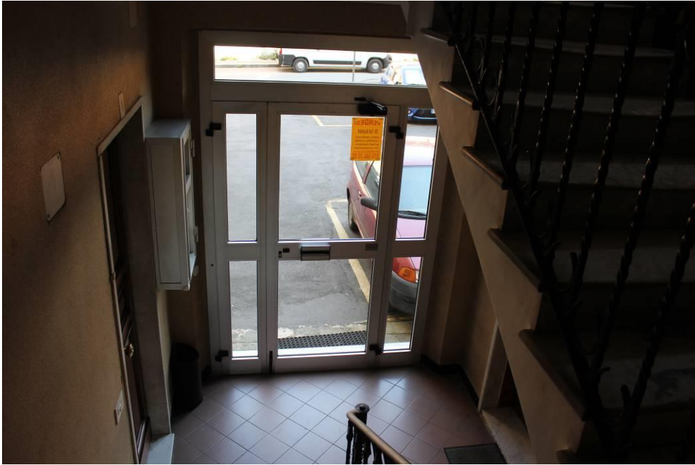
Androne civ. 5