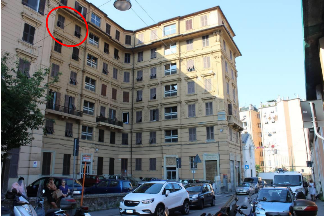
Via A. Pellegrini – prospetto principale