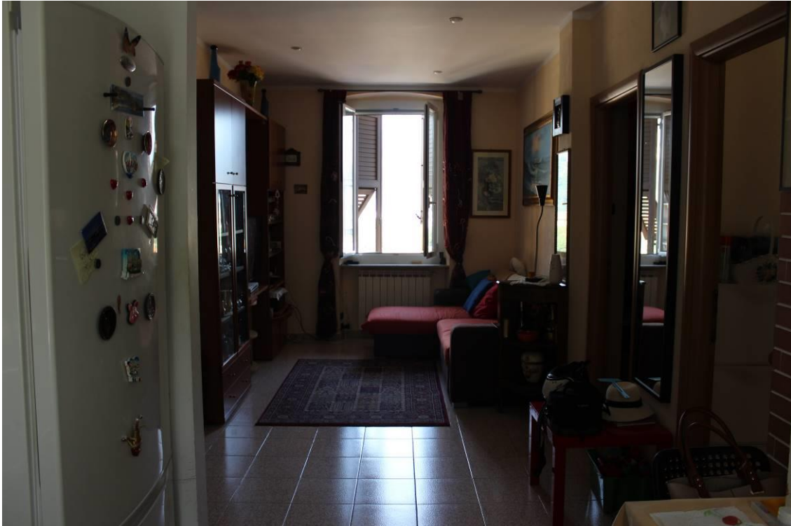
Soggiorno visto dalla cucina