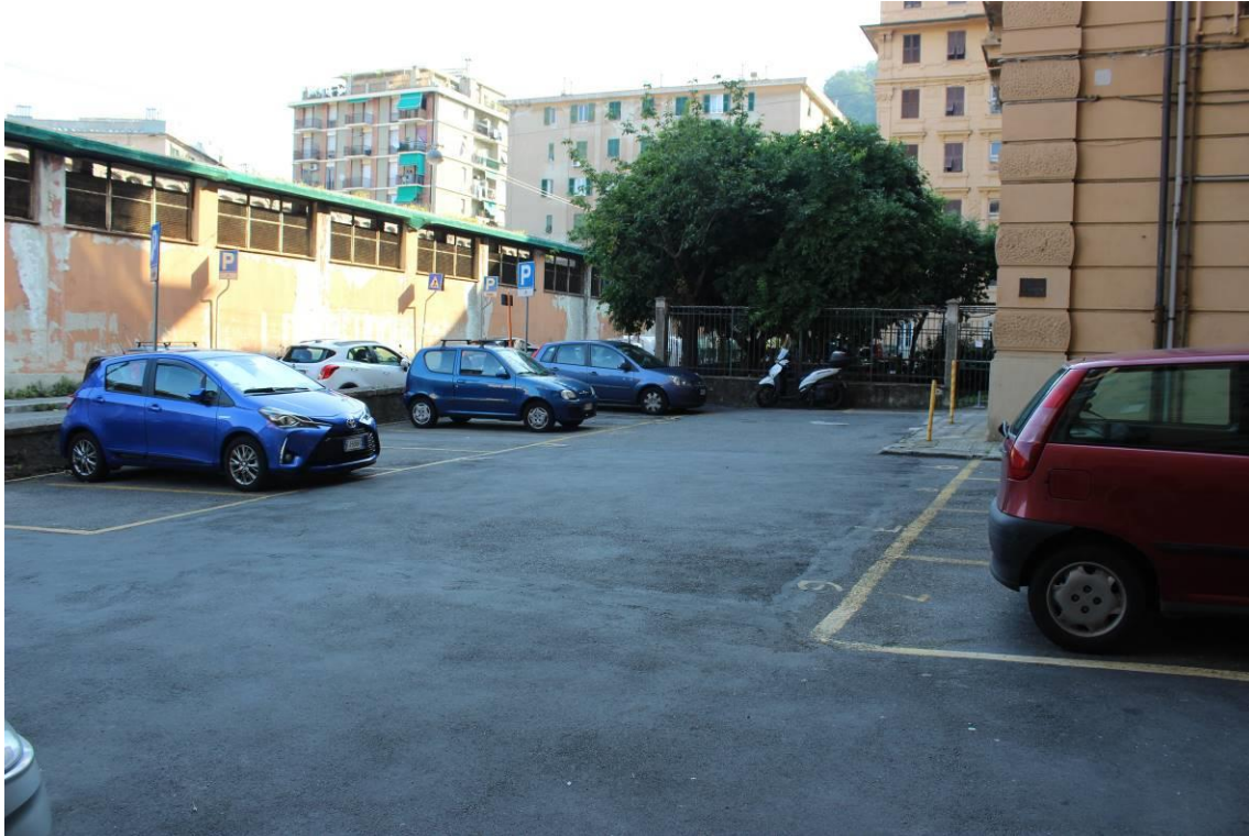
Spazio antistante l'edificio – sullo sfondo l'ex mercato avicolo