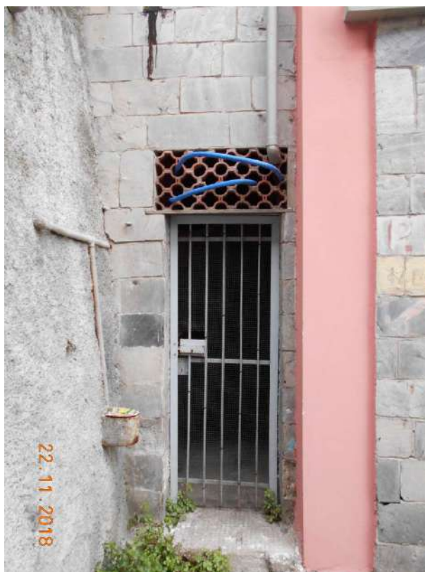
FOTO N. 24 – ACCESSO A CANTINE (NON ISPEZIONABILE PER MANCANZA CHIAVI)