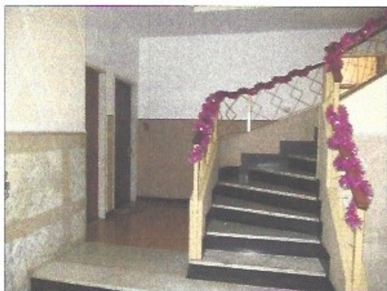
Atrio di ingresso