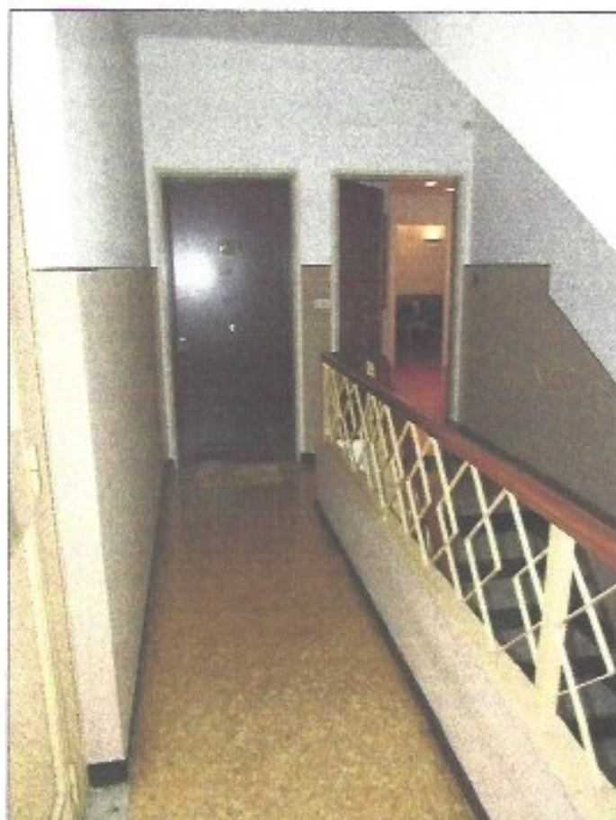
Portoncino caposcala visto dal vano scale