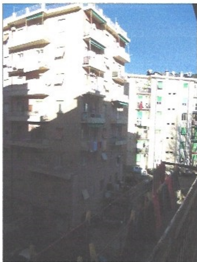
Vista esterna dalla balconata