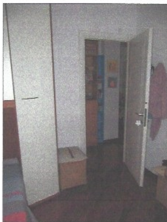
Camera da letto singola