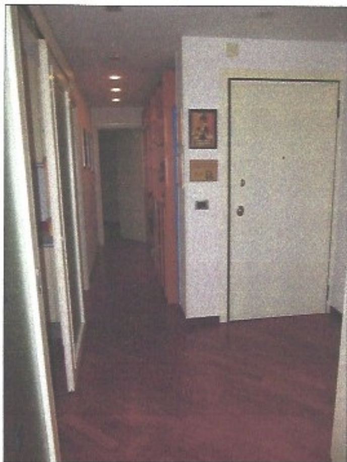
Ingresso e corridoio