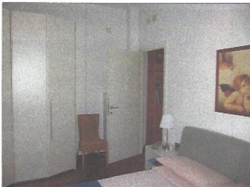
Camera da letto matrimoniale