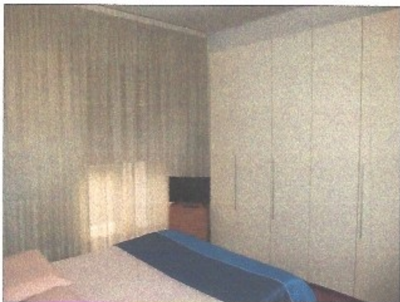
Camera da letto matrimoniale