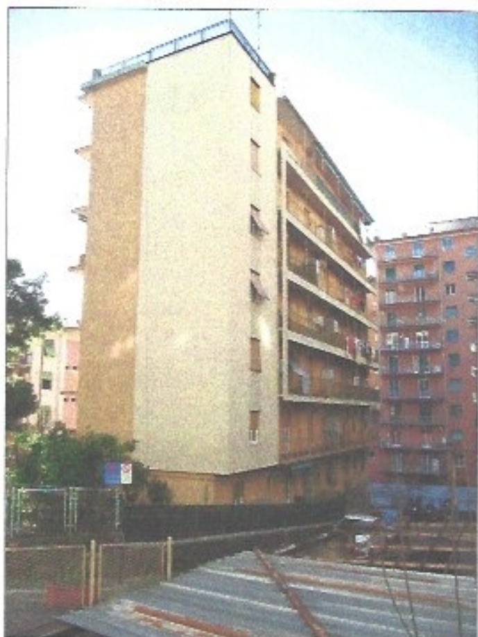
Vista del caseggiato