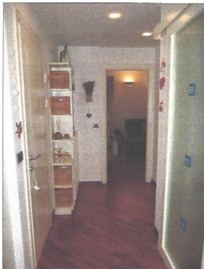
Ingresso e corridoio