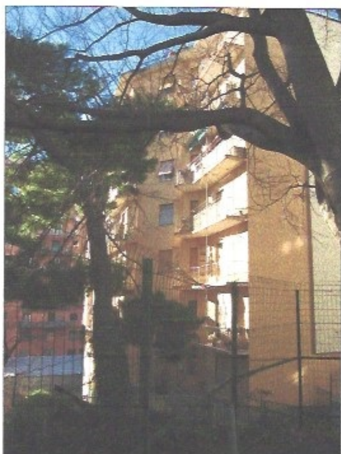
Vista del caseggiato