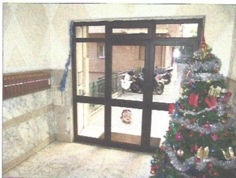
Atrio di ingresso