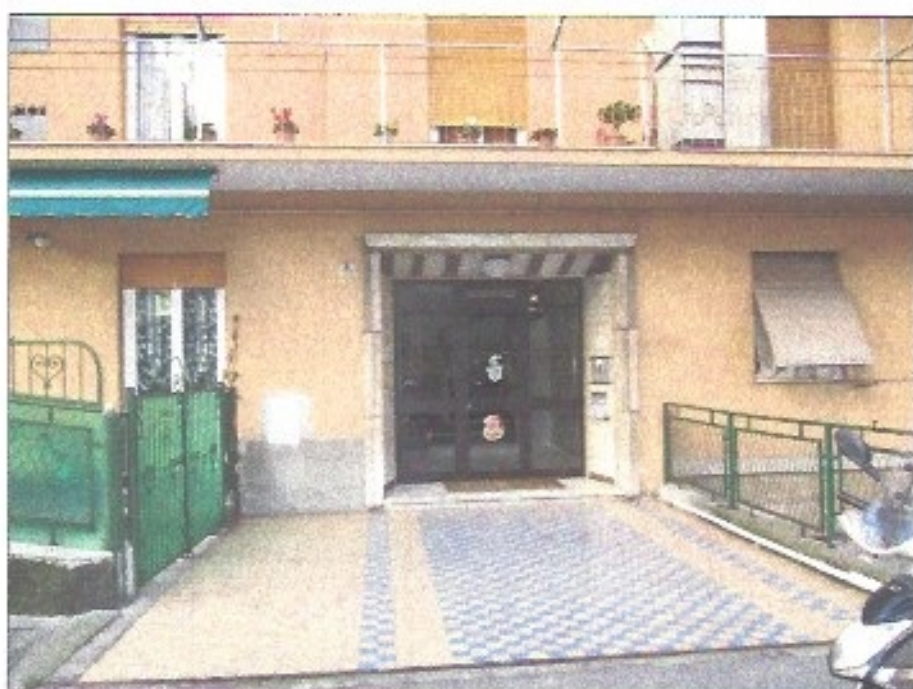
Vista dell'ingresso dall'esterno