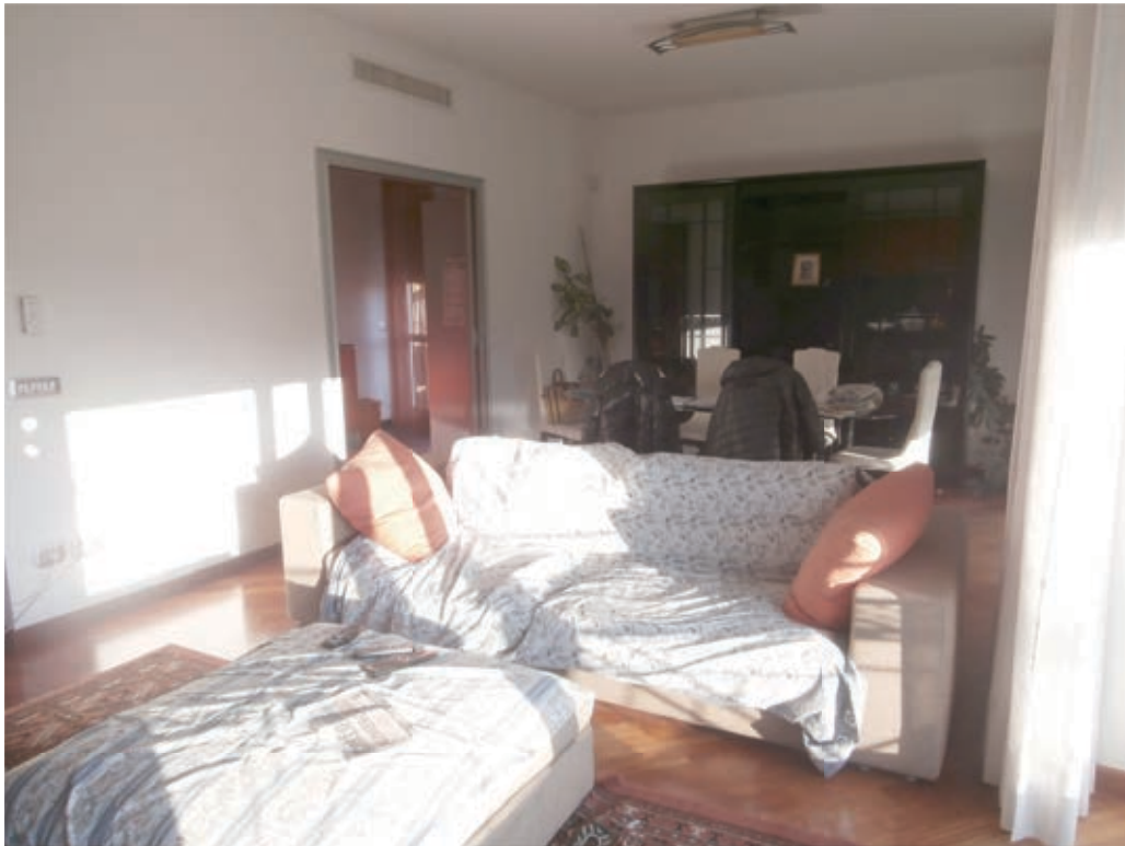
FOTOGRAFIA N° 10 COMMENTI. Altro punto di vista del soggiorno.