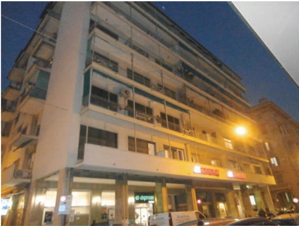
FOTOGRAFIA N° 2

COMMENTI: Vista esterna del Condominio di Via Nino Bixio 13.