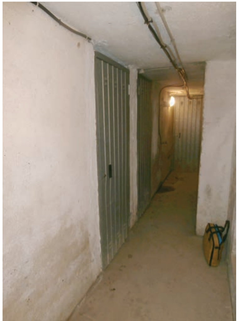
FOTOGRAFIA N° 20

COMMENTI: Vista della scala interna condominiale, che conduce al livello seminterrato delle cantine.