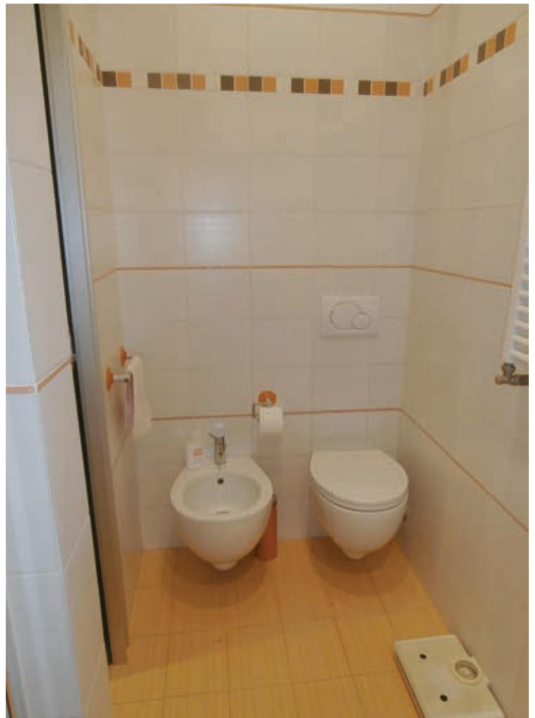
FOTOGRAFIA N° 16 COMMENTI: Vista del bagno secondario