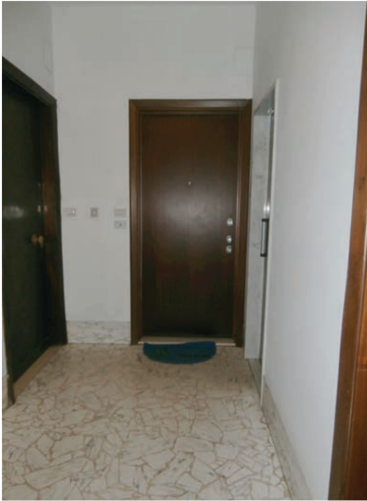
FOTOGRAFIA N° 7

COMMENTI: Vista dal pianerottolo condominiale del quinto piano, della porta di accesso all'interno 15.