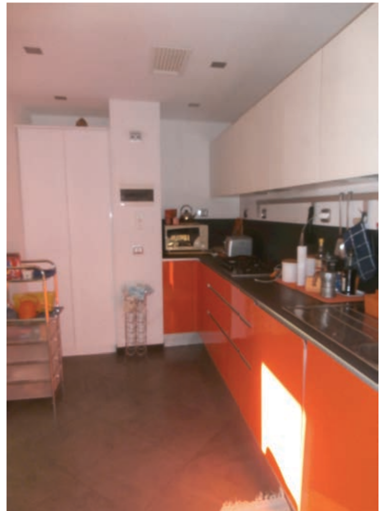
FOTOGRAFIA N° 12 COMMENTI: Vista della cucina.