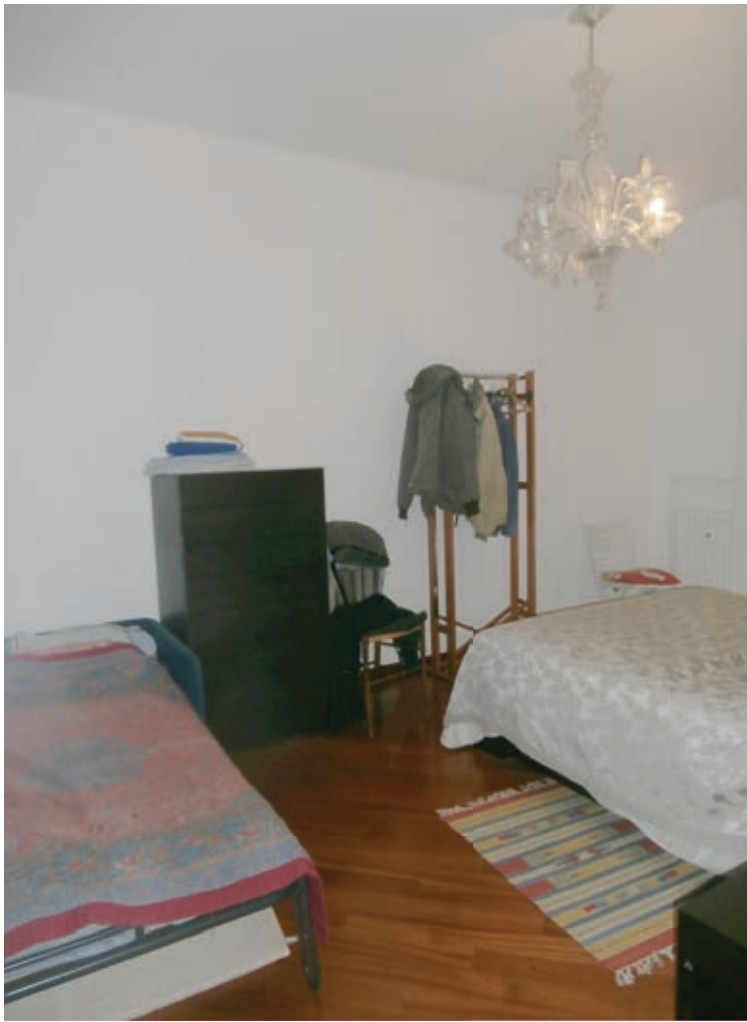
FOTOGRAFIA N° 13 COMMENTI: Vista della camera da letto.