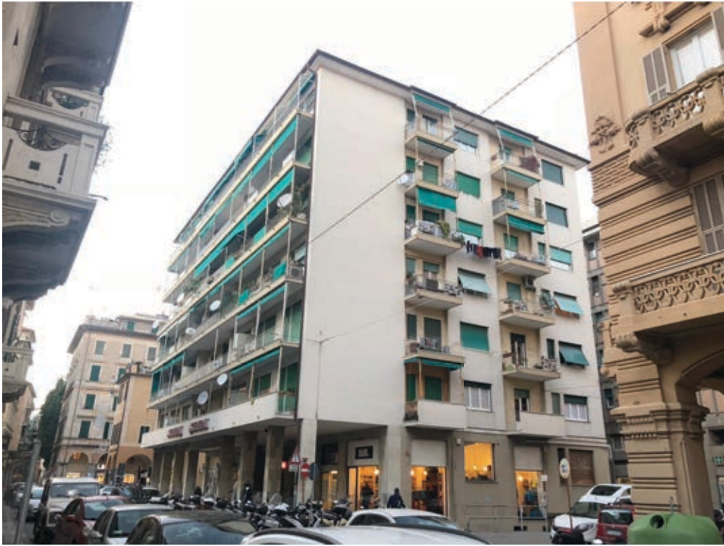
FOTOGRAFIA N° 1

COMMENTI: Vista esterna del Condominio di Via Nino Bixio 13.