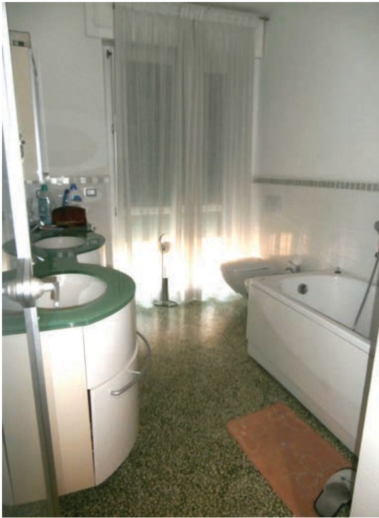
FOTOGRAFIA N° 15 COMMENTI: Vista del servizio igienico principale.