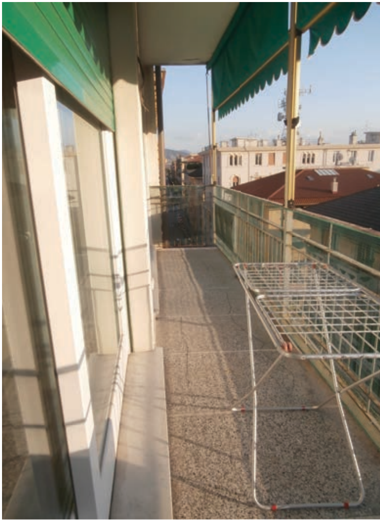
FOTOGRAFIA N° 11 COMMENTI: Vista del balcone della sala prospiciente Via Nino Bixio.