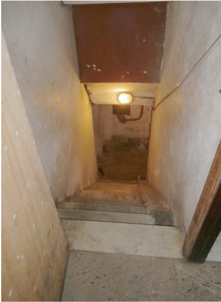
FOTOGRAFIA N° 19

COMMENTI: Vista della scala interna condominiale, che conduce al livello seminterrato delle cantine.