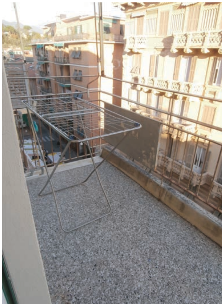
FOTOGRAFIA N° 18 COMMENTI: Vista del balcone esposto sul fronte secondario