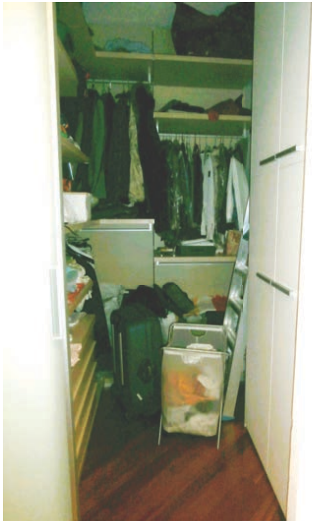
FOTOGRAFIA N° 17 COMMENTI: Vista della cabina armadi.