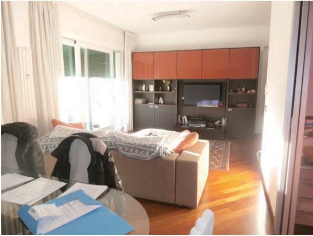
FOTOGRAFIA N° 9 COMMENTI: Vista del soggiorno.