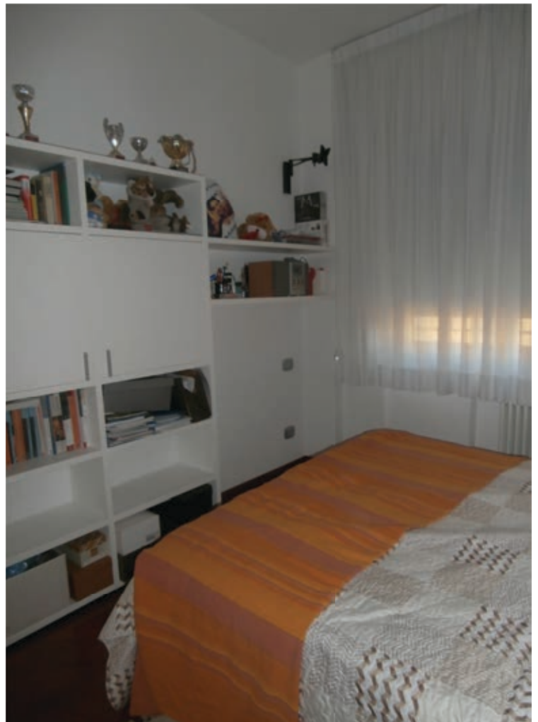
FOTOGRAFIA N° 14 COMMENTI: Vista della cameretta