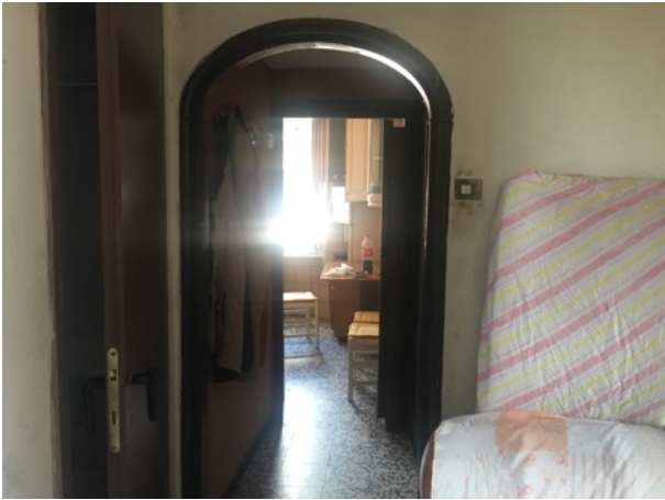
Disimpegno per accesso alla cucina