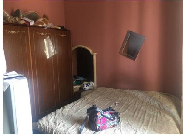
altra camera da letto