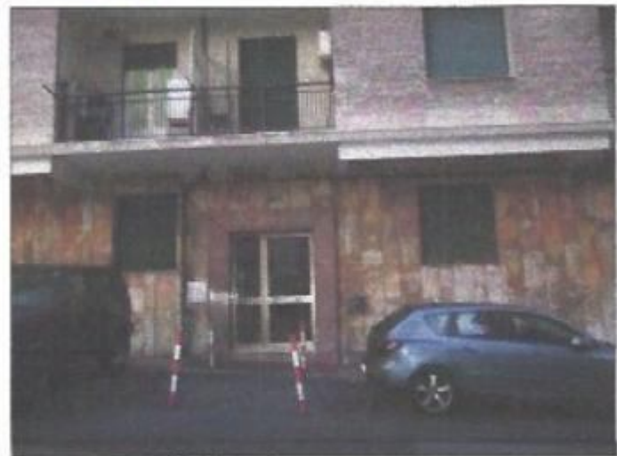
Ingresso Allegato "D" (n.ro 3 facciate)