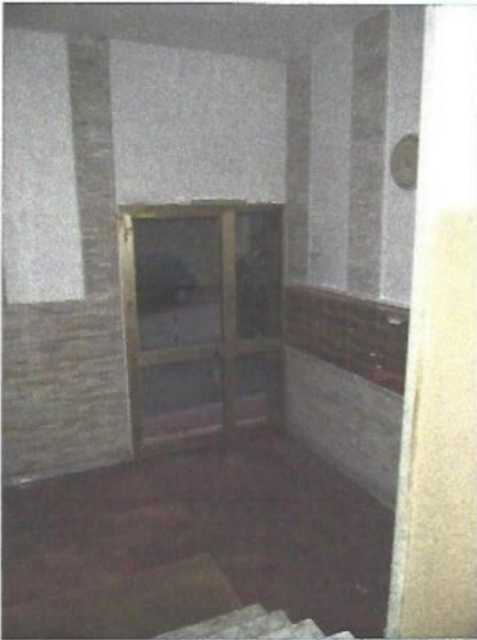
Atrio di ingresso