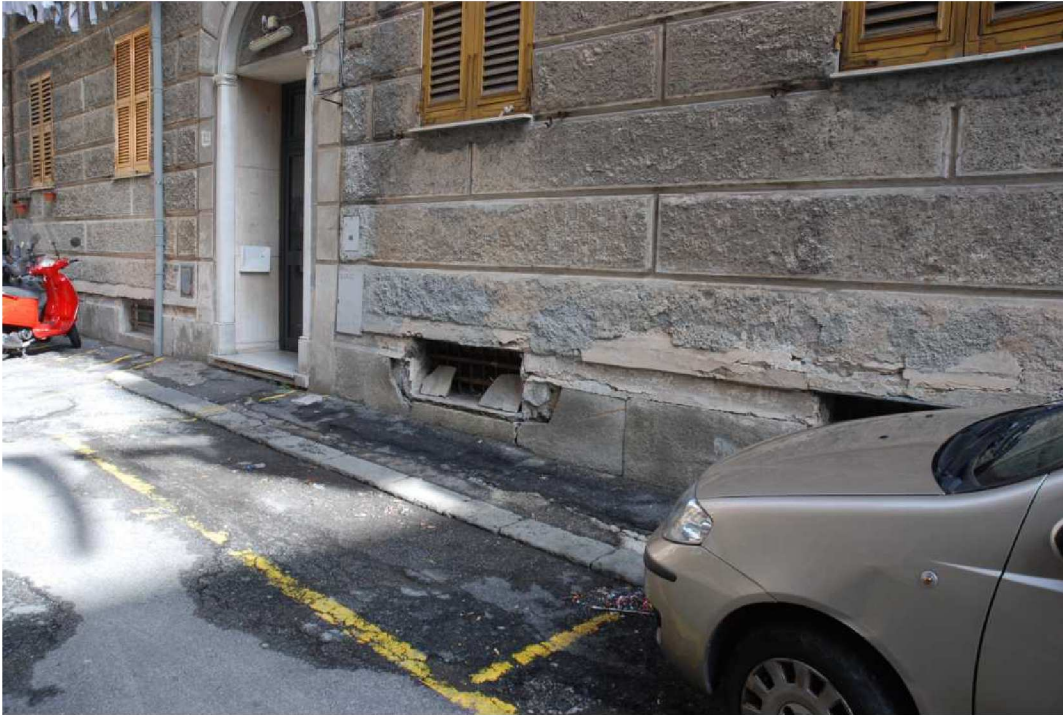
Foto n. 5- Piazzale antistante portone di accesso civico 12