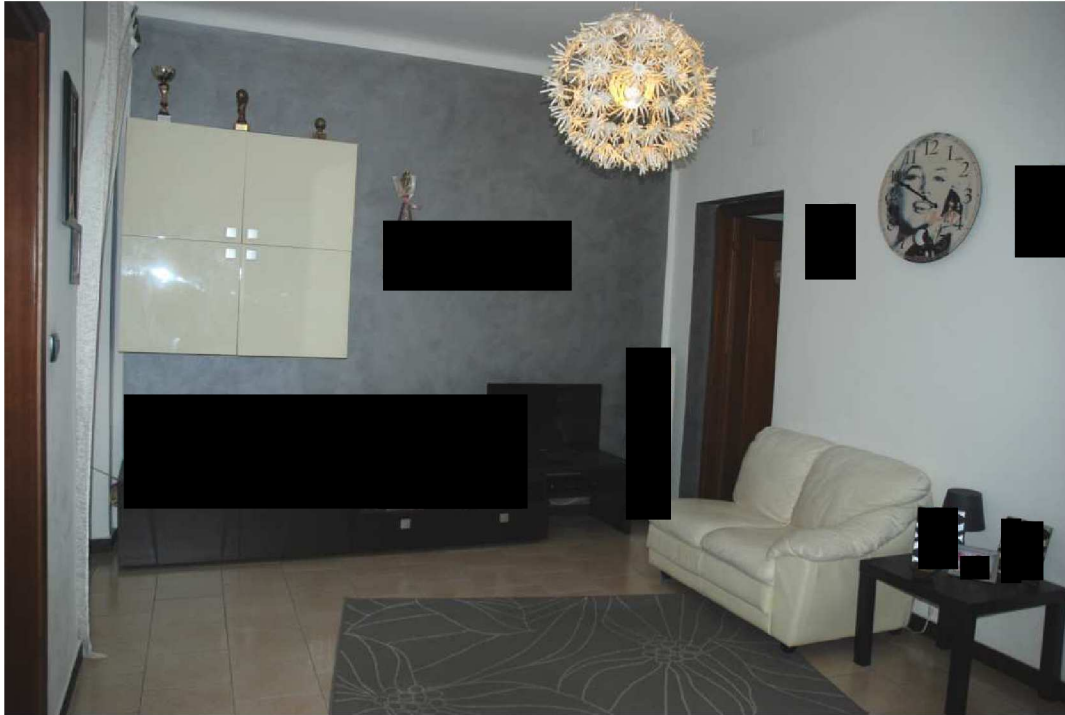
Foto n. 14- Vano centrale da cui si accede alle camere da un lato e dall'altro alla cucina , ecc..