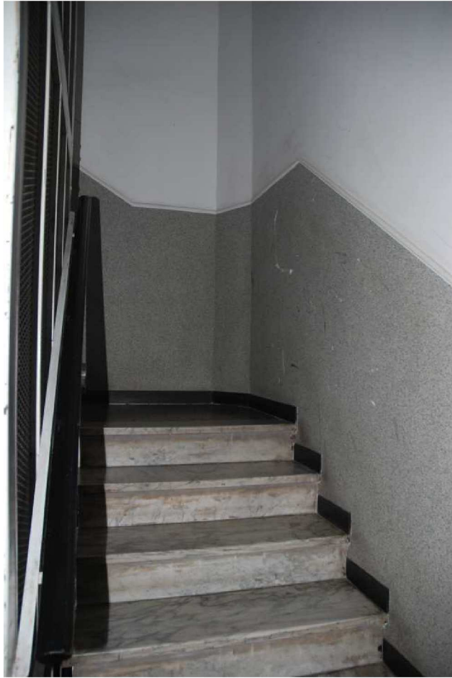
Foto n. 9- Vano scala