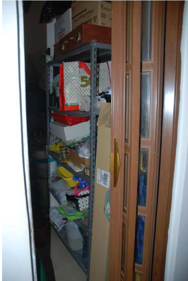
Foto n. 12- Piccolo ripostiglio