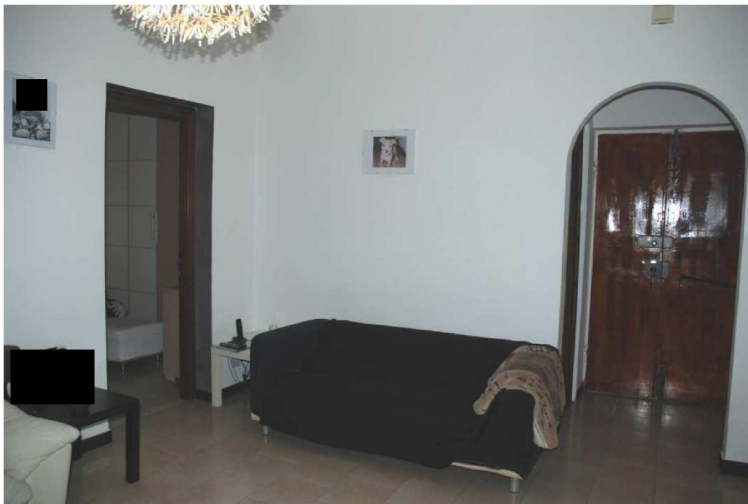
Foto n. 13- Vano centrale da cui si accede alle camere da un lato e dall'altro alla cucina , ecc..