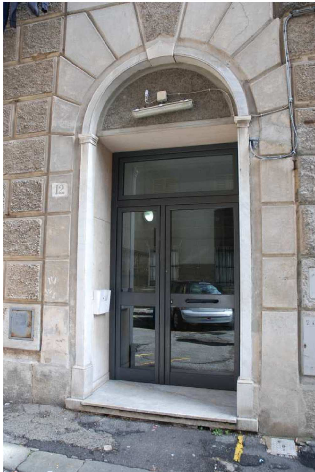
Foto n. 6- Portone accesso civico 12 .