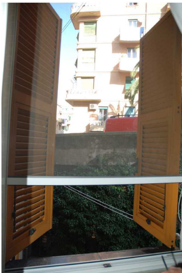
Foto n. 25- Finestra camera 3