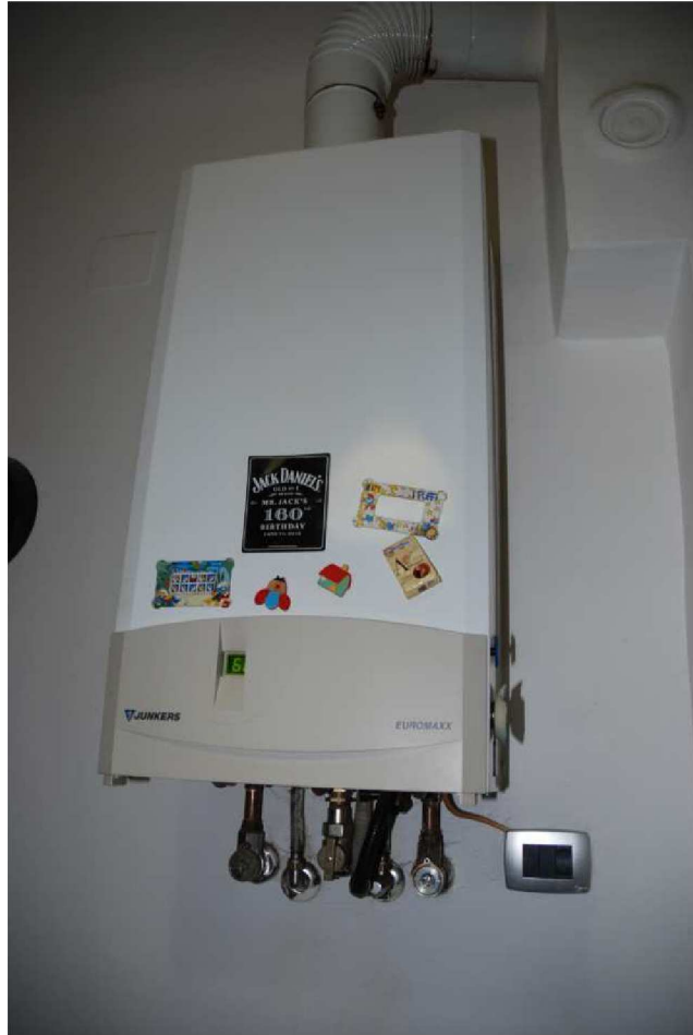
Foto n. 20- Caldaia