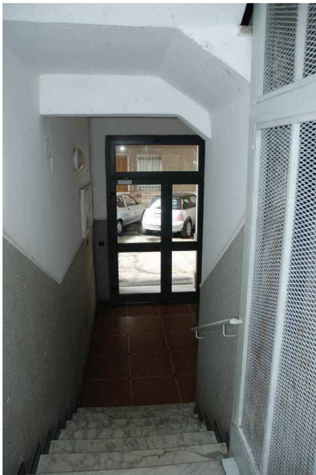
Foto n. 7- Atrio e vano scala