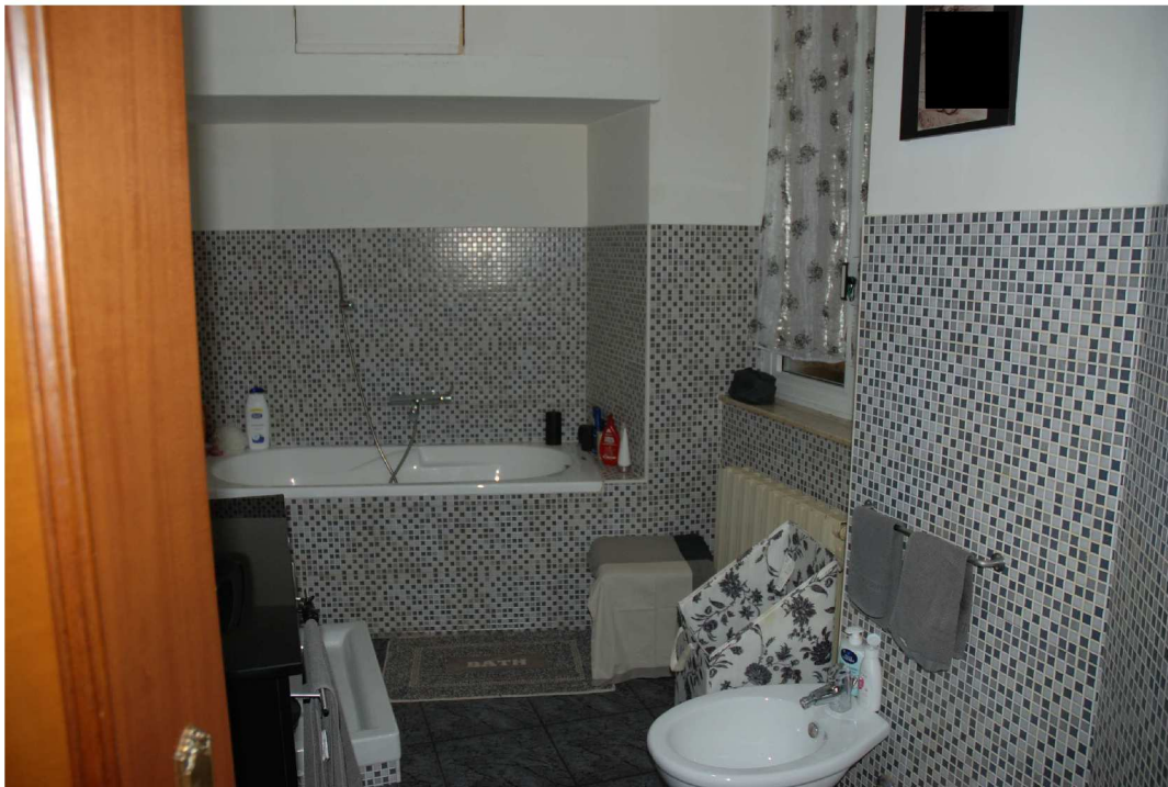
Foto n. 21- Bagno