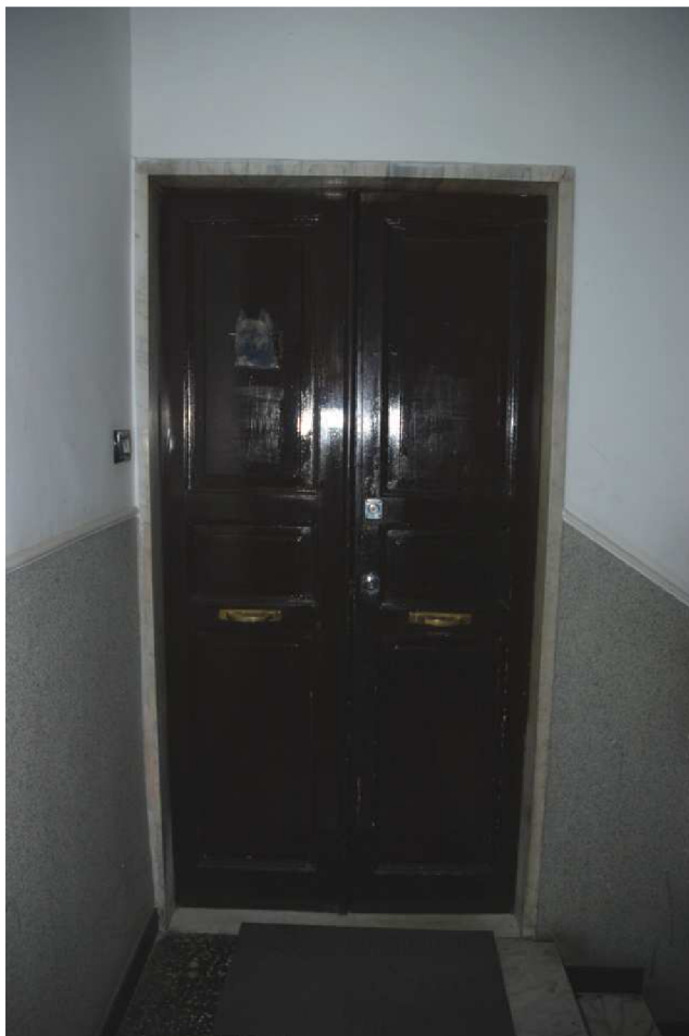
Foto n.10- Porta accesso interno n. 5