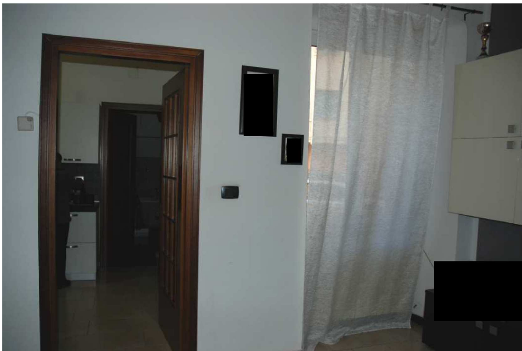
Foto n. 17- Vano centrale ripreso lato cucina