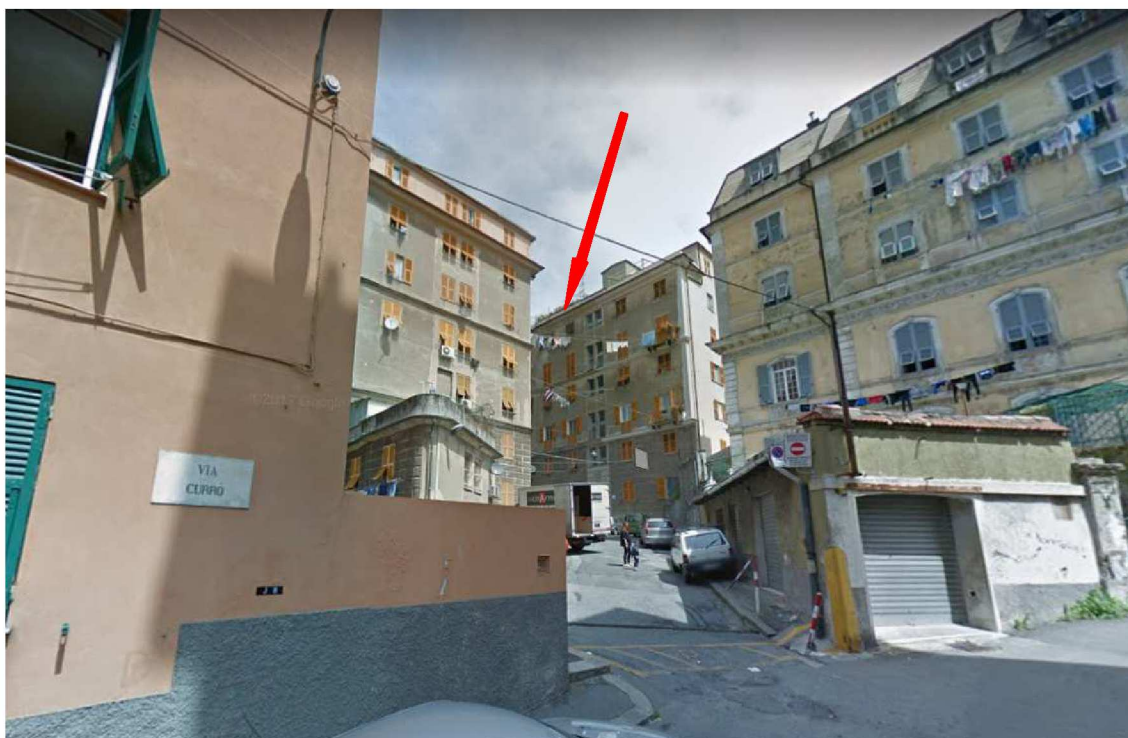
Foto n. 2- Tratto di via Currò che conduce al civico 12 evidenziato dalla freccia .