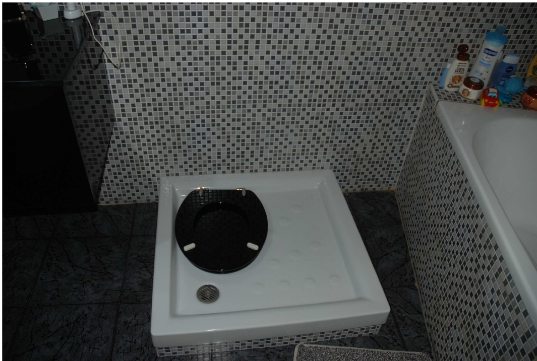
Foto n. 23- Bagno