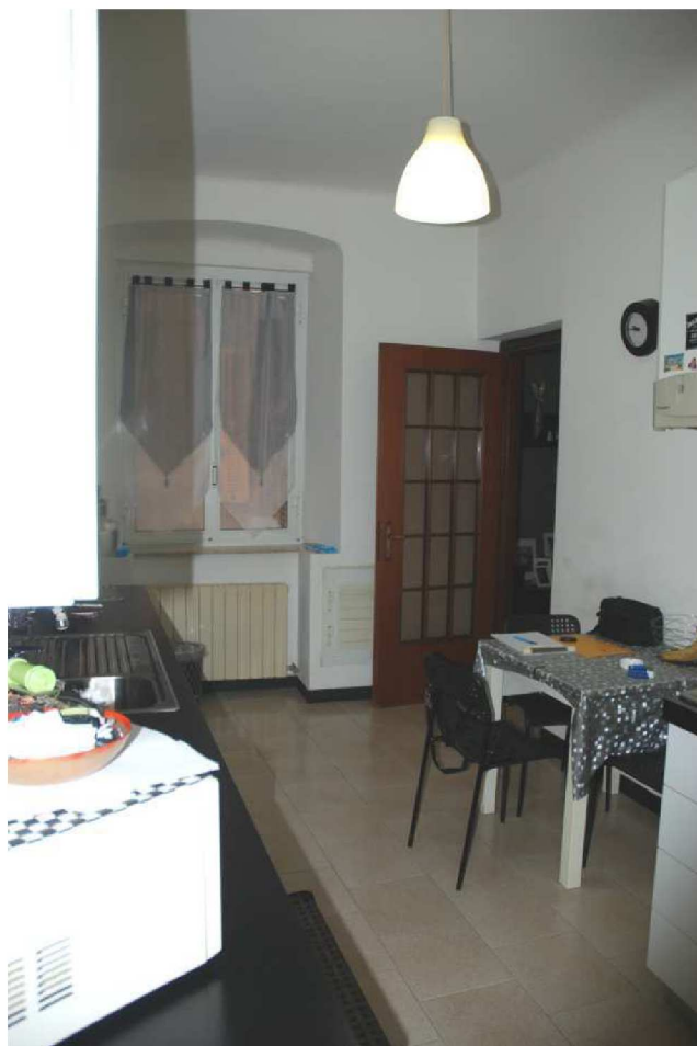
Foto n. 18- Cucina