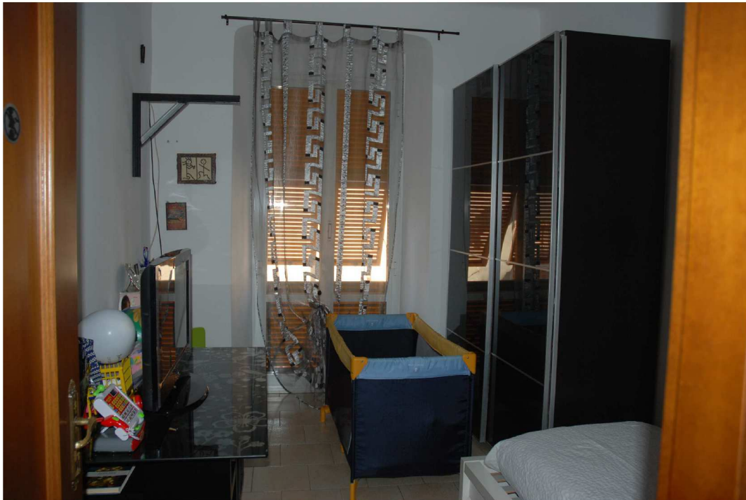
Foto n. 16- Camera 2