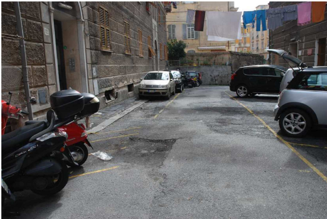
Foto n. 4- Piazzale antistante portone di accesso civico 12