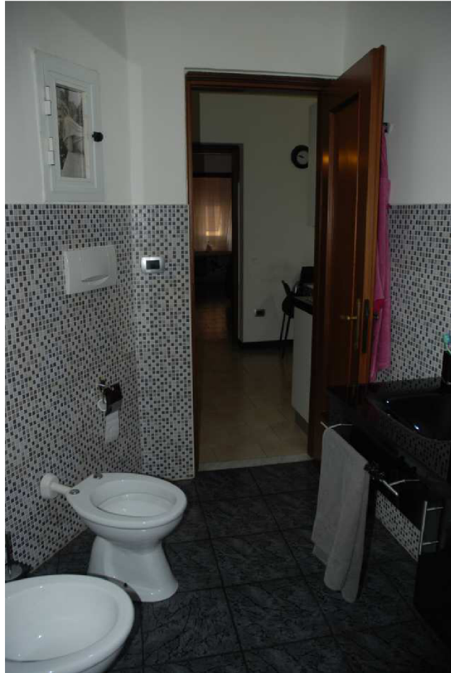
Foto n. 22- Bagno