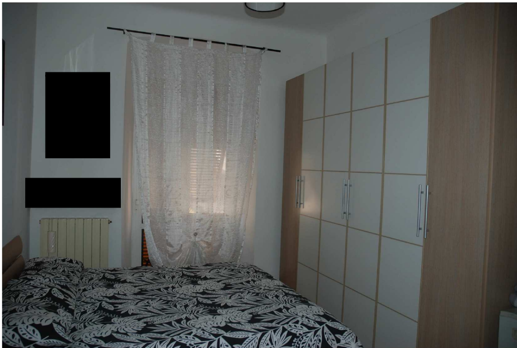
Foto n. 15- Camera 1