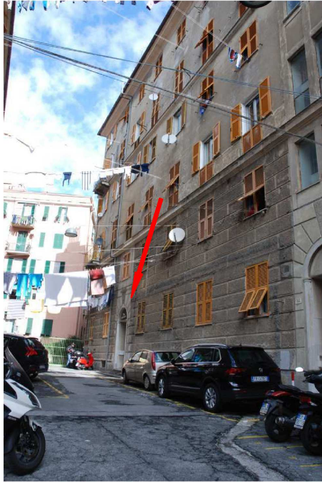
Foto n. 3- Via Currò civico n. 12 evidenziato dalla freccia