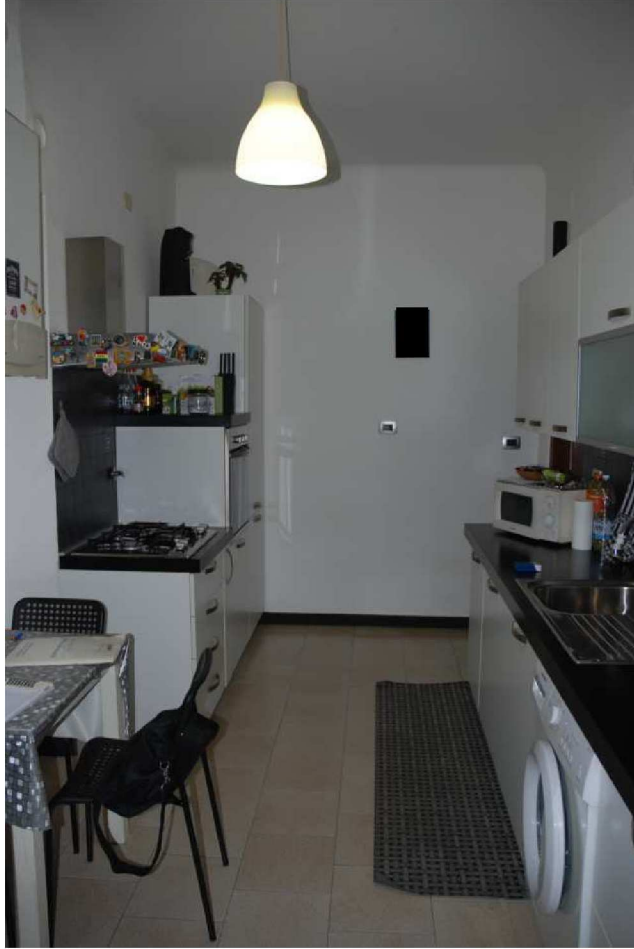
Foto n. 19- Cucina