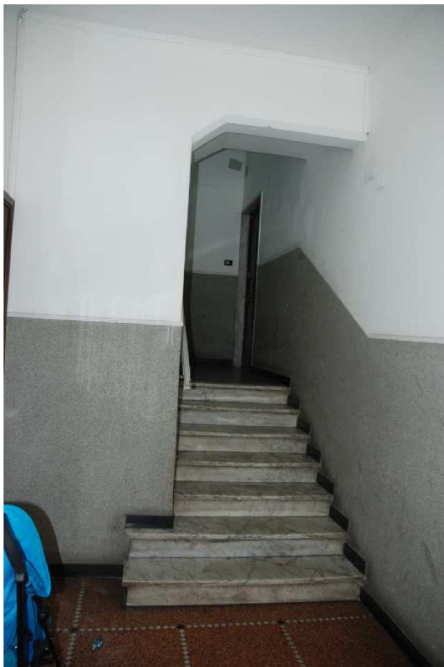
Foto n. 8- Atrio e vano scala