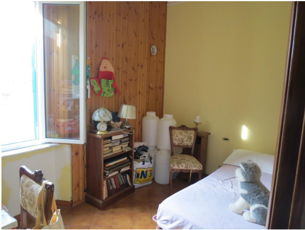
FOTO n. 15 : la camera posta tra il ripostiglio e la camera a Nord