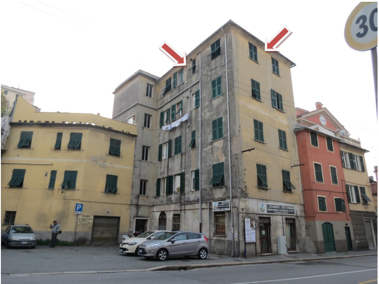
FOTO n. 3 – 4 : il civico 67 ; sono visibili le finestre dell'interno 10