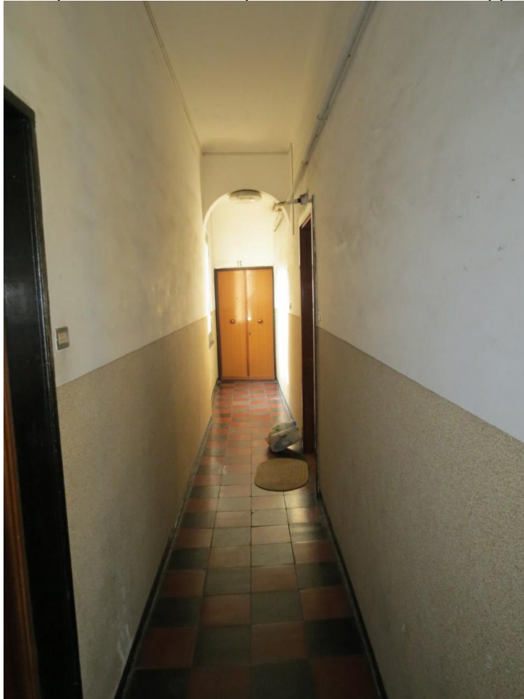
FOTO n. 8 : il pianerottolo al terzo piano che dà accesso all'appartamento