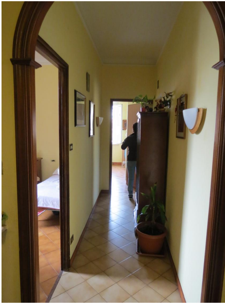
FOTO n. 21 – 22 : due immagini del corridoio che distribuisce i vari ambienti