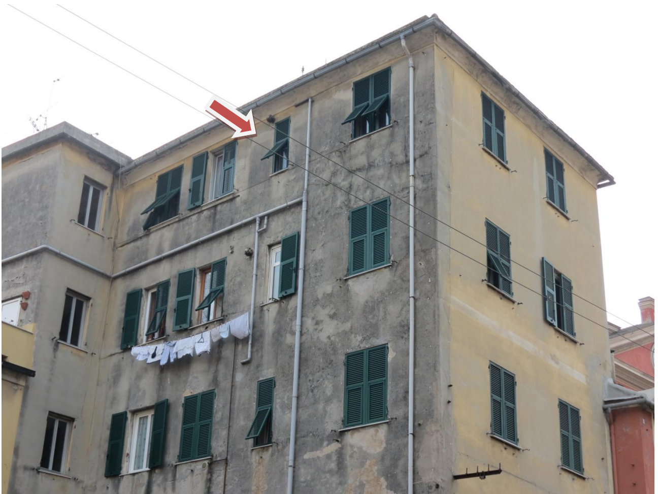
FOTO n. 5 : particolare dell'esterno dell'appartamento FOTO n. 6 : il portone di accesso al civico 67