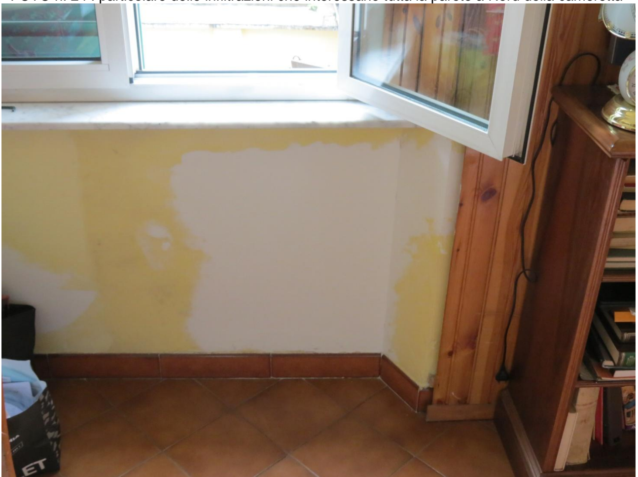
FOTO n. 24 : particolare delle infiltrazioni che interessano tutta la parete a Nord della cameretta