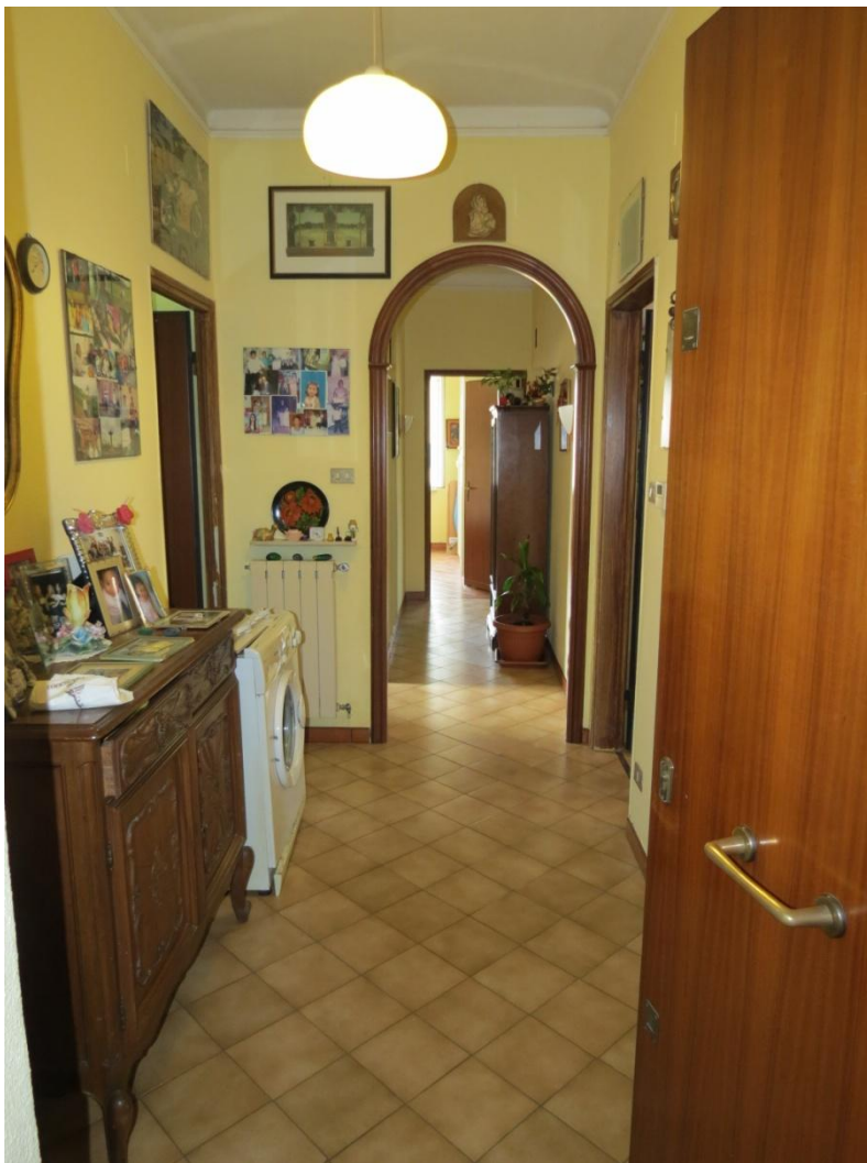
FOTO n. 9 : l'ingresso dell'appartamento FOTO n. 10 : il ripostiglio che prende accesso dall'ingresso