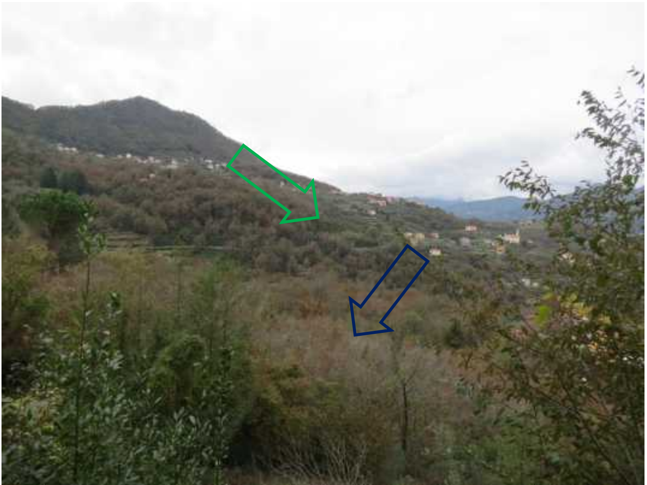
FOTO n. 1 vista da località Bocco di Leivi della zona dove sono ubicati i mappali dei lotti 1 e 2