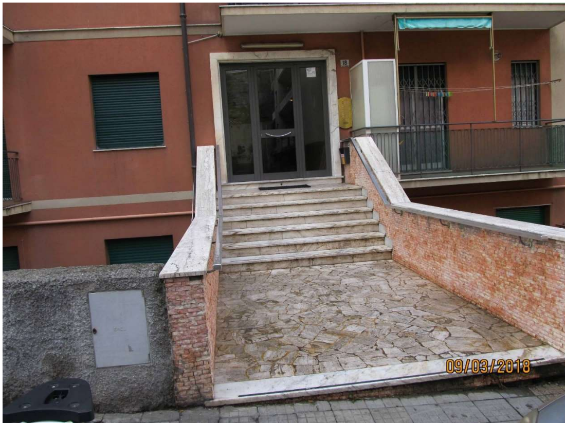
fot. 2 – passerella d'accesso