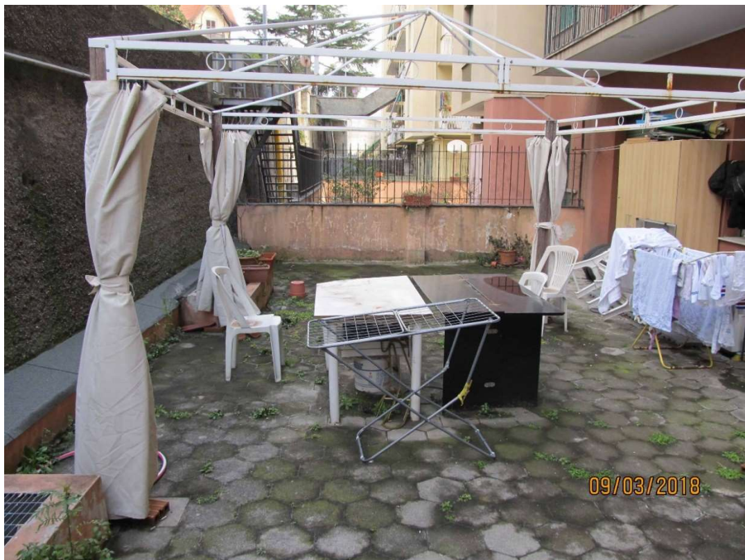
fot, 6 - terrazzo