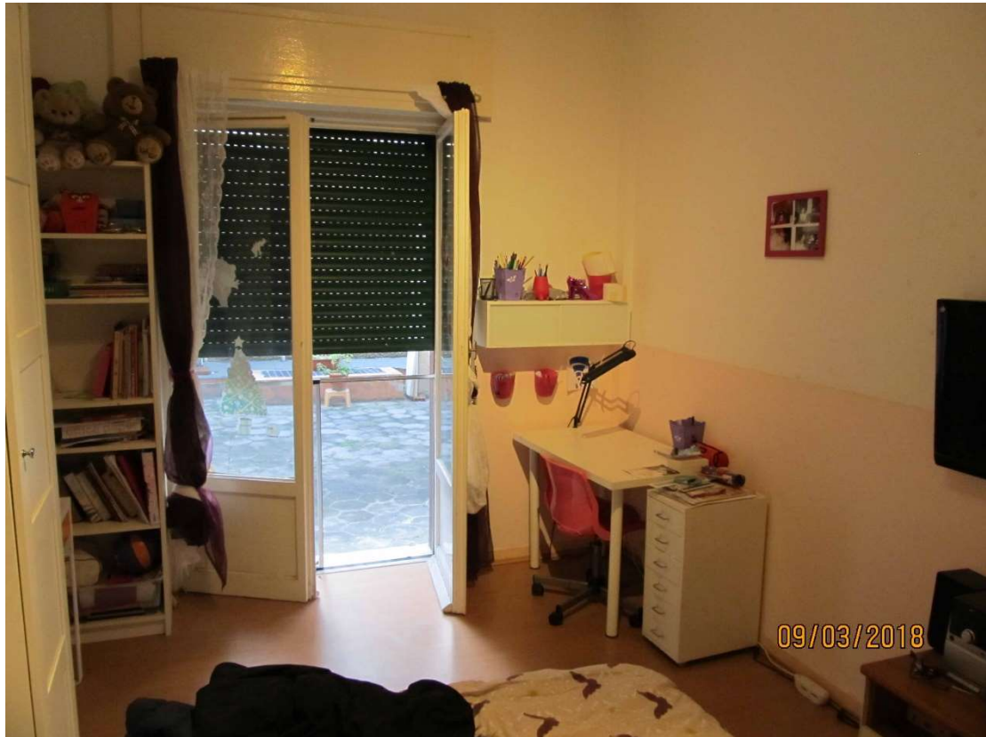
fot. 3 - cameretta