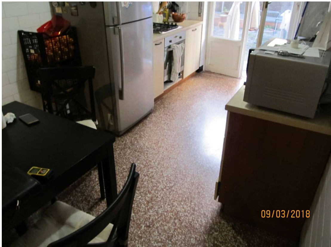
fot. 4 - cucina