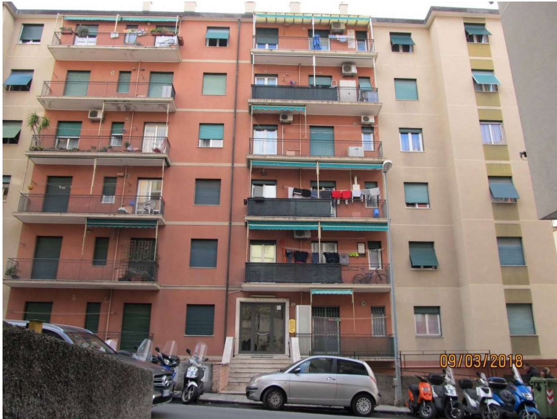
fot. 1 – fronte su via Donaver