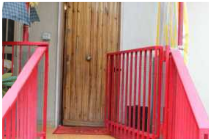
Foto 5: Ingresso all'appartamento