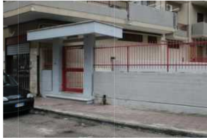
Foto 2: Ingresso da portoncino condominiale di Via P. Stellacci civico 9