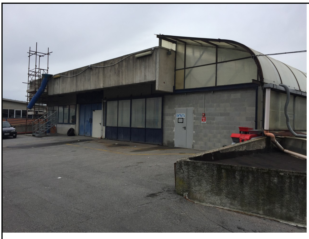
Foto 16 – il piazzale carrabile di accesso al lotto 3° (dalla via Canalbolzone)