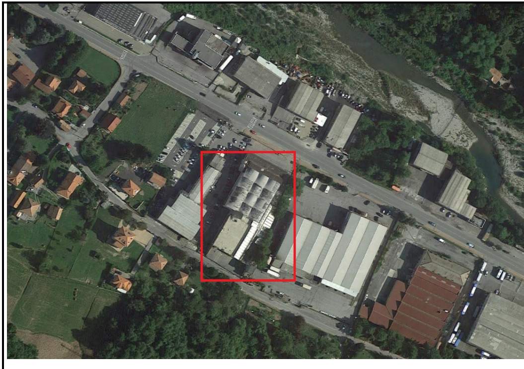
Foto 1 - Visuale Aerea