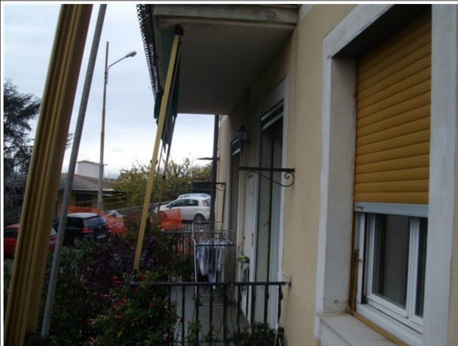
Dettaglio poggioli su distacco condominiale