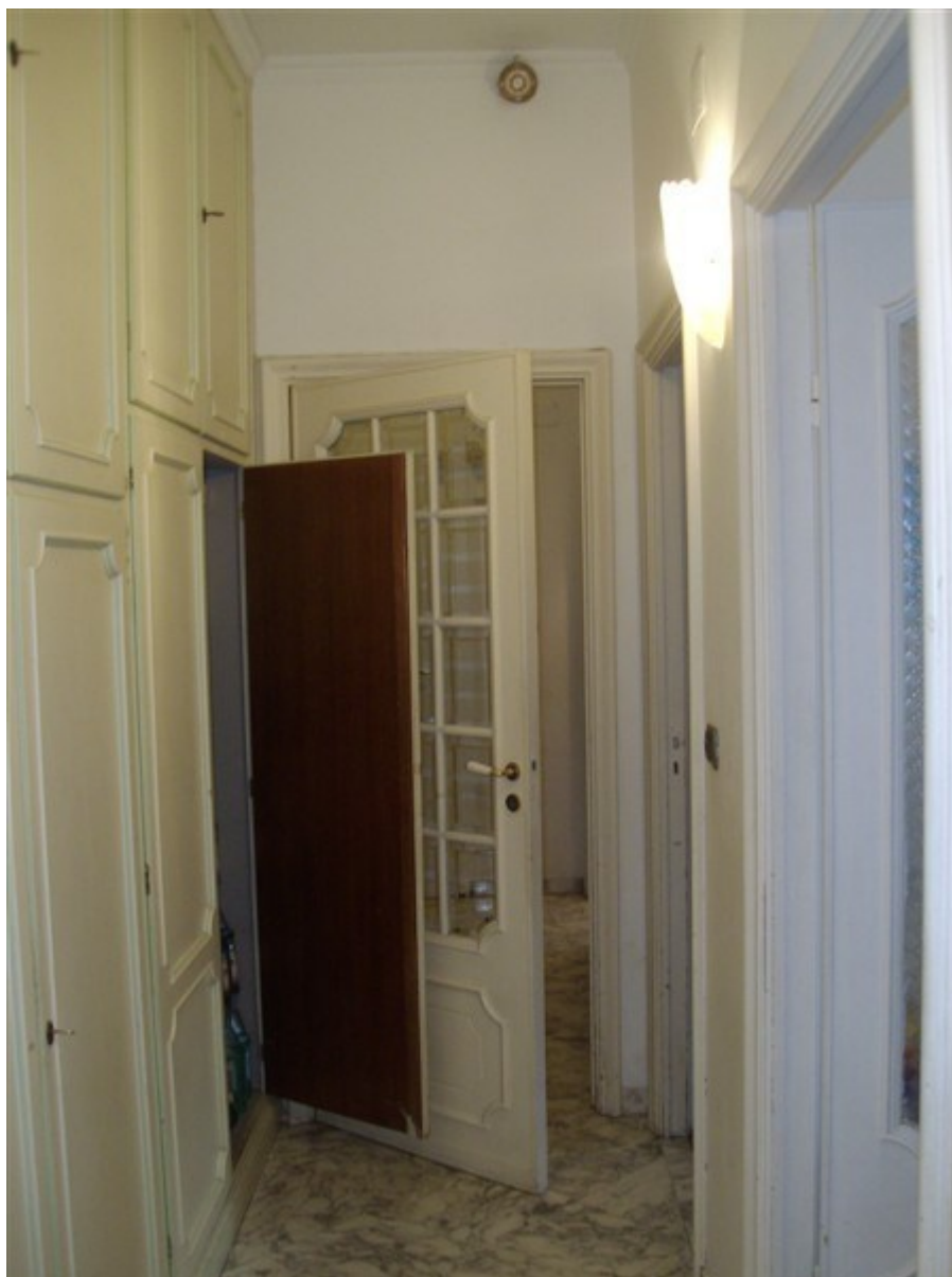
Vista corridoio verso ingresso