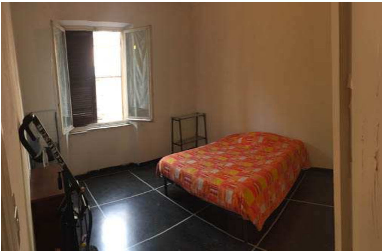
11 – CAMERA SUD