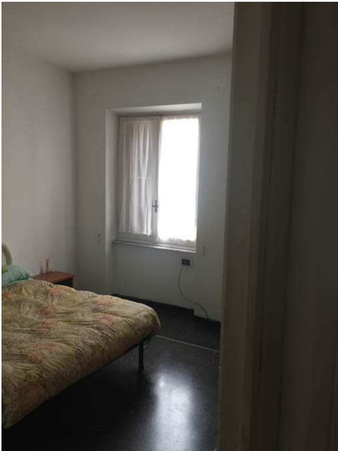
10 – CAMERA NORD