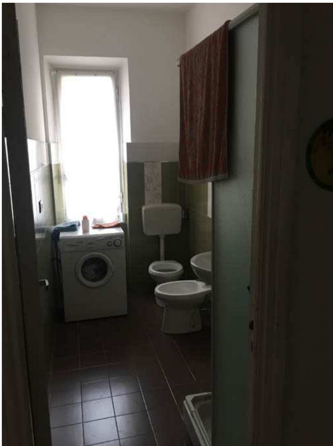
9 – BAGNO