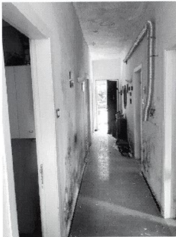
Foto 16 - Vista corridoio - ingresso