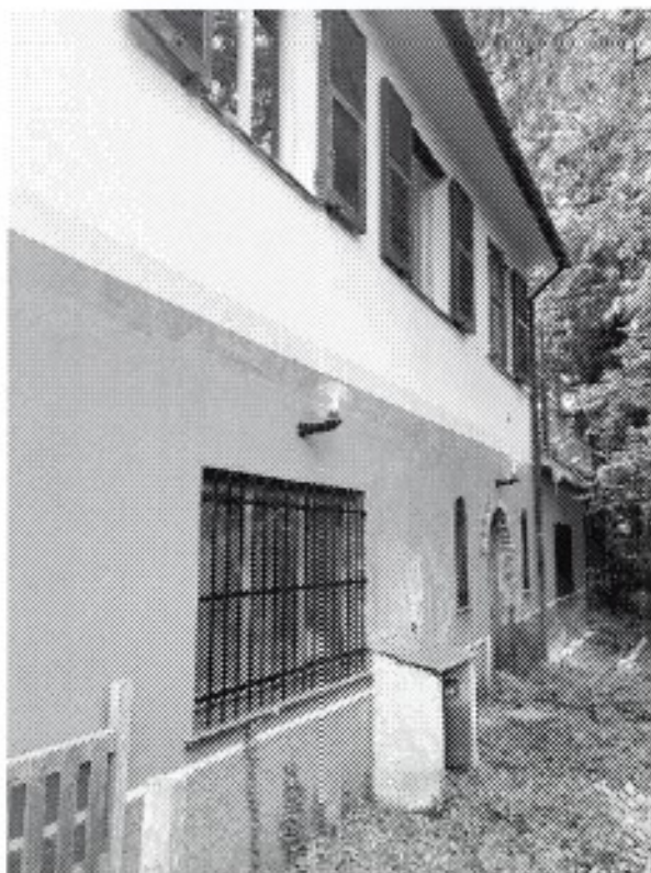
Foto 10 - Facciata ovest