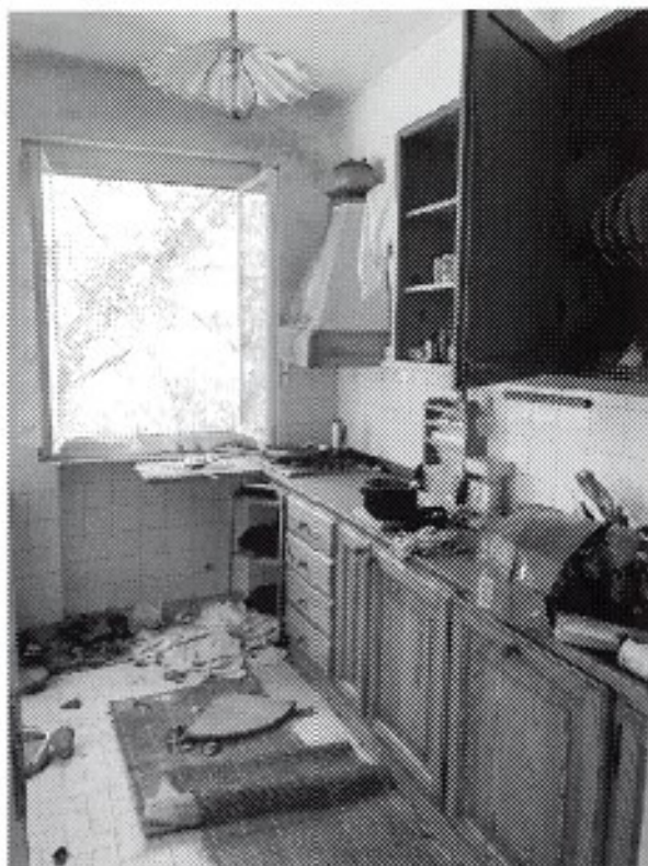
Foto 19 - Vista angolo cottura