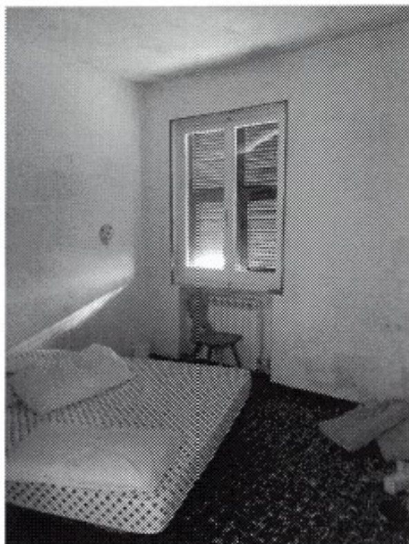
Foto 23 - Camera 2