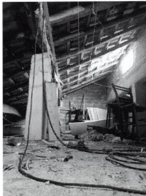
Foto 26 - Soffitta