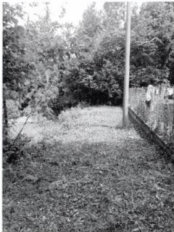
Foto 04 - Cortile lato est