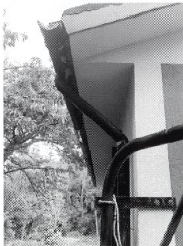
Foto 12 - Particolare facciata sud con canale di gronda e pluviale