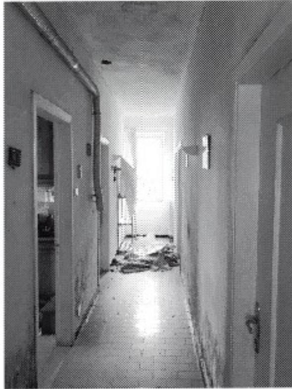
Foto 17 - Vista dall'ingresso - corridoio