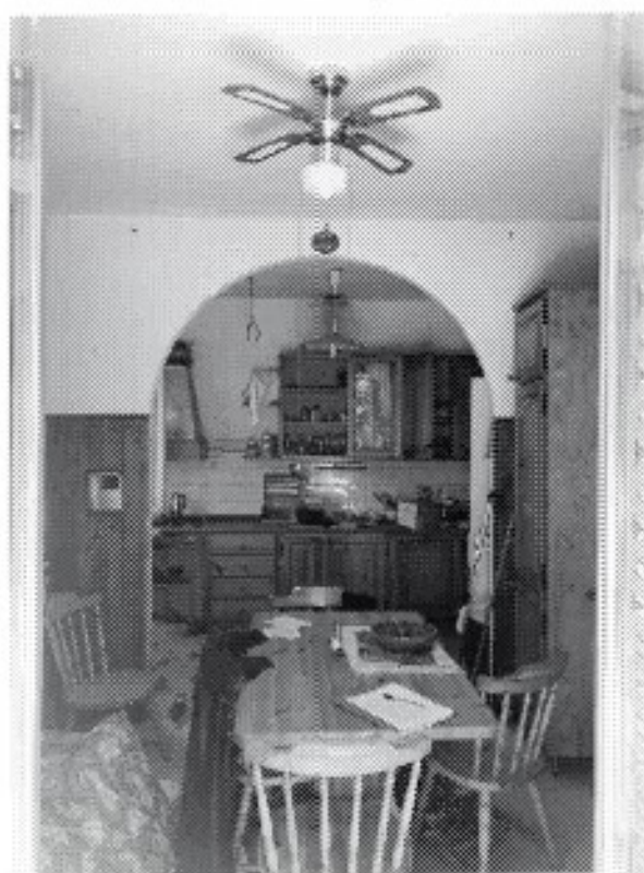
Foto 20 - Vista zona giorno e angolo cottura