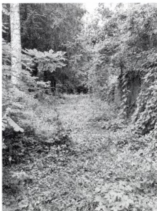
Foto 02 - Accesso al fabbricato dal cancello carrabile