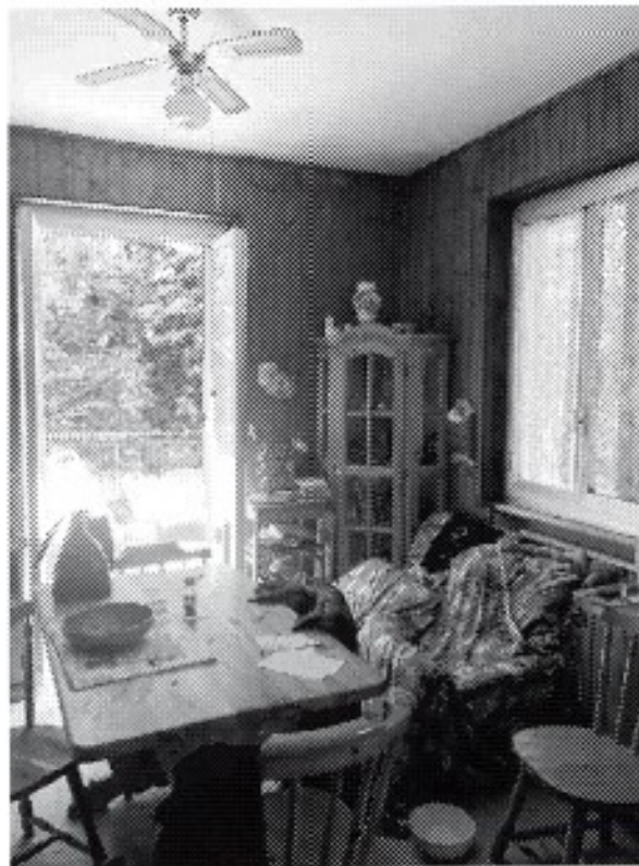
Foto 18 - Vista zona giorno e terrazza esterna