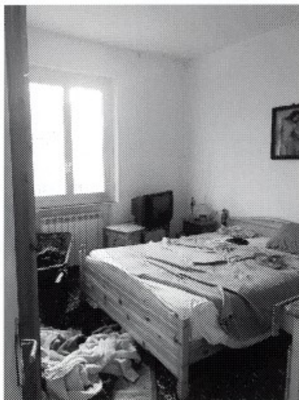
Foto 22 - Camera 1