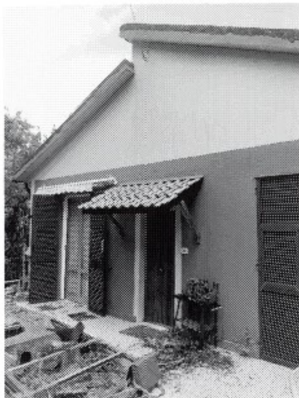
Foto 11 - Facciata sud