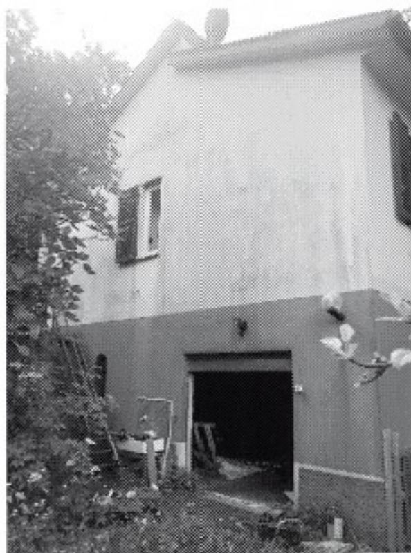
Foto 08 - Facciata nord