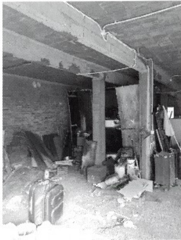
Foto 13 - Vista interna del box