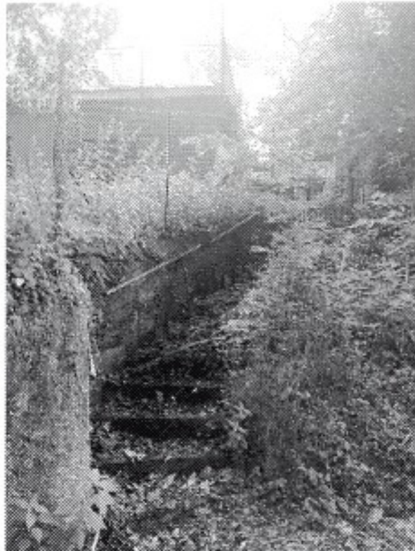
Foto 03 - Accesso al fabbricato dal cancello pedonale