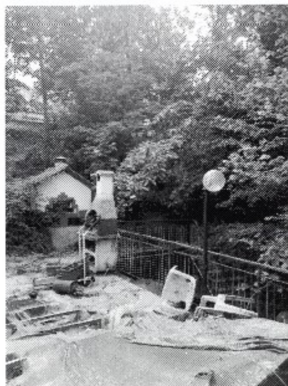
Foto 06 - La terrazza