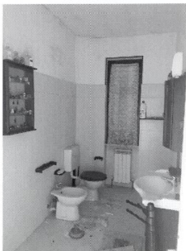
Foto 24 - Bagno I