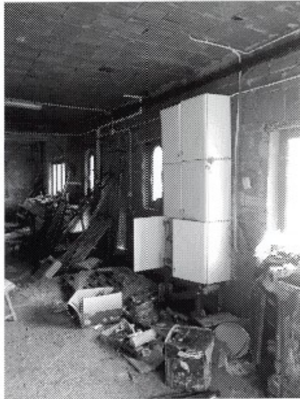
Foto 15 - Vista interna del box