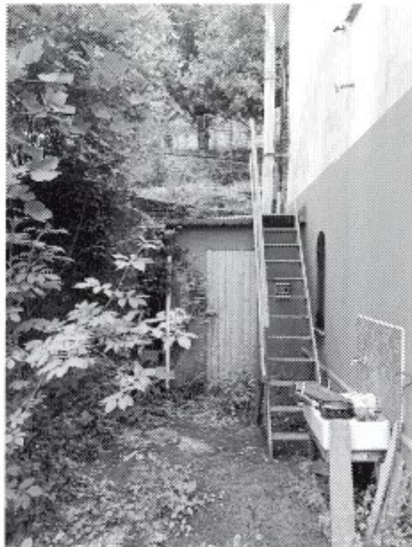
Foto 09 - Facciata nord e locale tecnico