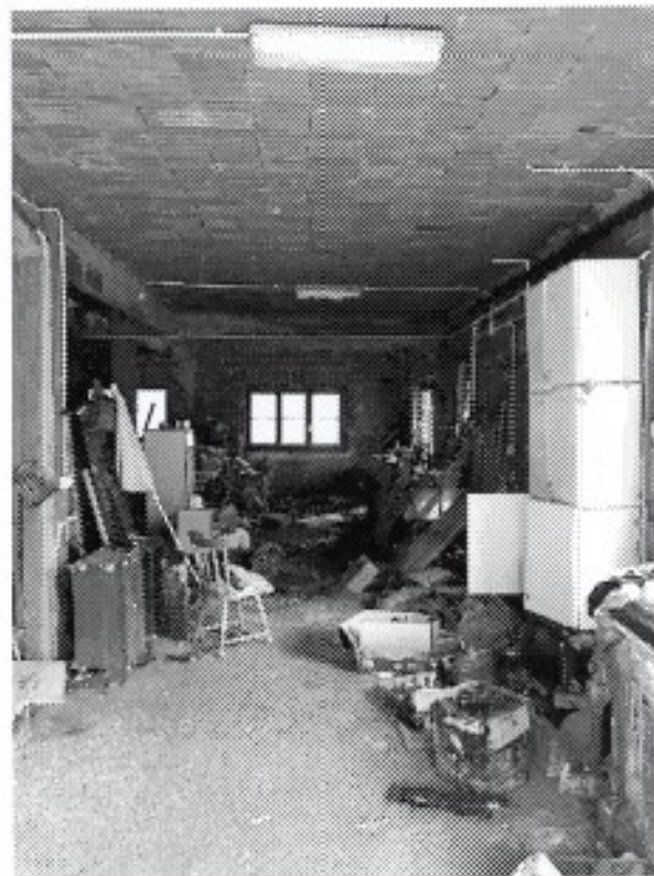
Foto 14 - Vista interna del box