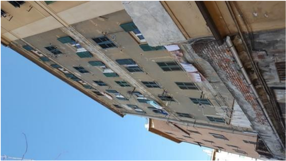
Fotografia F.3 - Fronte su Via Orgiero