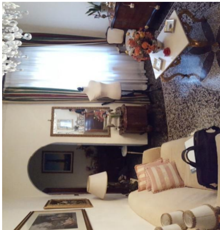
Fotografia F.4 - Soggiorno-Ingresso