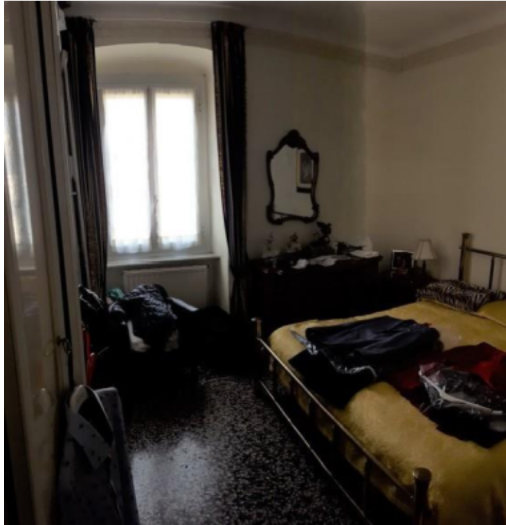
Fotografia F.7 - Camera doppia