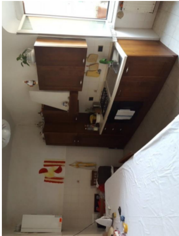
Fotografia F.5 - Cucina