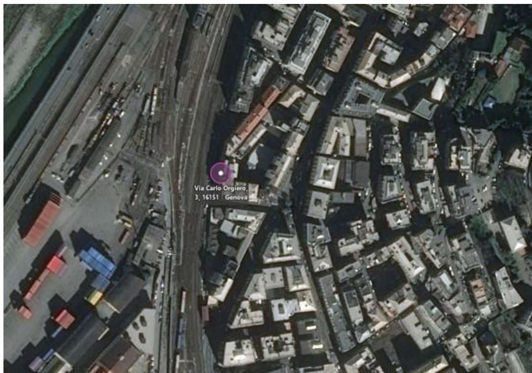
Fotografia F.1 - Vista aerea generale