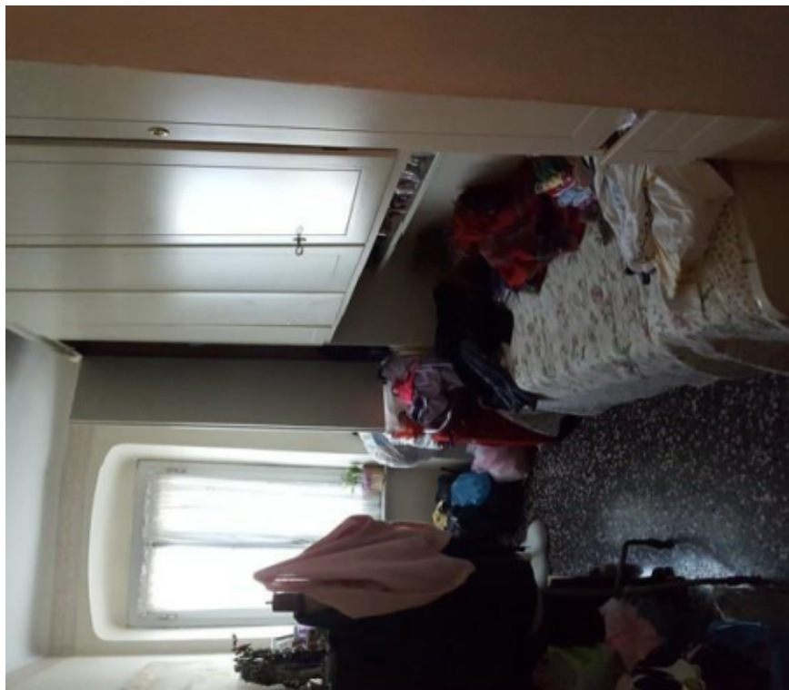
Fotografia F.8 - Camera singola