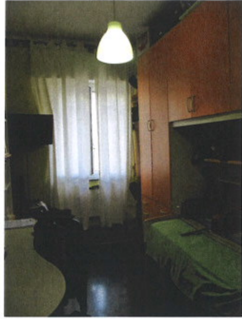
FOTO 2 - camera 1