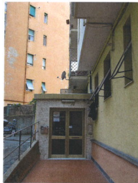
FOTO 2 dettaglio portone di accesso