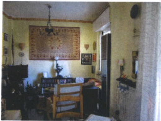
FOTO 5 -soggiorno