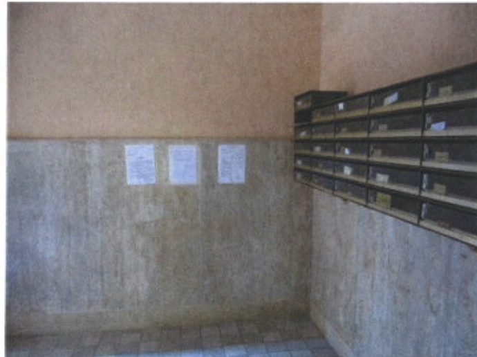
FOTO 3 - ingresso