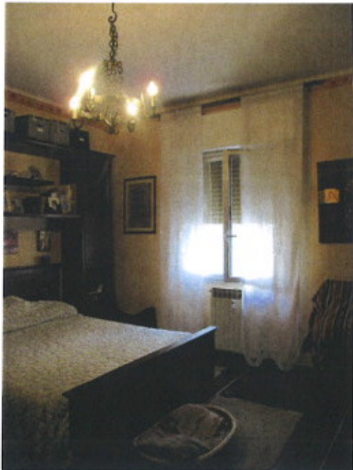
FOTO 3 - camera 2