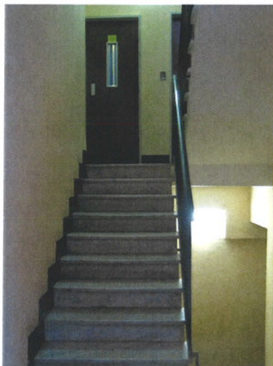
FOTO 4 - vano scale