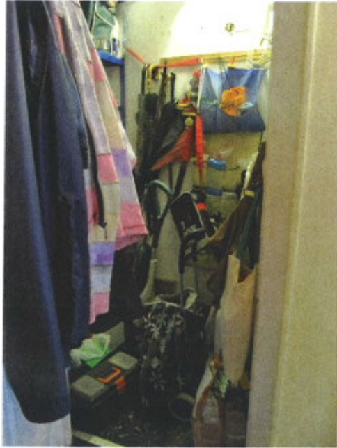
FOTO 9 -ripostiglio