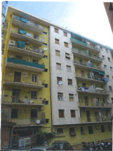
FOTO 1 scorcio prospetto su via dei Platani