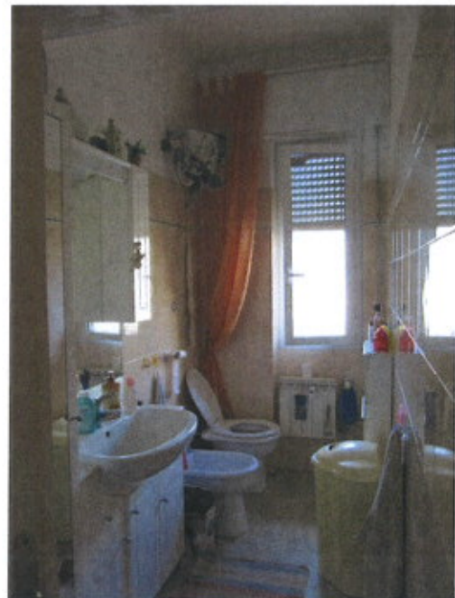
FOTO 4 - bagno