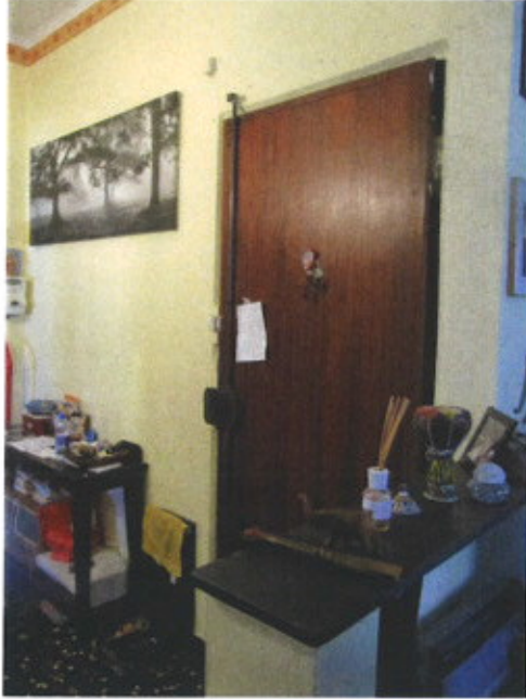
FOTO 1 - ingresso