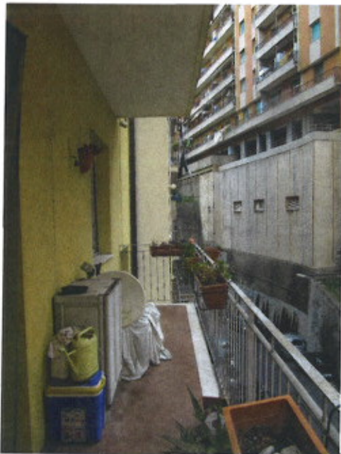
FOTO 7 - terrazzo lato soggiorno