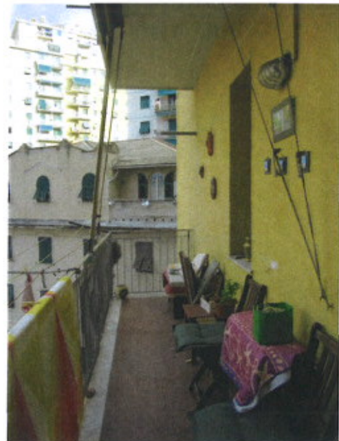
FOTO 8 - terrazzo lato angolo cottura