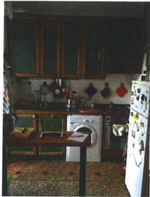
FOTO 6 - angolo cottura