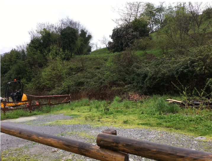
Altra vista dell'area