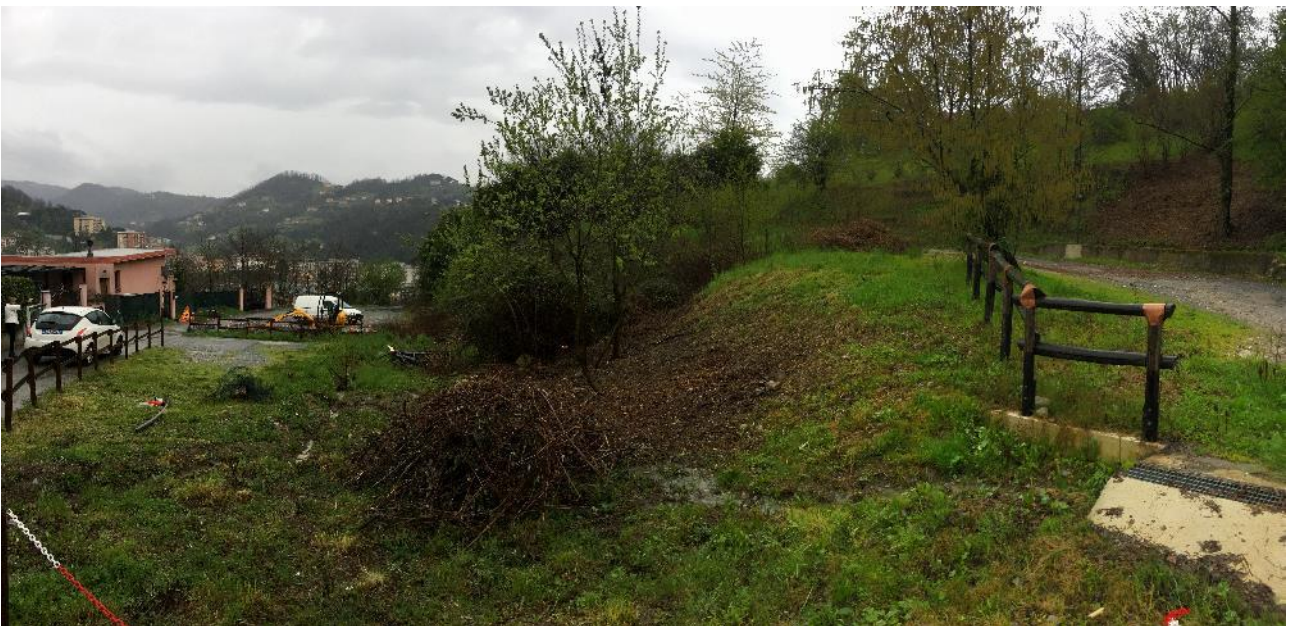
Vista di Insieme dell'area