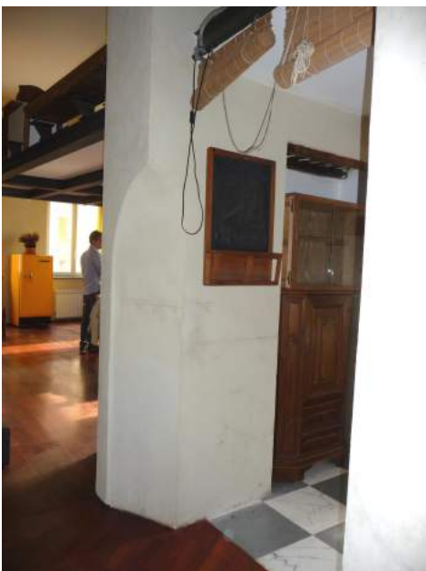
Foto 25. Verso il soggiorno