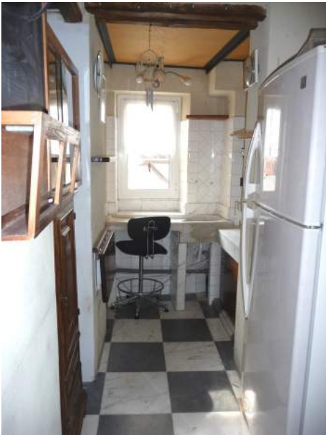
Foto 23. Zona lavello in marmo