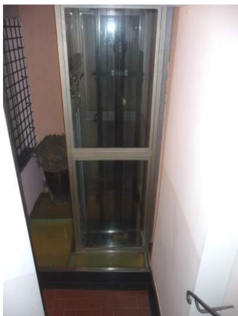
Foto 13. Ascensore