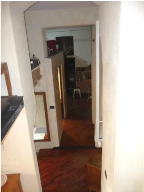
Foto 19. Dal soppalco