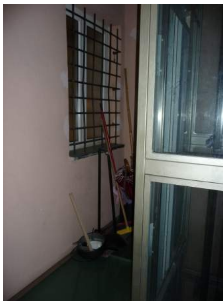
Foto 14. Ascensore e pianerottolo