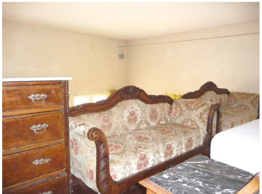
Foto 26. Soppalco