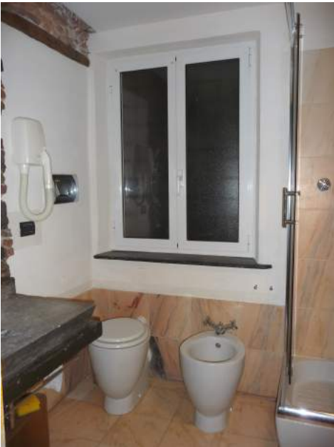
Foto 23. Bagno