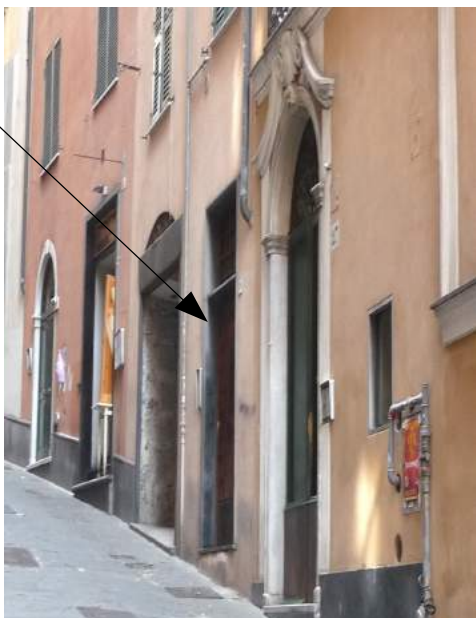
Foto 7. Portone civ.29