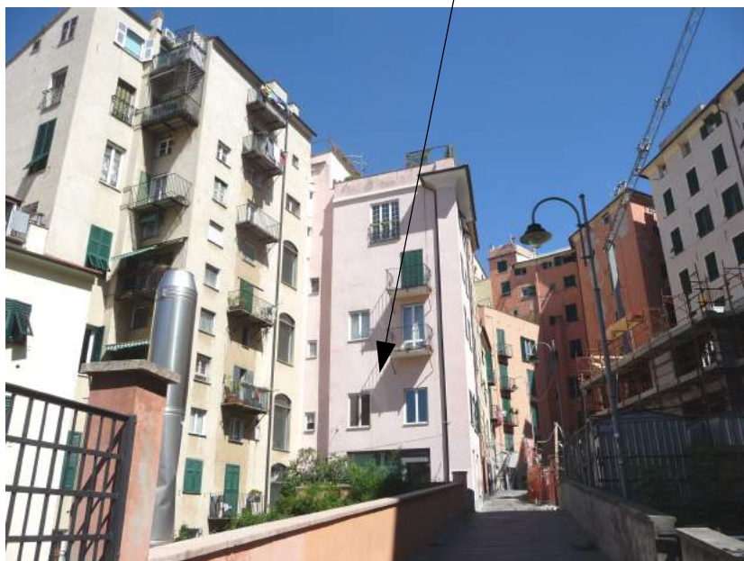
Foto 6. Vico del Fico