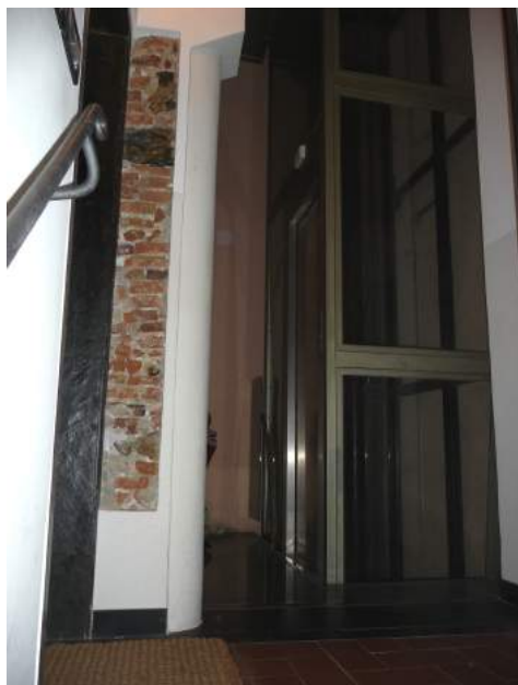
Foto 15. Ascensore e pianerottolo