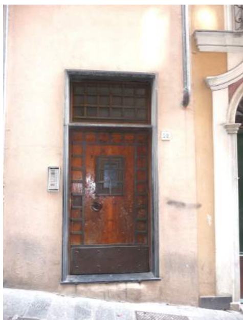
Foto 9. Portone civ. 29