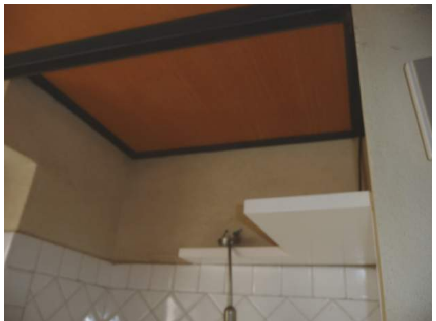
Foto 28. Zona lavello in marmo