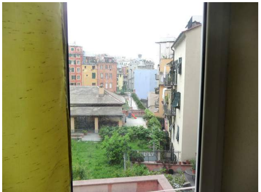
Foto 28. Vista a ovest