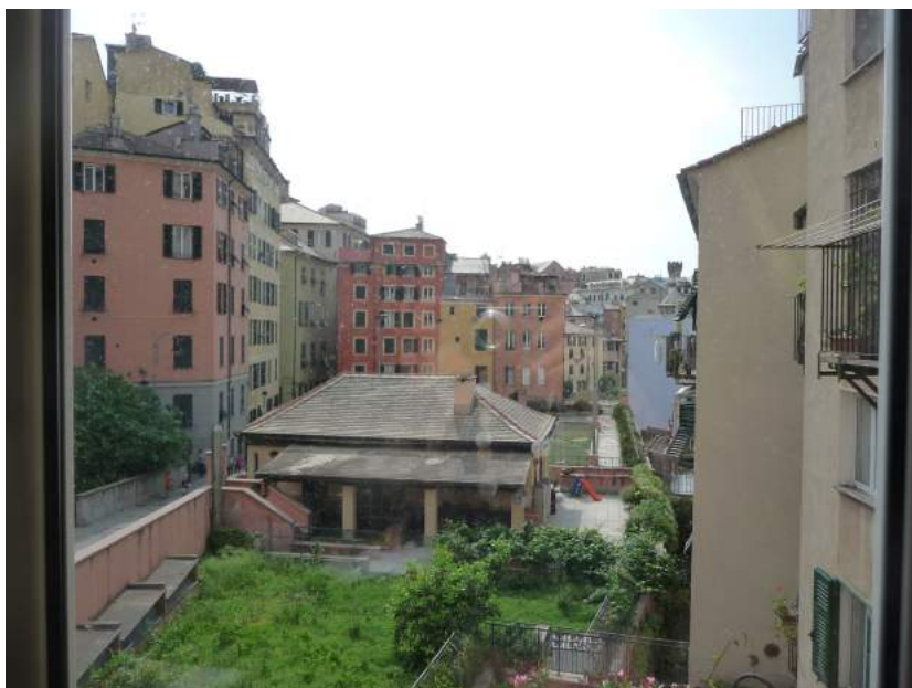
Foto 10. Spazio aperto dalle finestre ad ovest