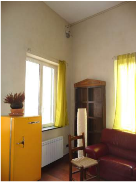
Foto 17. Soggiorno