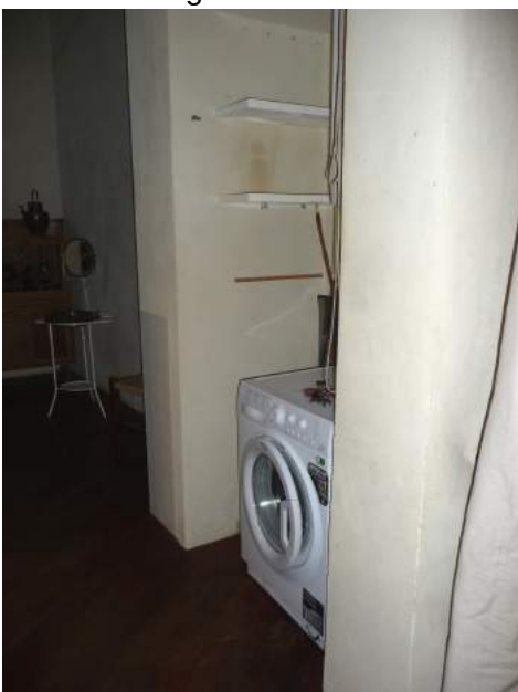
Foto 27. Fra ingresso e soggiorno