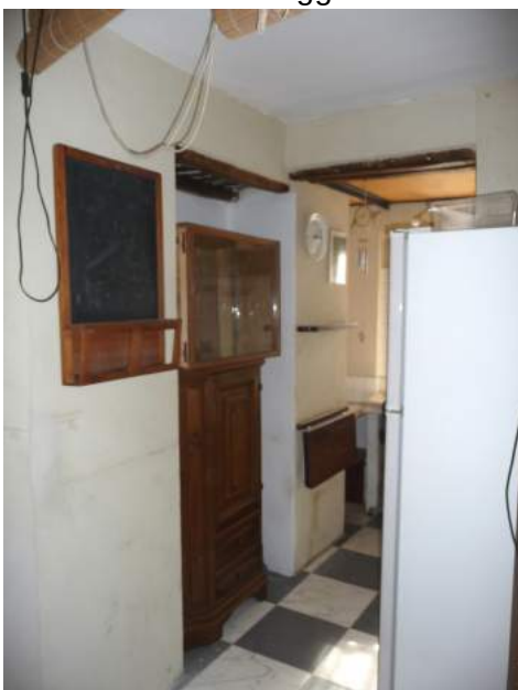
Foto 27. Zona lavello in marmo