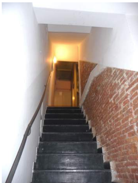
Foto 11. Vano scala