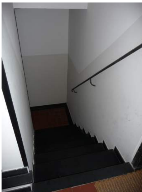
Foto 16. Vano scala