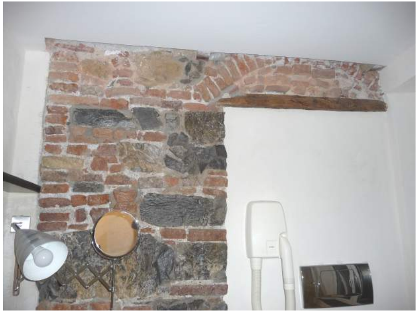
Foto 24. Bagno