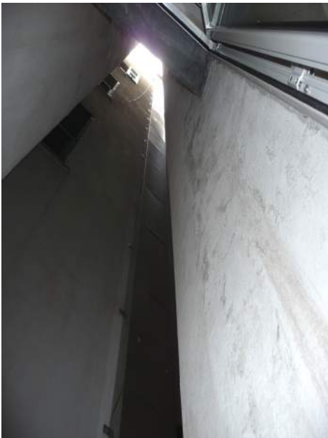
Foto 25. Cavedio ad est