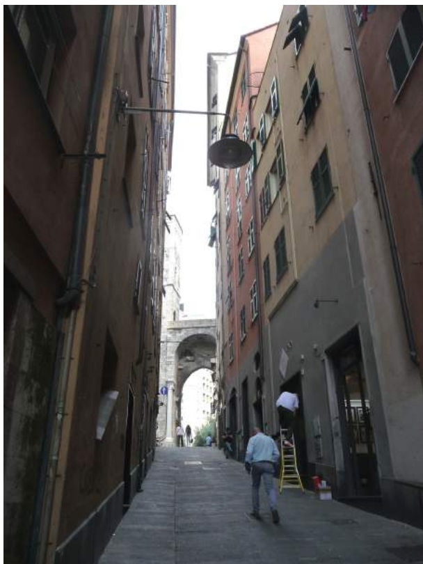
Foto 1. Salita del Prione verso porta Soprana