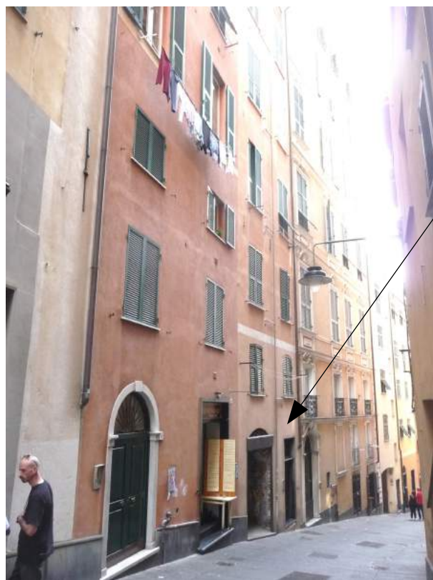
Foto 2. Salita del Prione verso piazza delle Erbe