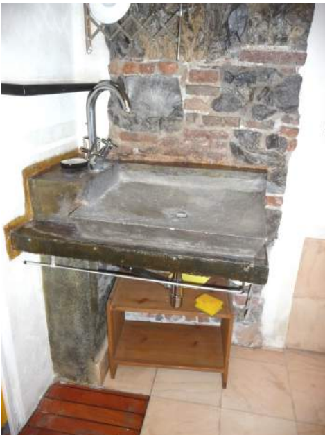
Foto 25. Bagno