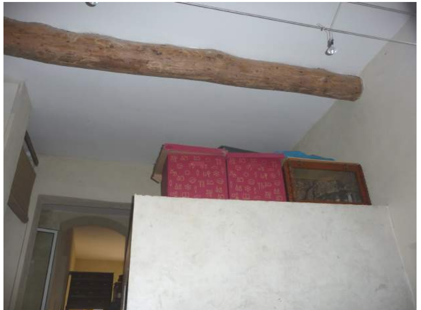
Foto 26. Ingresso e volume del bagno