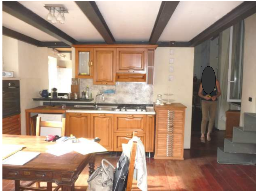
Foto 18. Soggiorno e angolo cottura.