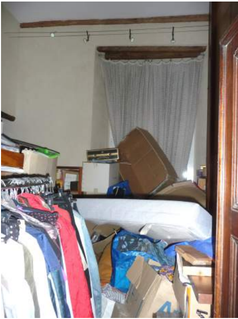
Foto 23. Camera