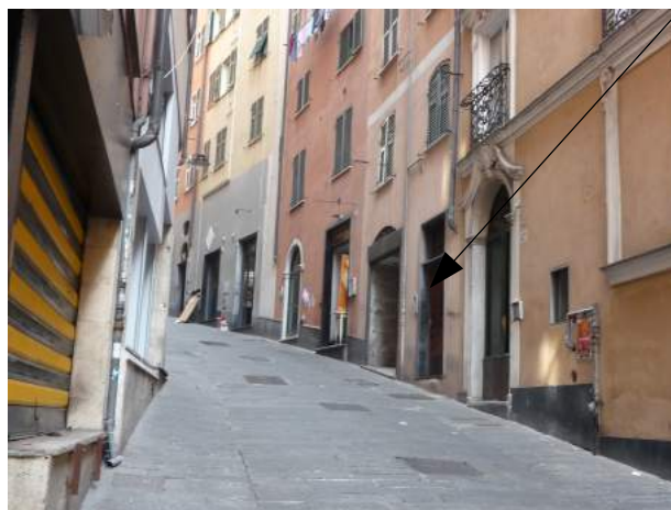
Foto 4 . Salita del Prione