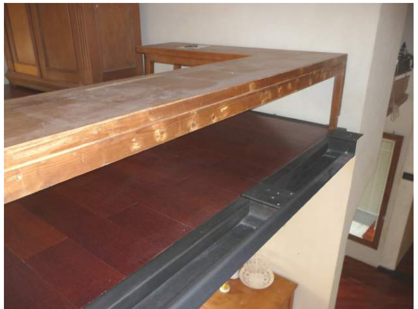
Foto 24. Soppalco