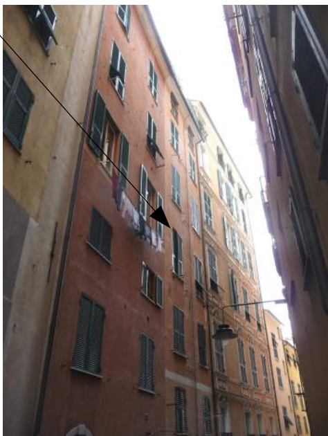
Foto 5. Facciata su sal. del Prione