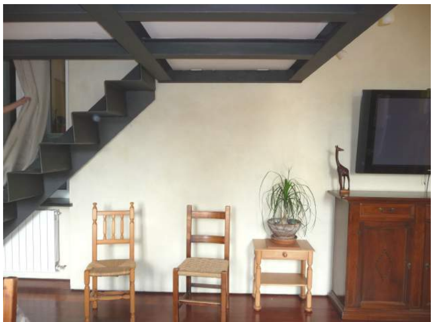
Foto 20. Soggiorno