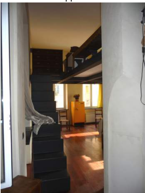
Foto 21. Soggiorno