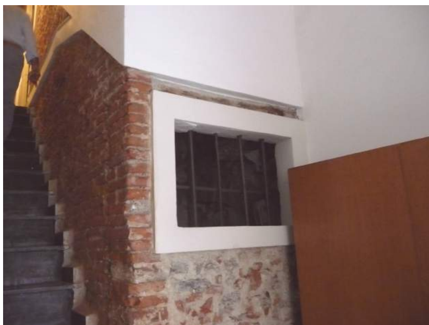
Foto 12. Vano scala.