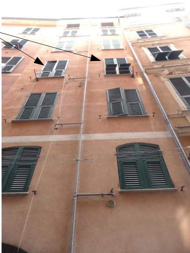
Foto 3. Facciata su Sal. Del Prione