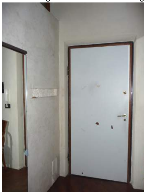
Foto 28. Porta di ingresso