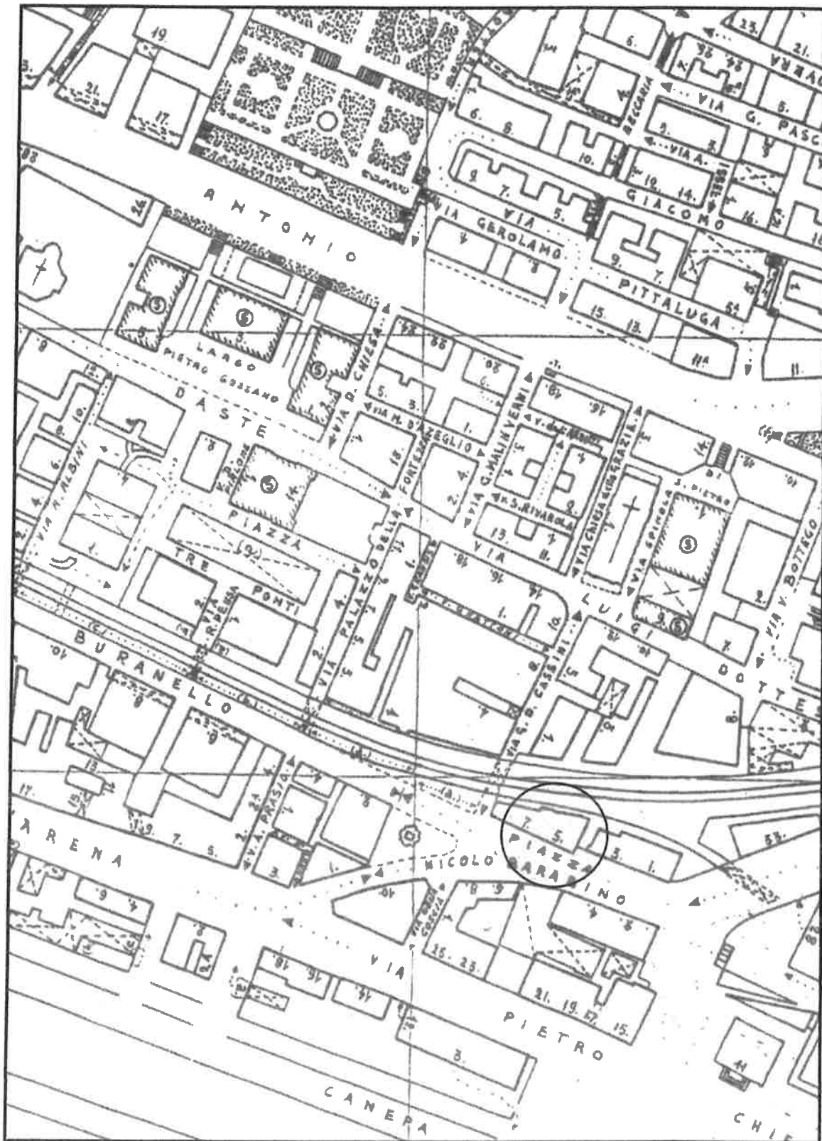
Allegato 2 – Toponomastica