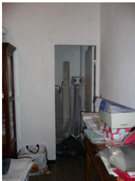
Foto 16. Ingresso e porta ripostiglio