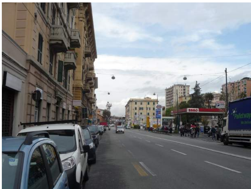
Foto 6. Via Cornigliano verso ponente