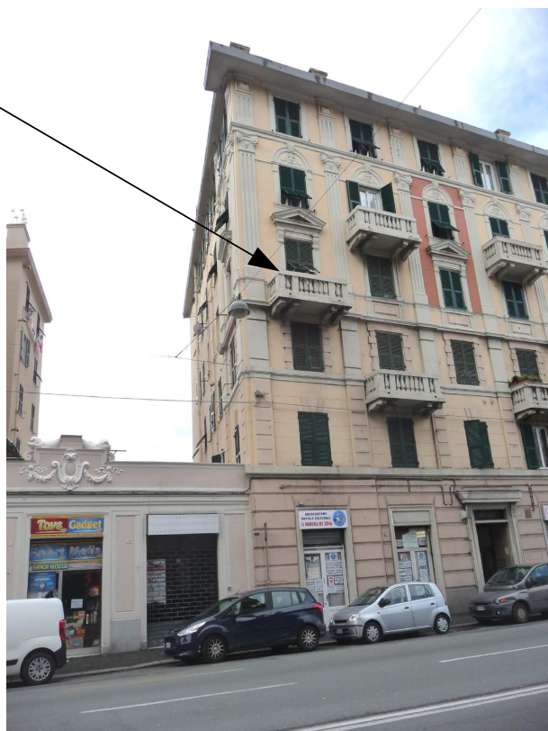
Foto 3. Angolo nord est dell'edificio