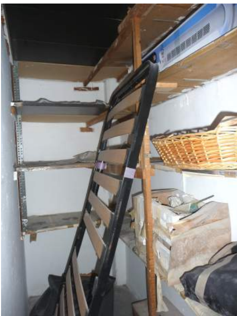
Foto 15. Ripostiglio