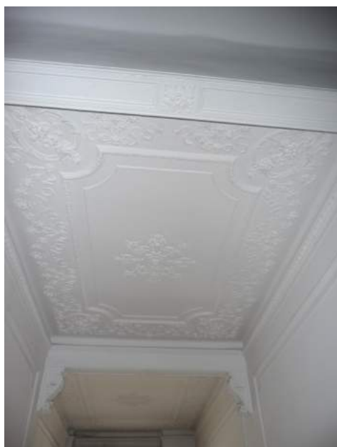
Foto 9 . Soffitto androne di ingresso