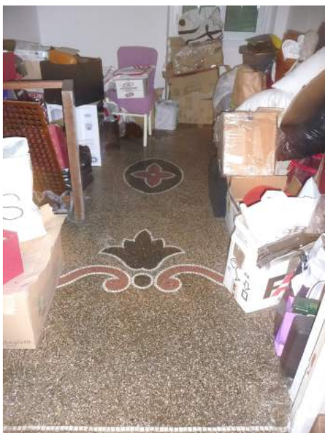
Foto 17. Stanza accessibile dall'ingresso