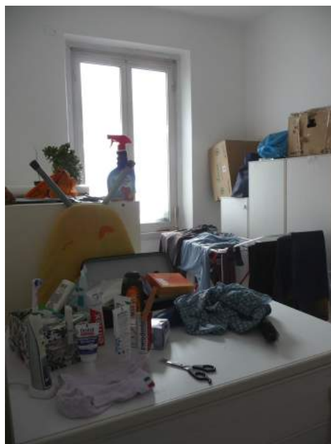
Foto 28. Camera ad est