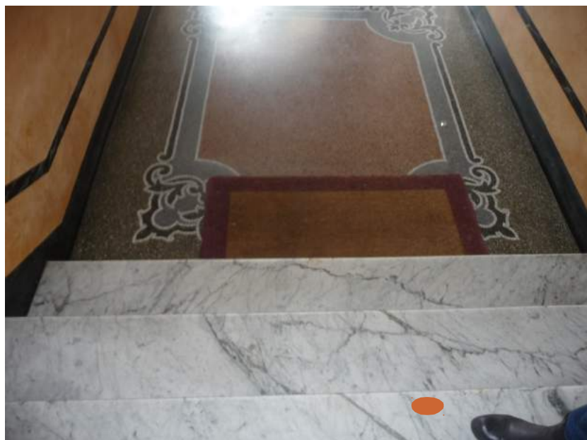
Foto 10. Pavimento androne di ingresso