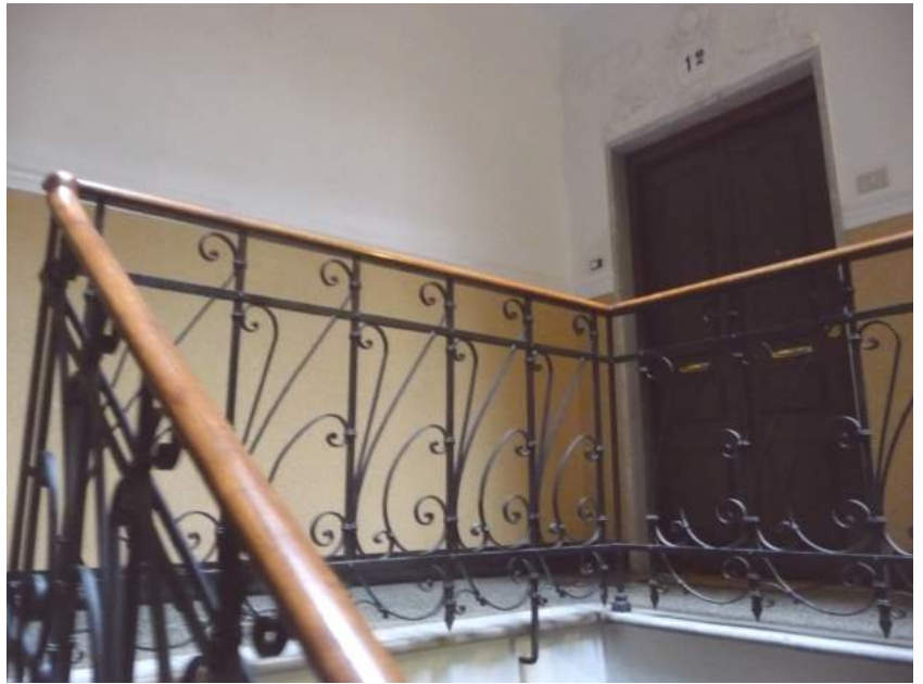
Foto 12. Vano scala.