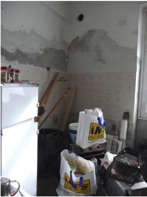
Foto 23. Cucina