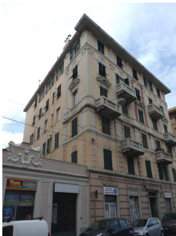
Foto 4. Angolo nord est dell'edificio