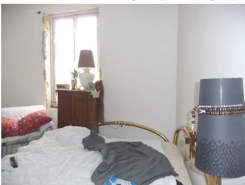
Foto 20. Camera d'angolo