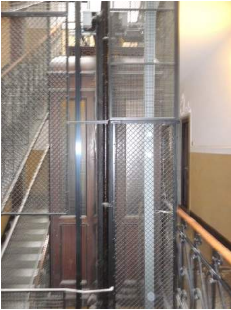
Foto 11. Ascensore