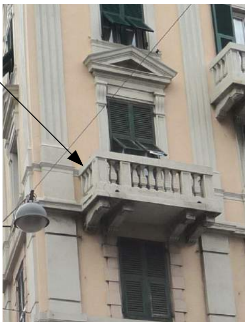
Foto 7 . Poggiolo int. 13