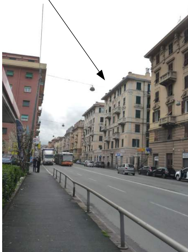
Foto 1. Via Cornigliano