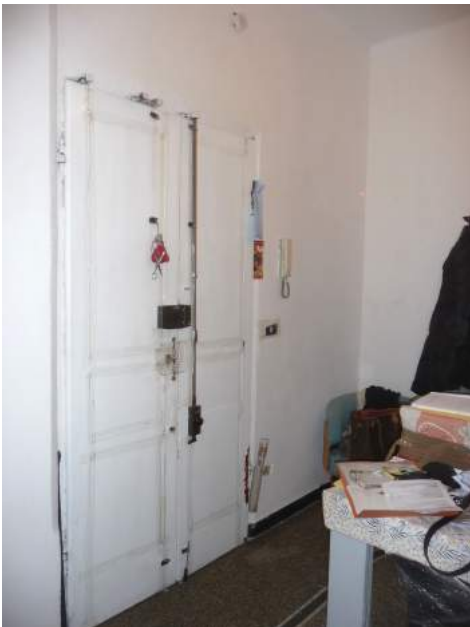
Foto 13. Porta di ingresso