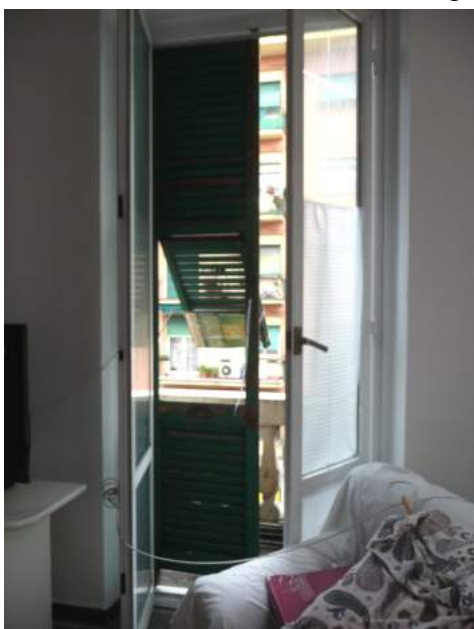
Foto 19. Camera d'angolo