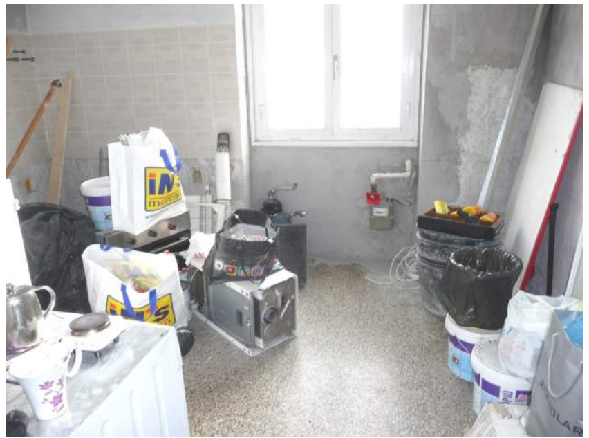
Foto 24. Cucina