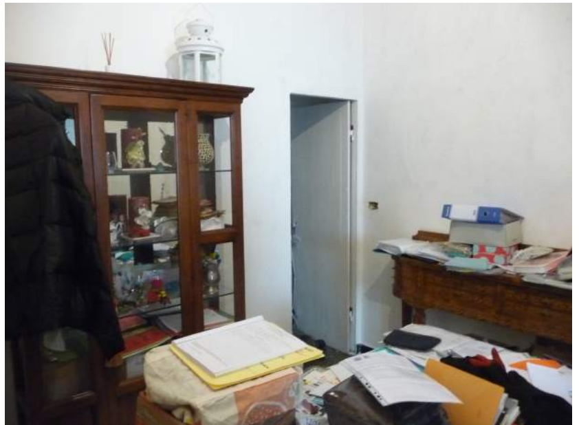
Foto 14. Ingresso e porta del ripostiglio