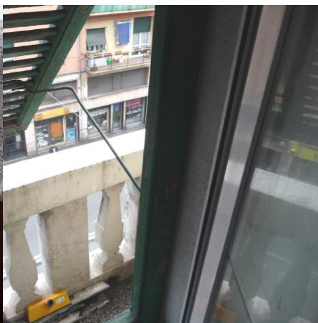
Foto 22. Idem, poggiolo su via Cornigliano