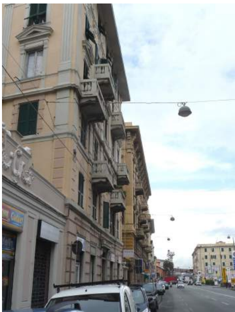
Foto 5. Via Cornigliano 54