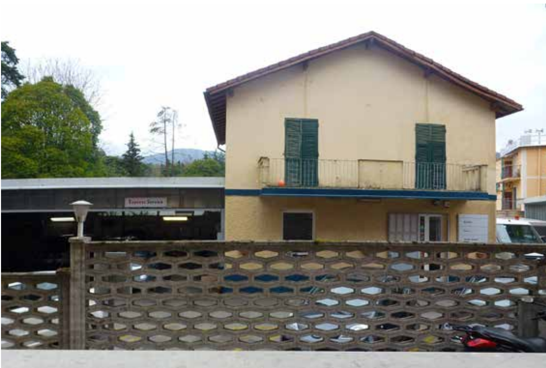
Foto 13 - Vista dalle finestre dell'immobile