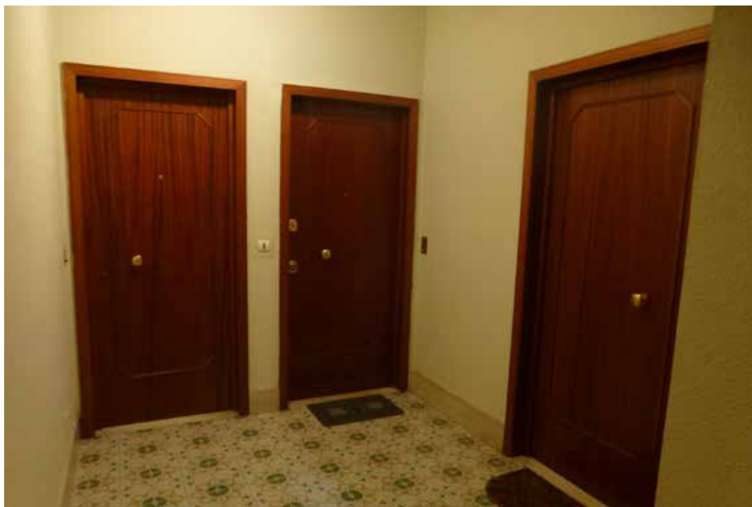
Foto 8 - Vista della porta di accesso all'immobile dal pianerottolo