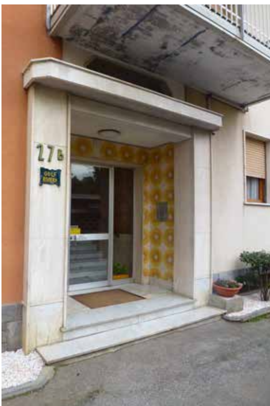
Foto 5 - Vista del portone del caseggiato