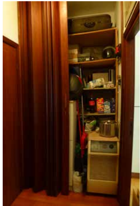
Foto 20 - Vista del ripostiglio