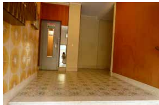
Foto 7 - Vista dell'atrio