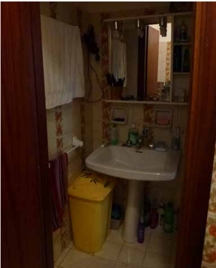
Foto 18 - 19 - Viste del bagno