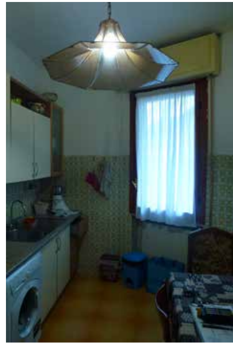
Foto 12 - Vista della cucina verso la finestra