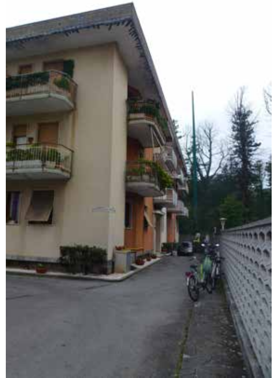
Foto 4 - Vista del lato di accesso del caseggiato