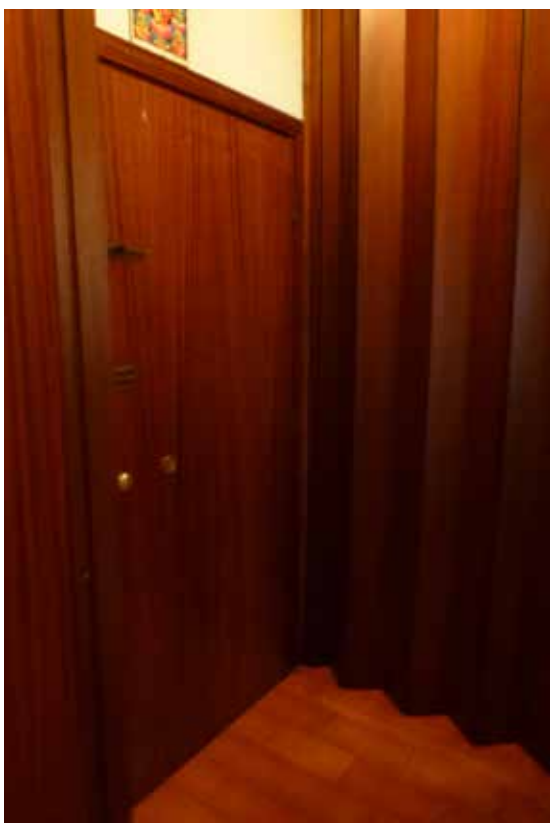
Foto 9 - Vista della porta di accesso all'immobile dall'interno