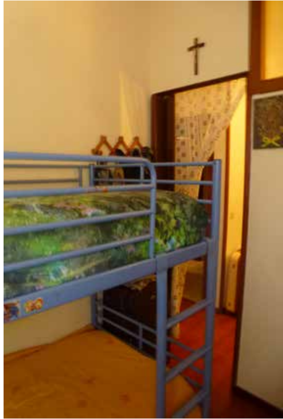
Foto 14 e 15- Vista della prima cameretta verso la porta e la finestra