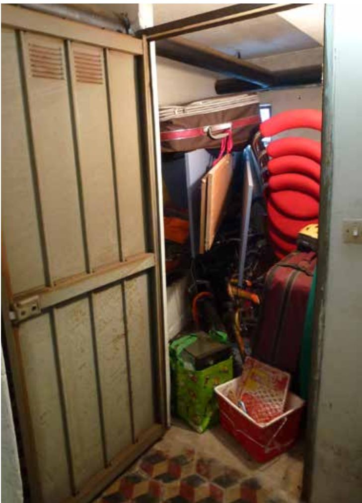
Foto 21 - Vista della cantina