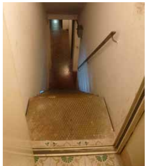
Foto 22 - Vista della scala alle cantine