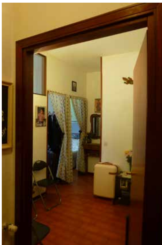
Foto 10 - Vista dall'ingresso verso il soggiorno