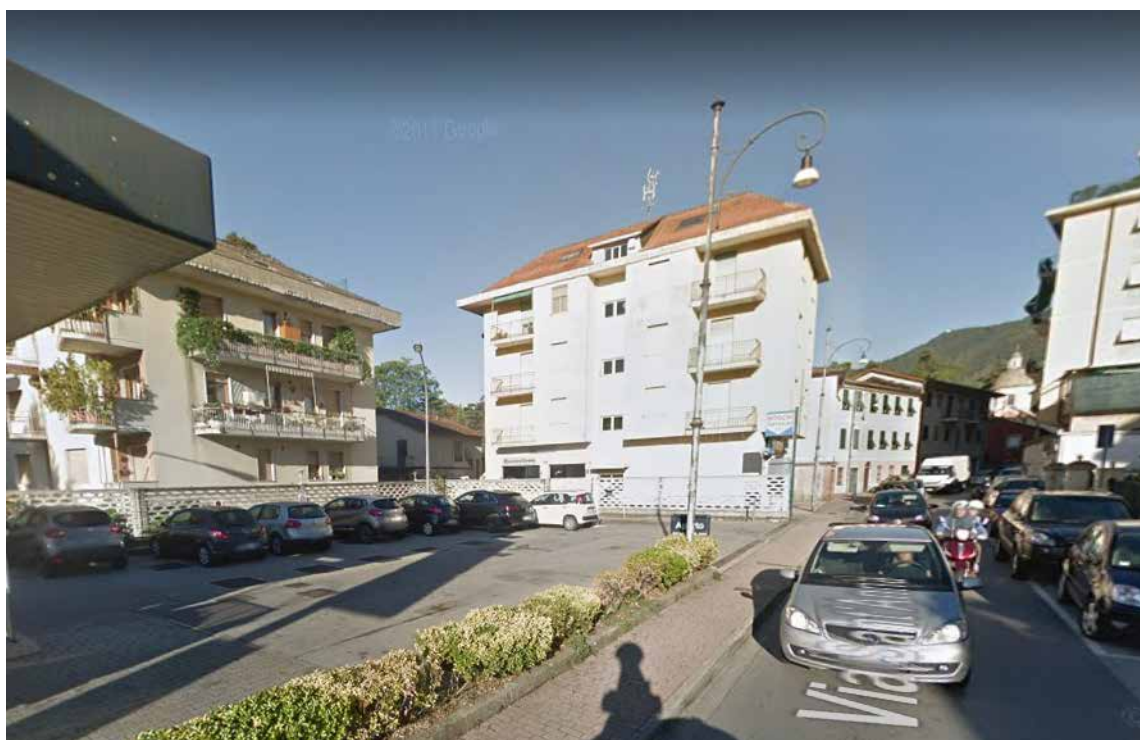
Foto 2 - Vista del caseggiato da levante