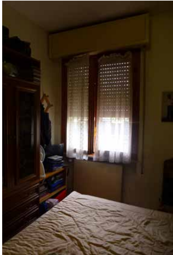
Foto 16 e 17 - Vista della seconda cameretta verso la porta e la finestra