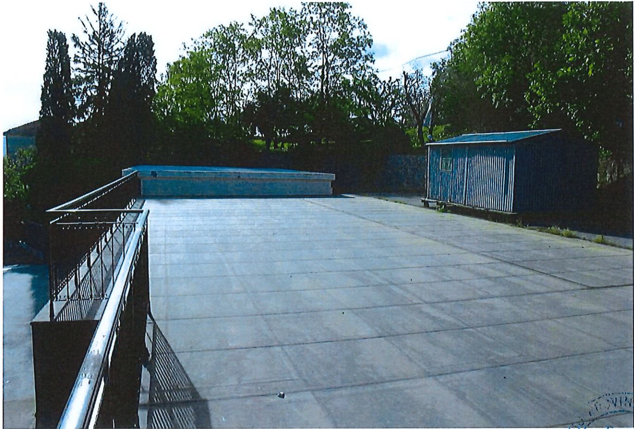
COPERTURE E RETRO PEDONABILE