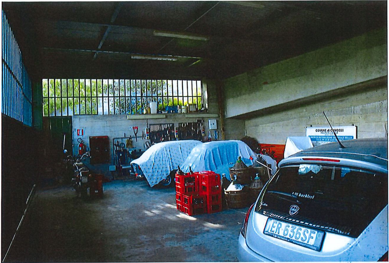
INTERNI SUB 1