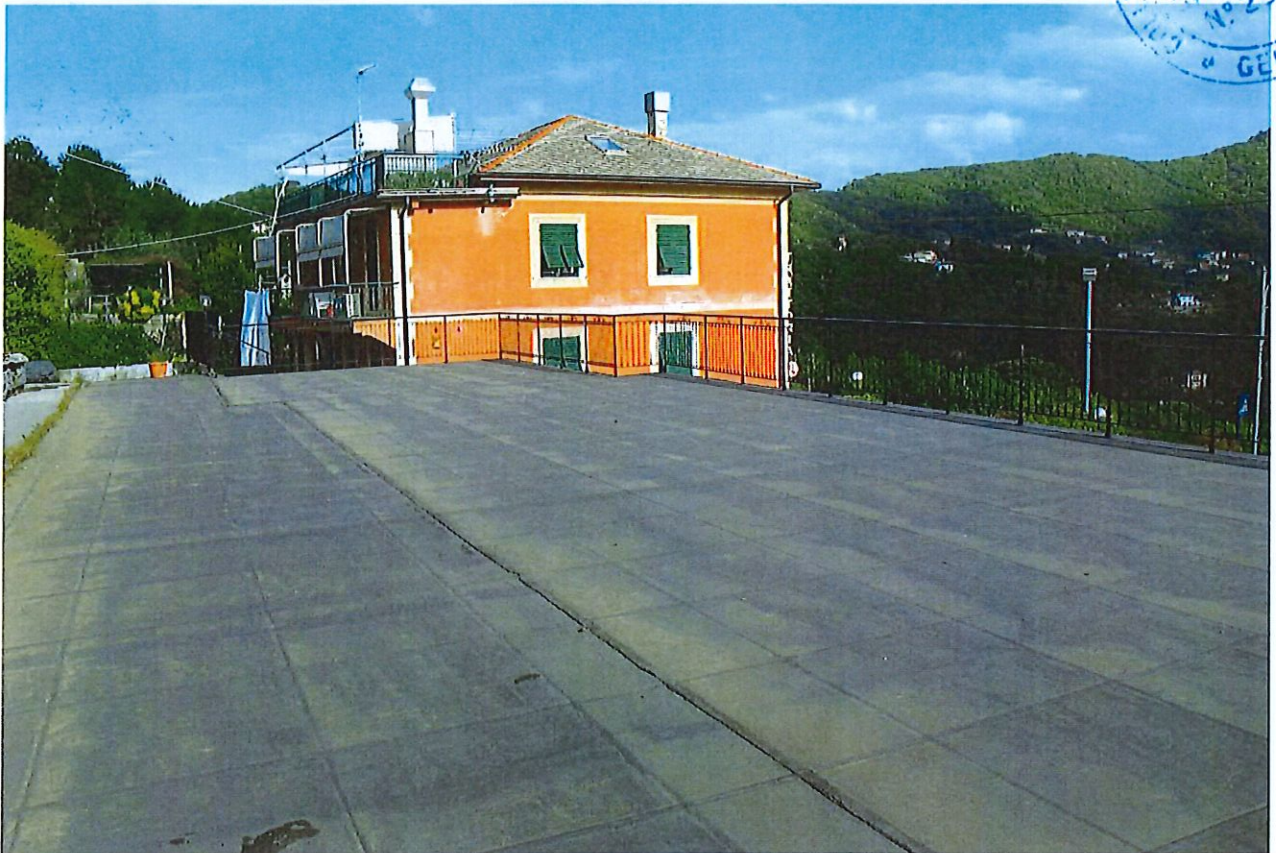
COPERTURA SUB 2