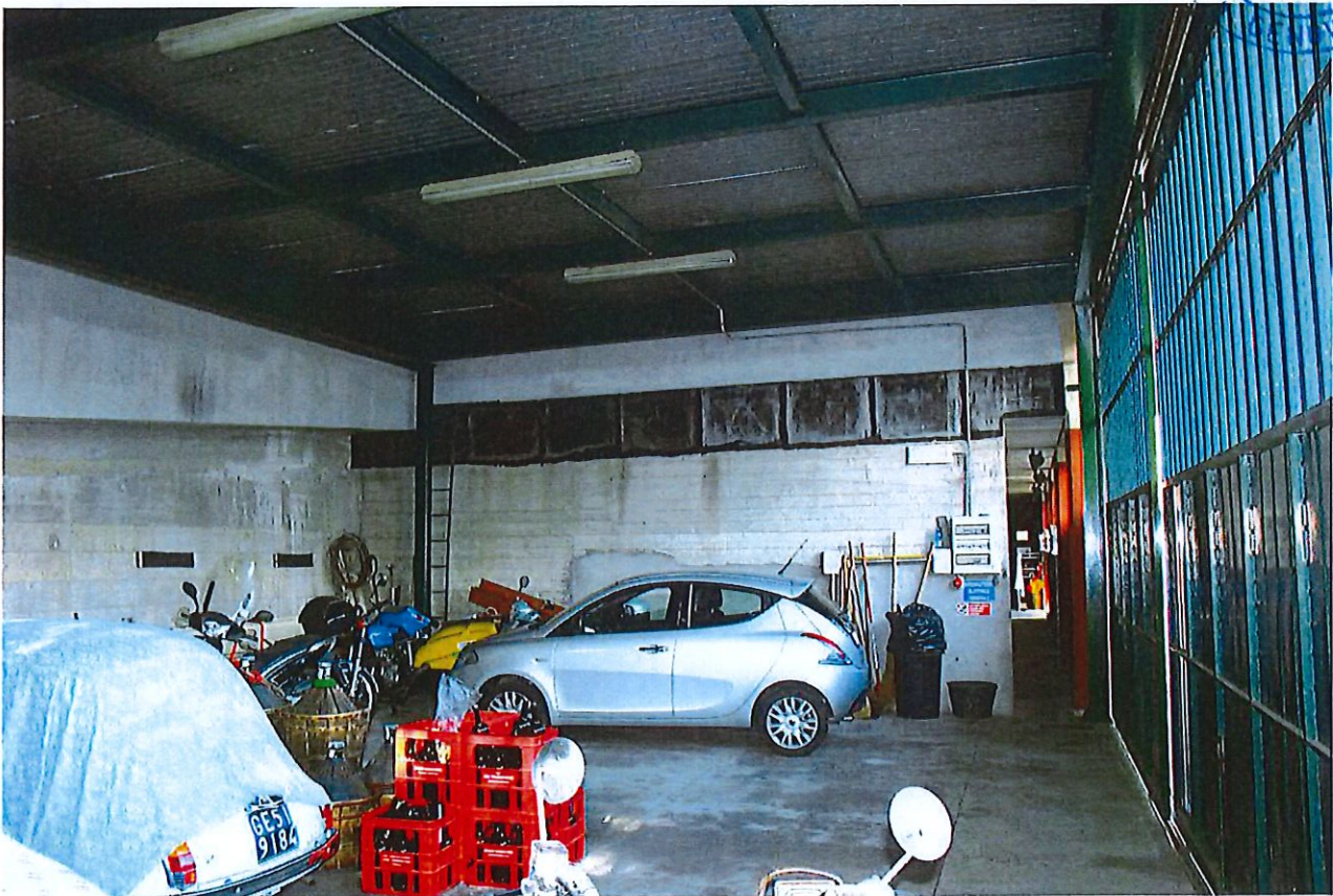
INTERNI SUB 2