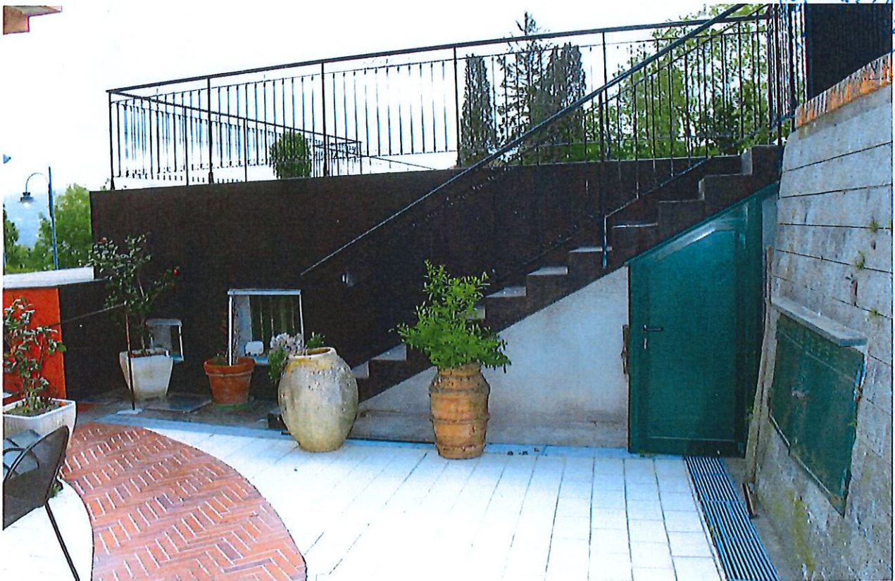
LIMITE COPERTURA- PROSPETTO OVEST