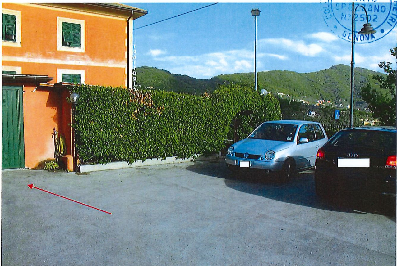
LIMITE' SERVITU' DEL SUB 3