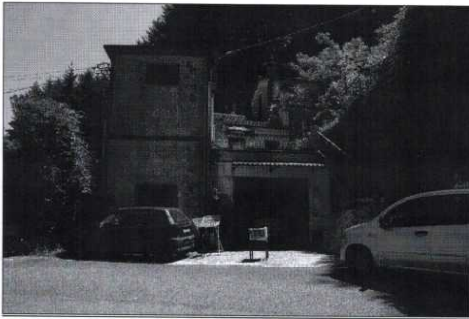
Fotografia n. 1