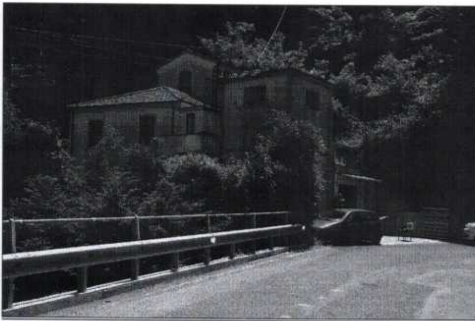
Fotografia n. 2