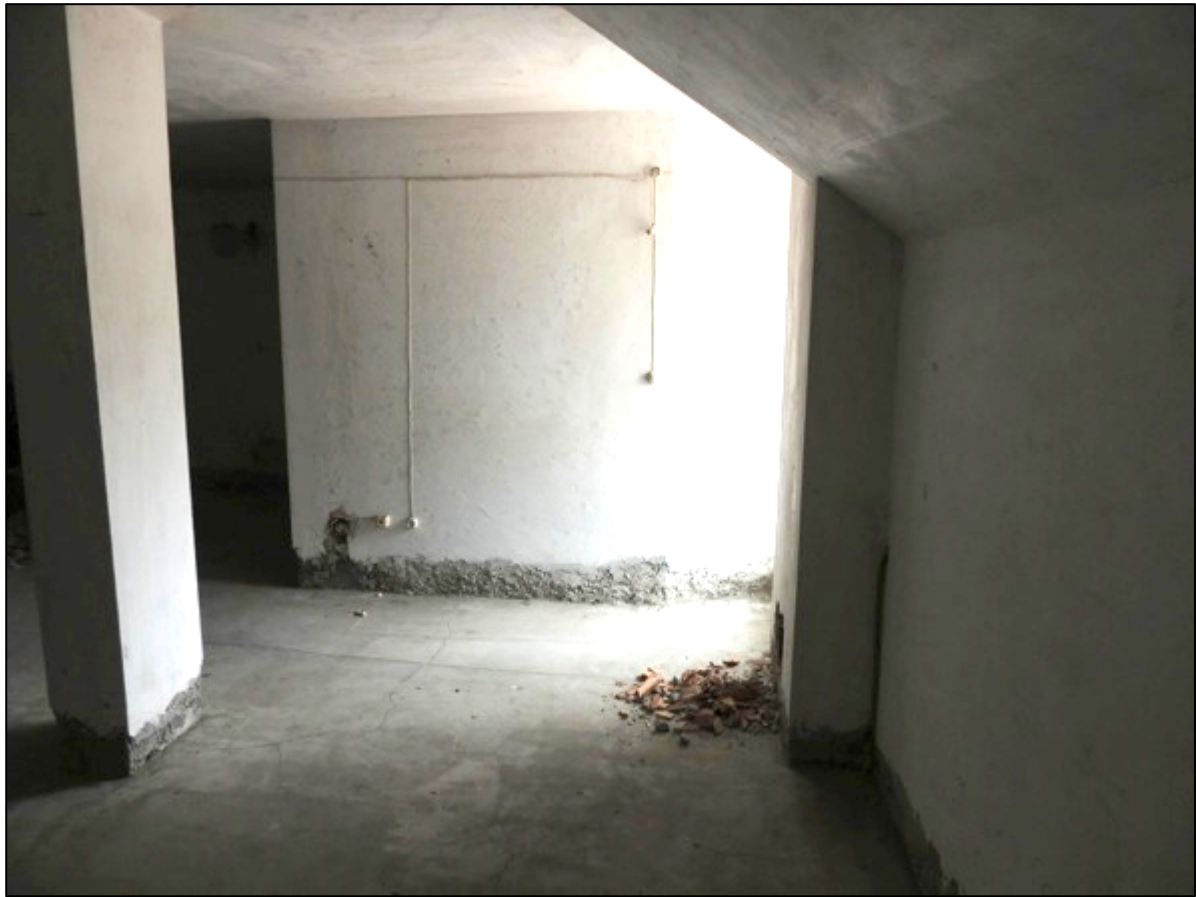
Foto 15 – sullo sfondo il muro della cabina ascensore e a destra la portafinestra di accesso al terrazzo