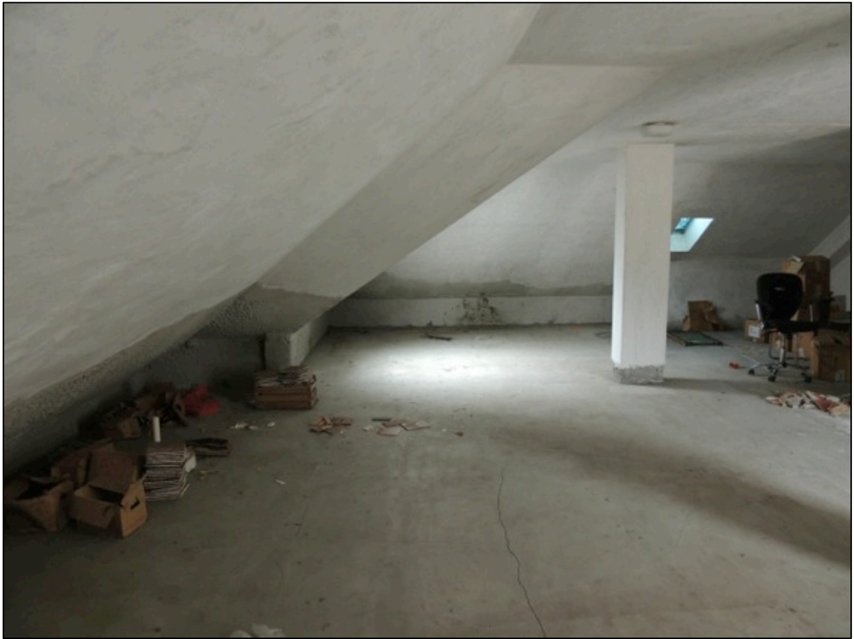
Foto 13 – sullo sfondo il lato ovest e sulla sinistra le falde spioventi verso sud