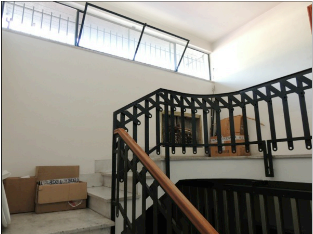
Foto 1 – rampa di scale per accedere al quarto piano di via Bosena 13