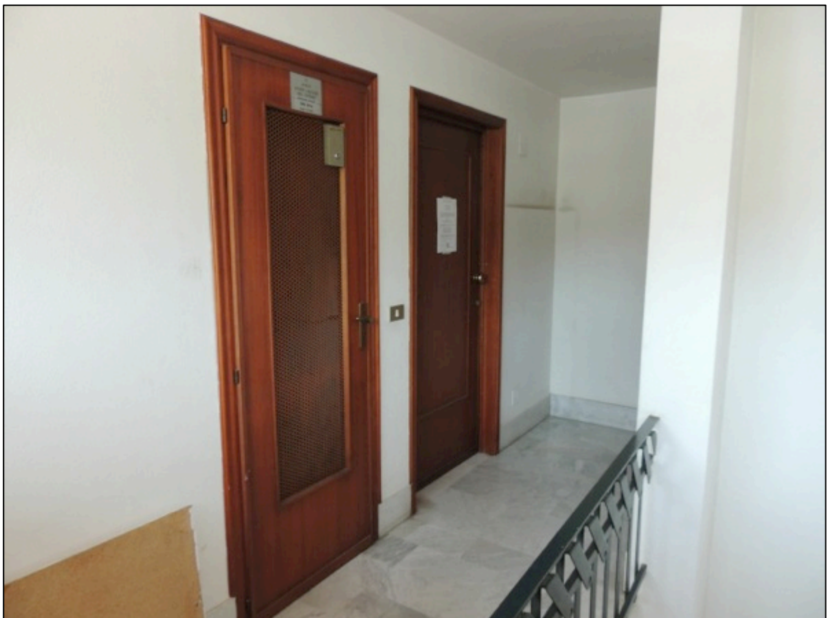
Foto 2 – pianerottolo del quarto piano: in primo piano la porta del locale ascensore e l'ingresso all'interno 17