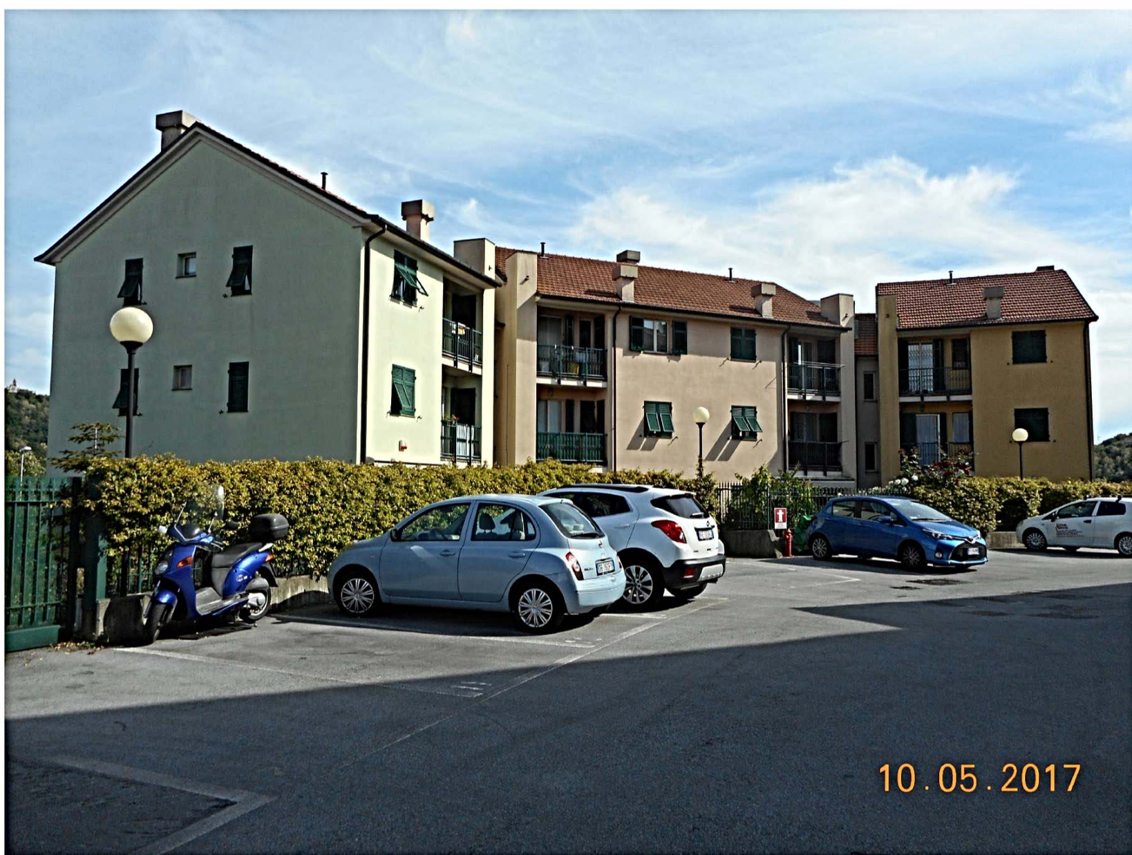
foto 1: vista d'insieme dell'edificio: l'appartamento in oggetto è al piano terra sul corpo in primo piano.