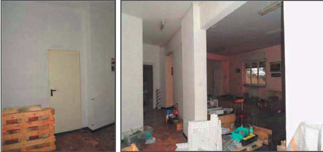
Foto 15-16: Porta metallica tra ingresso e magazzino e vista del disimpegno e magazzino