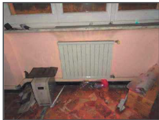
Foto 28-29: Dettaglio del controsoffitto dell'ufficio 2 e dettaglio dei caloriferi