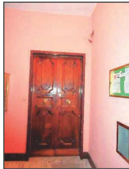
Foto 13-14: Atrio condominiale e porta caposcala di accesso al bene