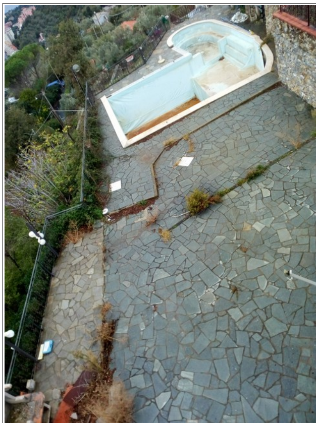
VISTA PISCINA DAL BALCONE P2