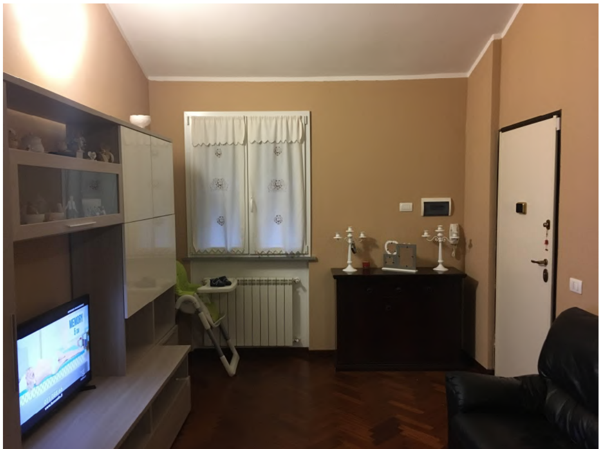
FOTO 6: interno appartamento accesso civ.3B int. 5 (corpo A), soggiorno