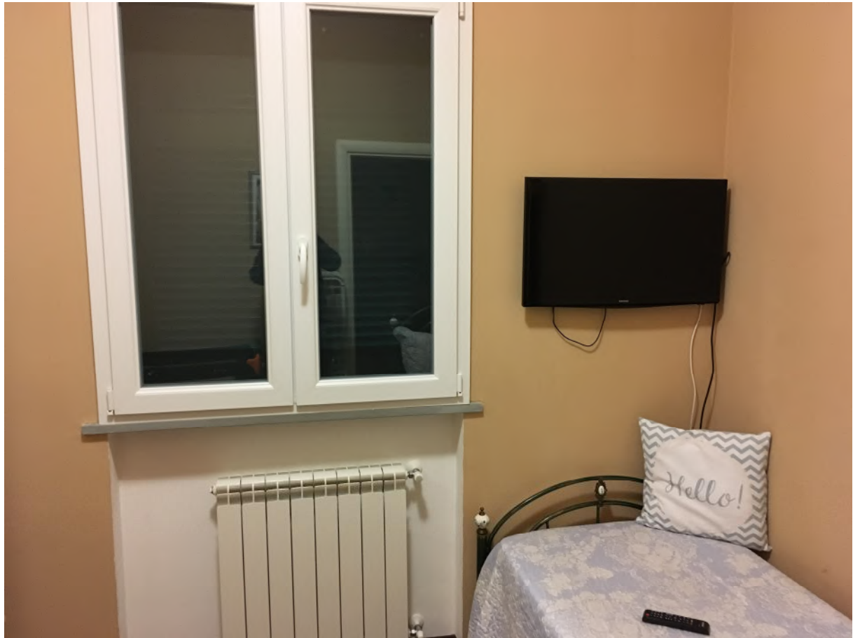
FOTO 9: interno appartamento accesso civ.3B int. 5 (corpo A), seconda camera