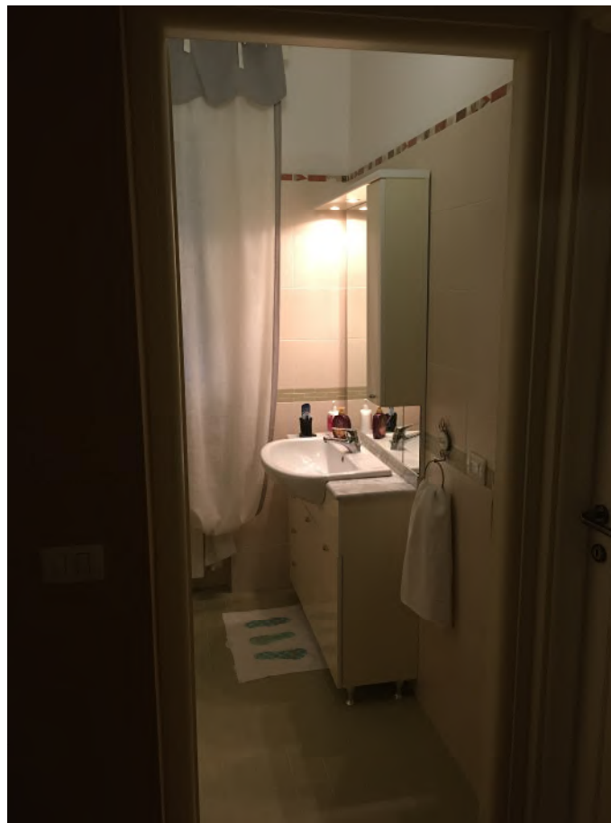
FOTO 10: interno appartamento accesso civ.3B int. 5 (corpo A), bagno