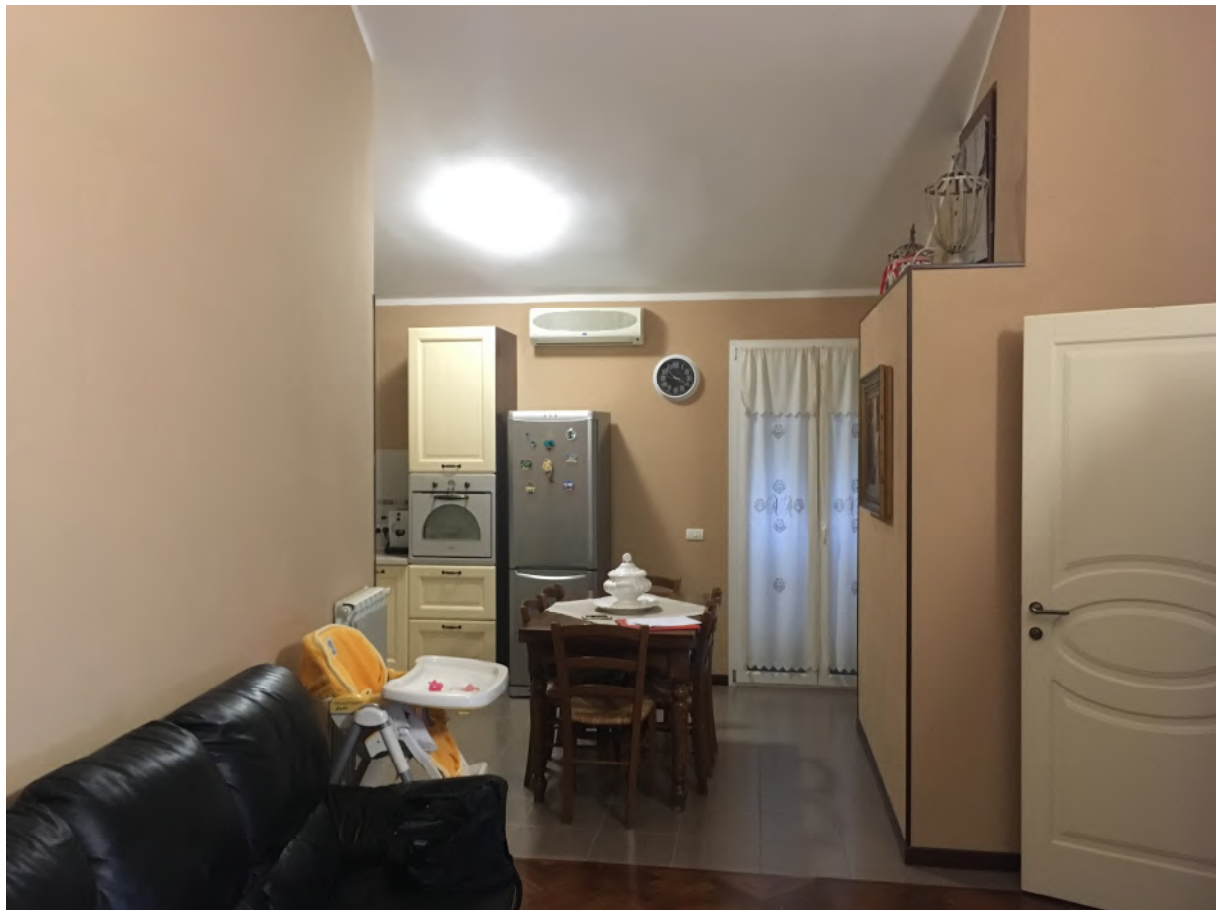
FOTO 7: interno appartamento accesso civ.3B int. 5 (corpo A), zona pranzo/cottura