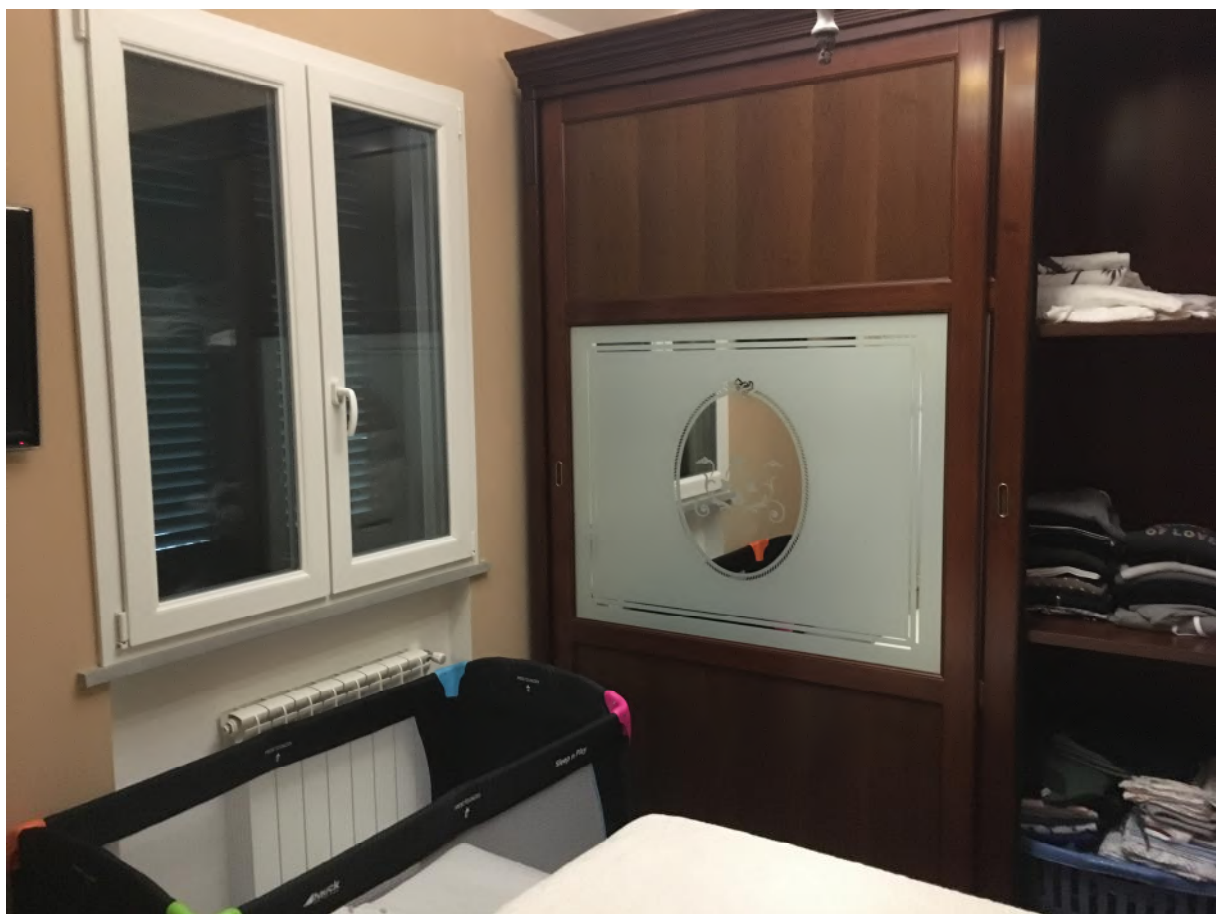
FOTO 8: interno appartamento accesso civ.3B int. 5 (corpo A), camera