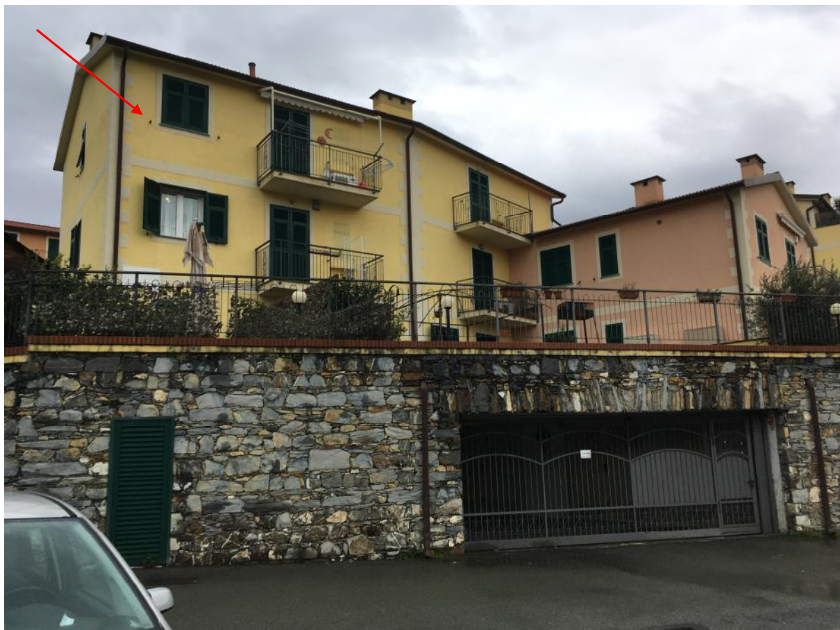
FOTO 1: prospetto sud del fabbricato civ.3B Indicazione appartamento in esame (corpo A) e cancello accesso box (corpo B)