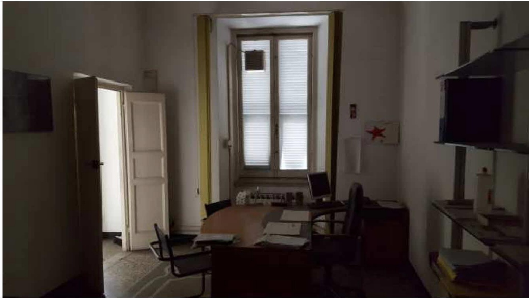
Ufficio – lato via Sampierdarena