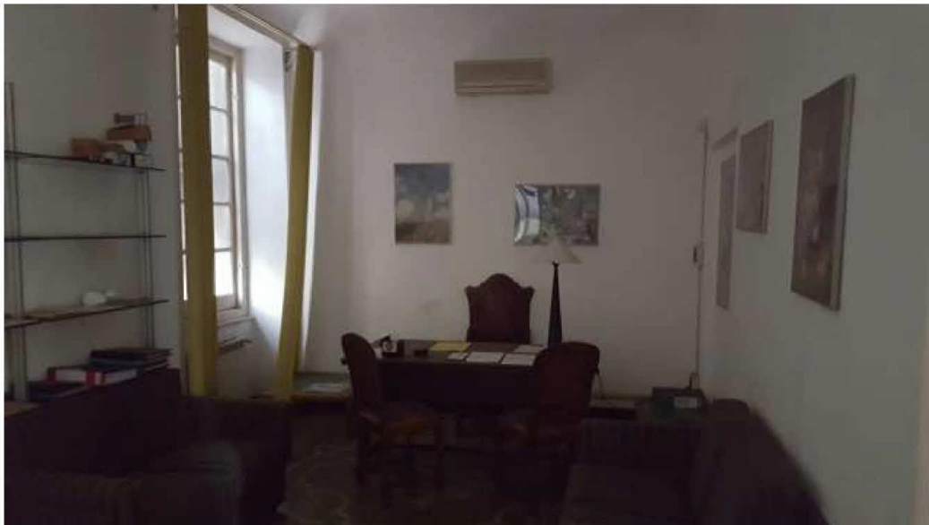
Ufficio – lato via Sampierdarena