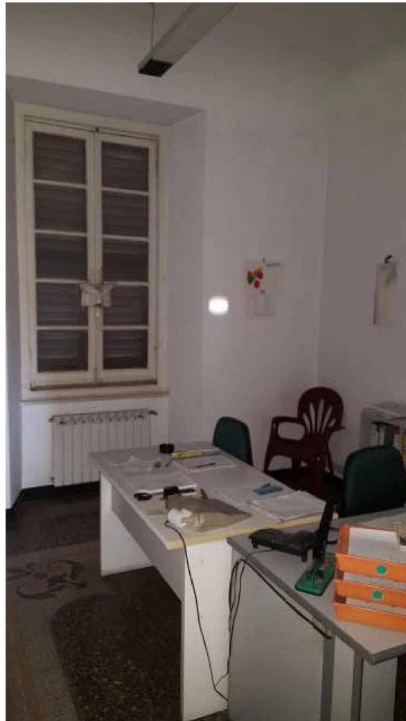
Ufficio su via Bruno