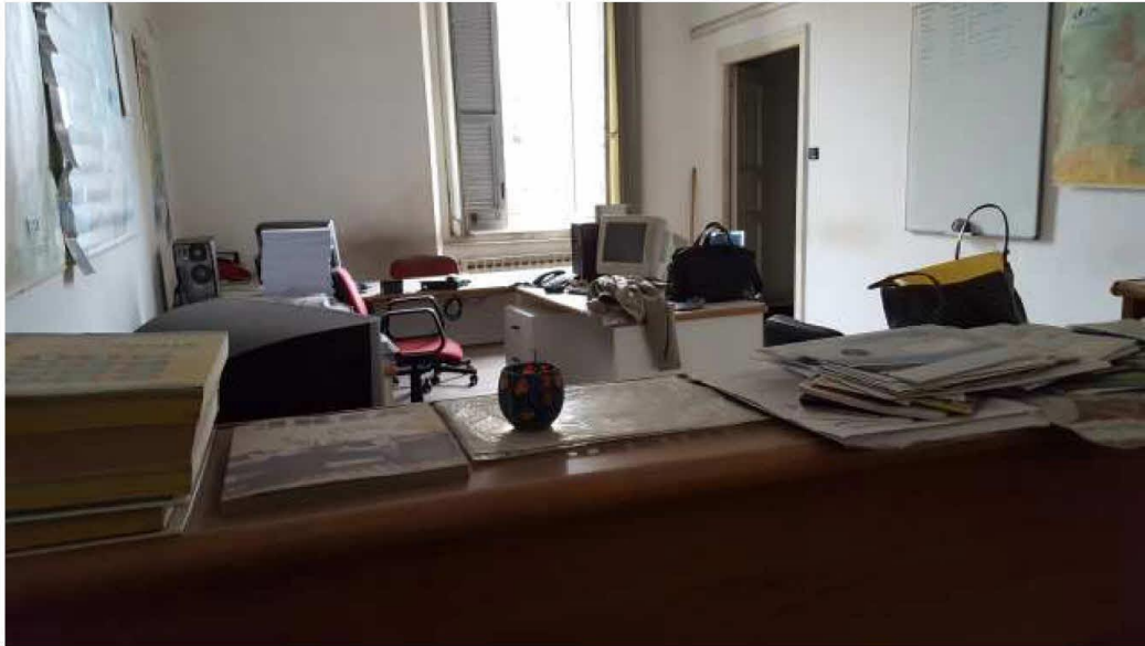
Ufficio - ingresso