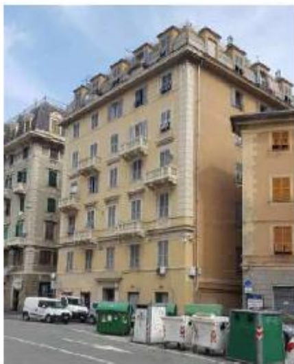
Vista edificio dalla strada