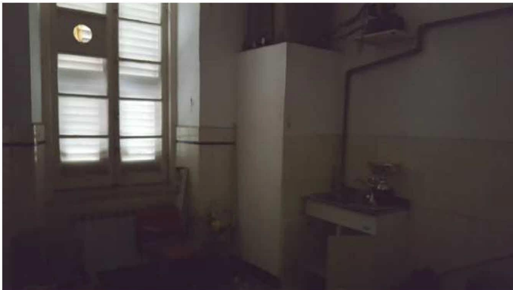
Archivio - Cucina