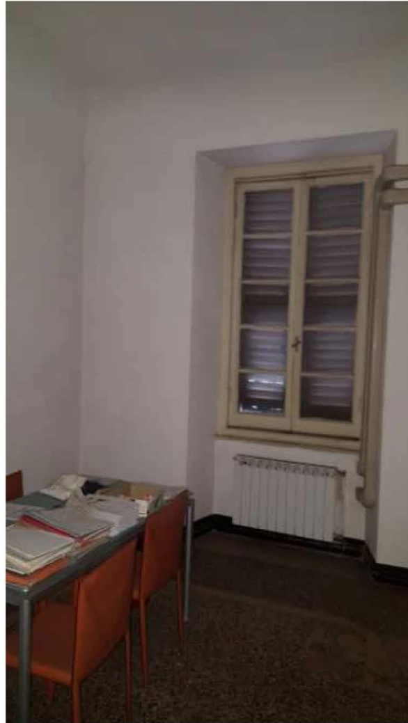
Ufficio su via Bruno