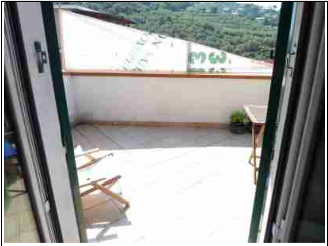
Foto 14 - particolare terrazzo a vasca sottotetto