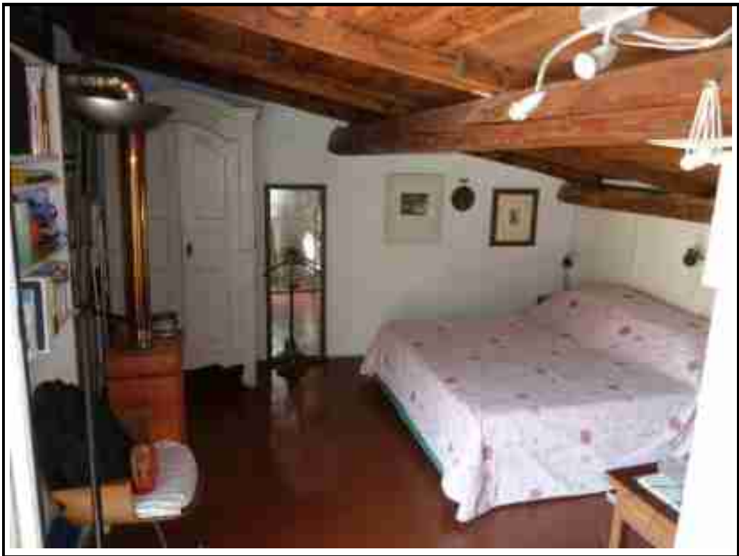
Foto 12 - particolare sottotetto