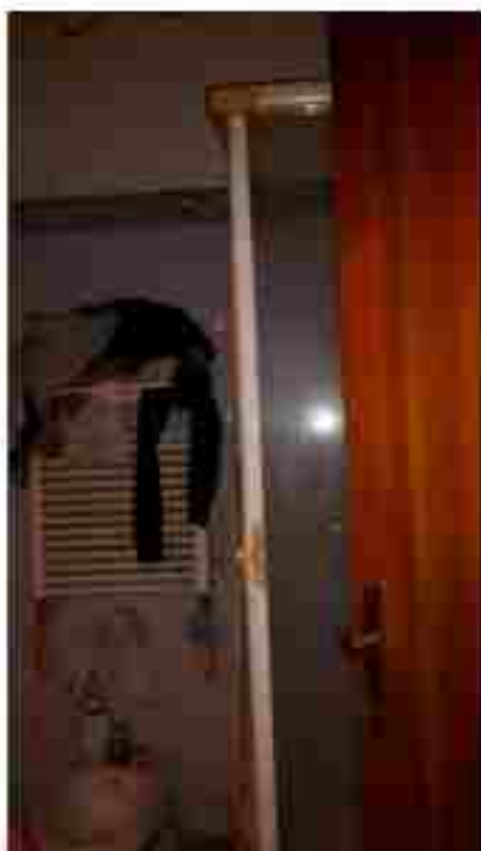
BAGNO PIANO PRIMO