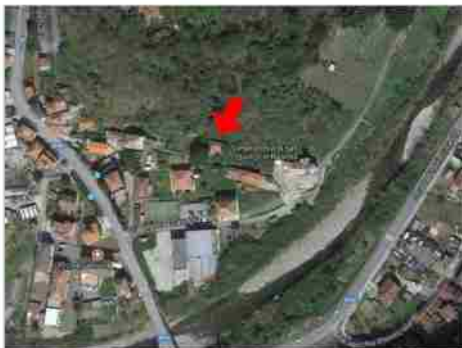
1.1 - Mappa satellite livello urbano