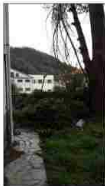
VISTE DEL GIARDINO