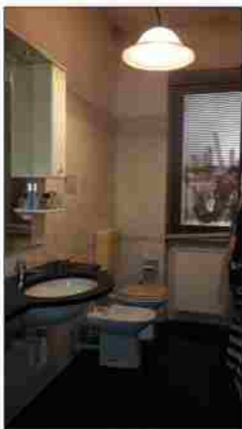
BAGNO PIANO TERRA