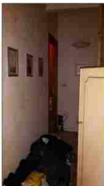
DISIMPEGNO PIANO PRIMO