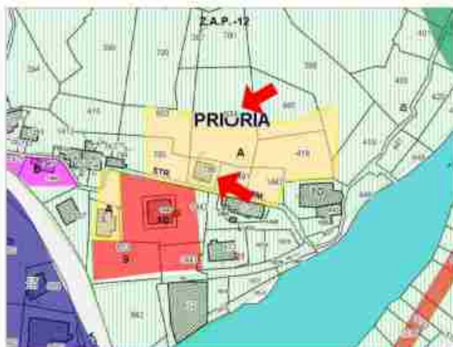
1.2 - Estratto dal Piano di Fabbricazione