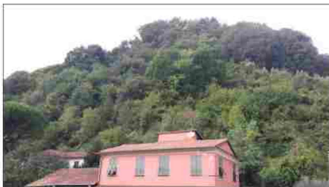
VISTA DEL TERRENO