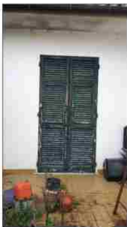
TERRAZZO PIANO PRIMO