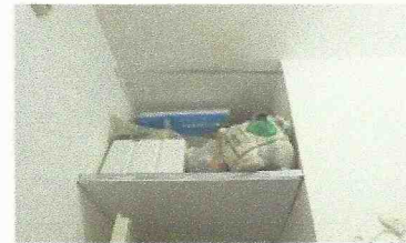
WC: lastra di compensato a fungere da soppalco