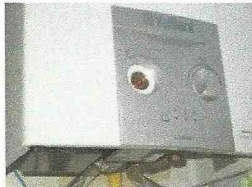
la calderina (ACS)