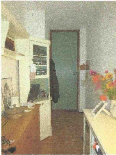
ingresso:vista verso il portoncino e la camera