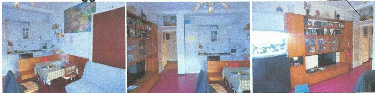
soggiorno: vista verso il cucinino e la porta di accesso

fasce in compensato che fungono da supporto per piccolo soppalco