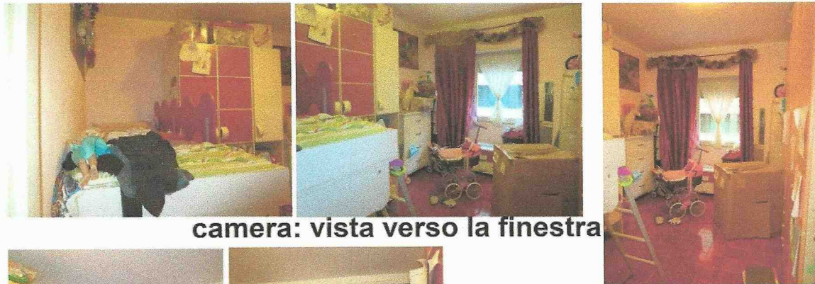
camera: vista verso la finestra