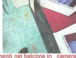
pavimenti nel balcone in camera, soggiorno, corridoio bagno sgabuzzino