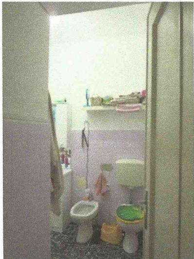
bagno/WC vista dal corridoio