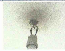
l'impianto elettrico non è dotato di conduttore di terra