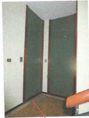
portoncino interno 7