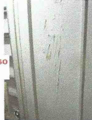
la porta di accesso allo sgabuzzino