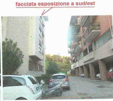
facciata esposizione a sud/est