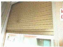
le tapparelle in camera (in alluminio)