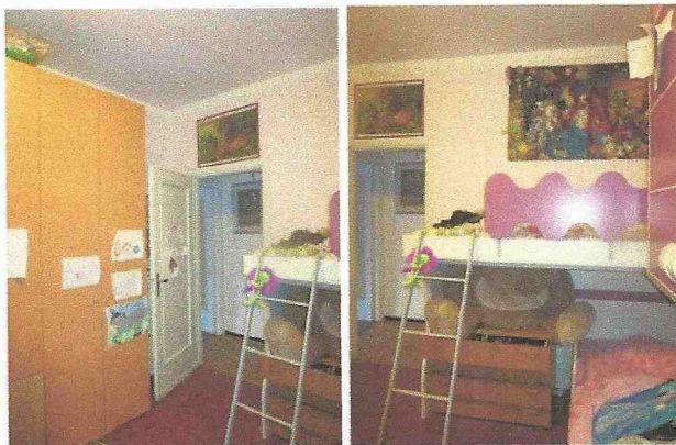
camera: vista verso il corridoio

All. 5.2 foto del soggiorno/cucinino e della camera da letto