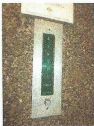
i sei piani serviti dall'ascensore