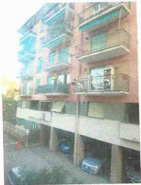
la vista dalla camera