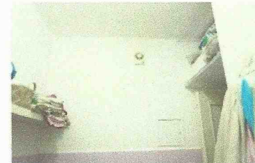
WC: aspirazione forzata

All. 5.3 ingresso/corridoio bagno/WC sgabuzzino