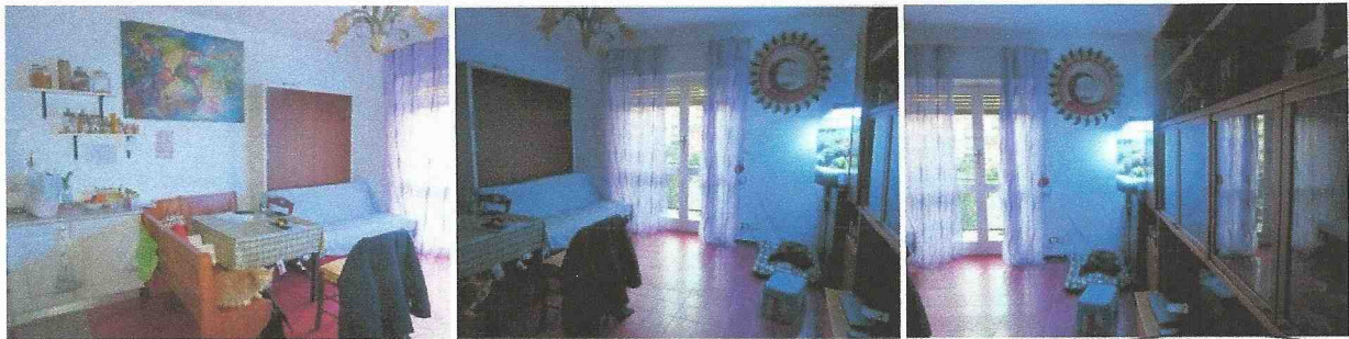
soggiorno: vista verso la finestra

fasce in compensato che fungono da supporto per piccolo soppalco