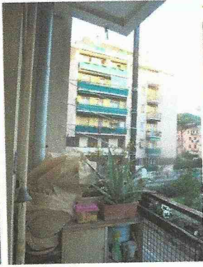
la vista dal soggiorno