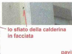
lo sfiato della calderina in facciata