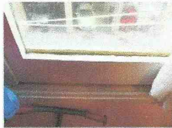
le finestre in legno (vetro singolo) in mediocri condizioni