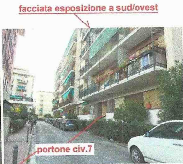
facciata esposizione a sud/ovest