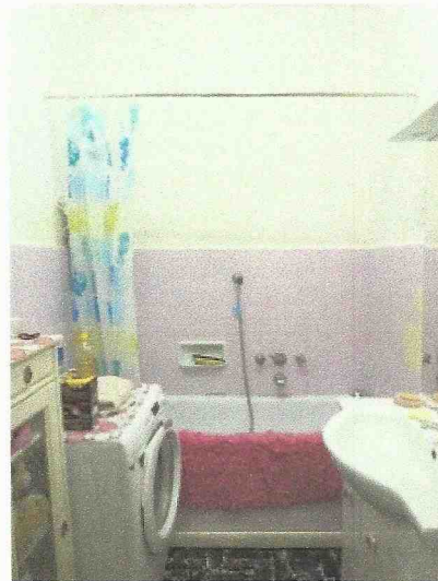
vista verso la vasca