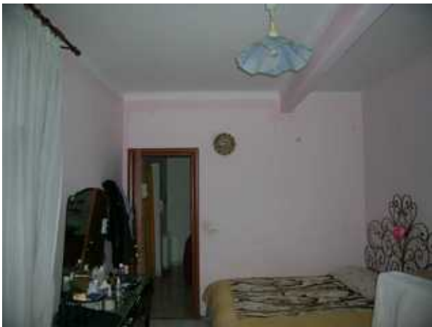
Camera 1- controcampo