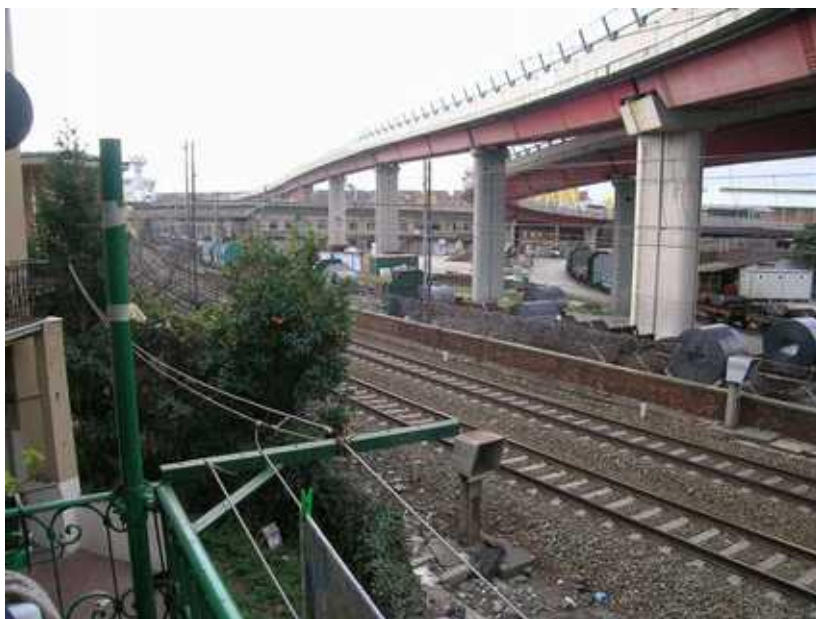
Affaccio lato Ovest - vista verso sud - dal Poggiolo