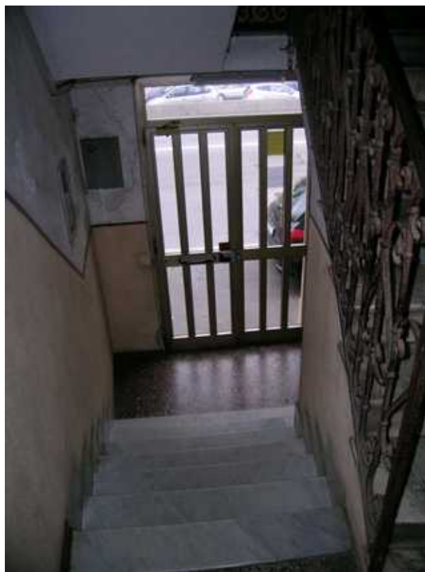
vista interna del ingresso