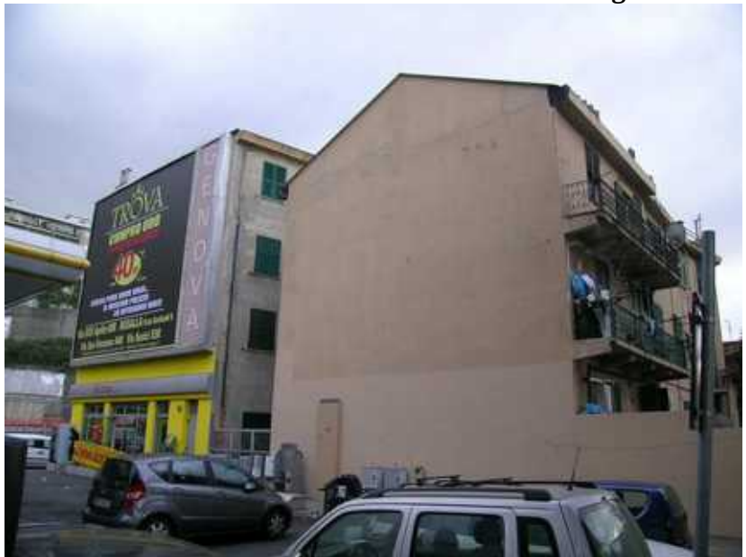
Prospetto Nord- civ 34 Via A. Siffredi