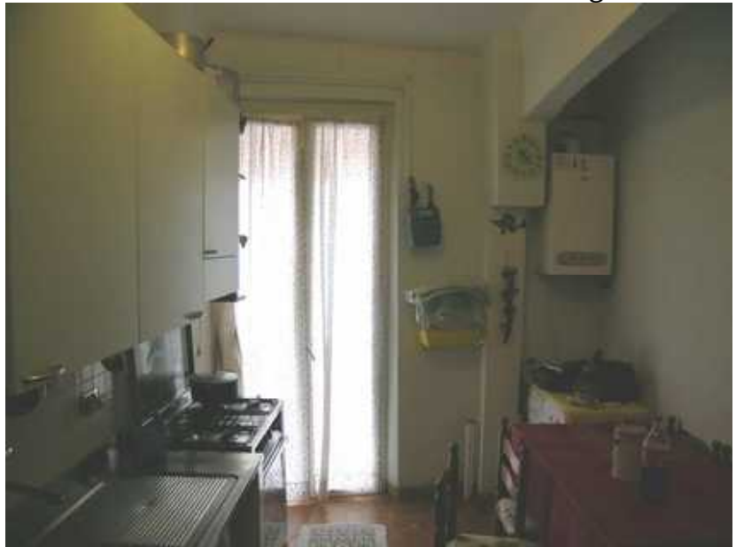
Cucina - con porta di accesso al Poggiolo