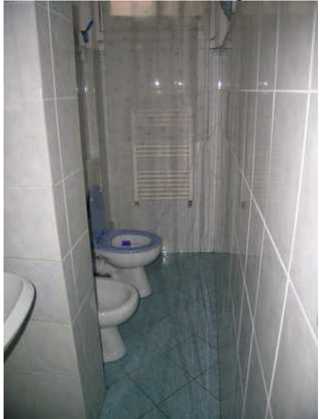
Servizio Igienico- Bagno