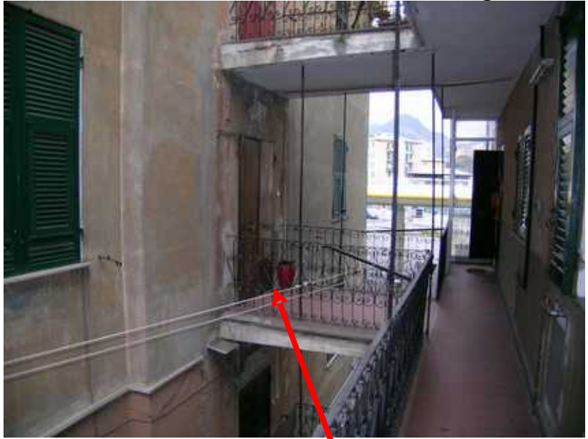
vista del ballatoio e della passerella di accesso all'unità in oggetto