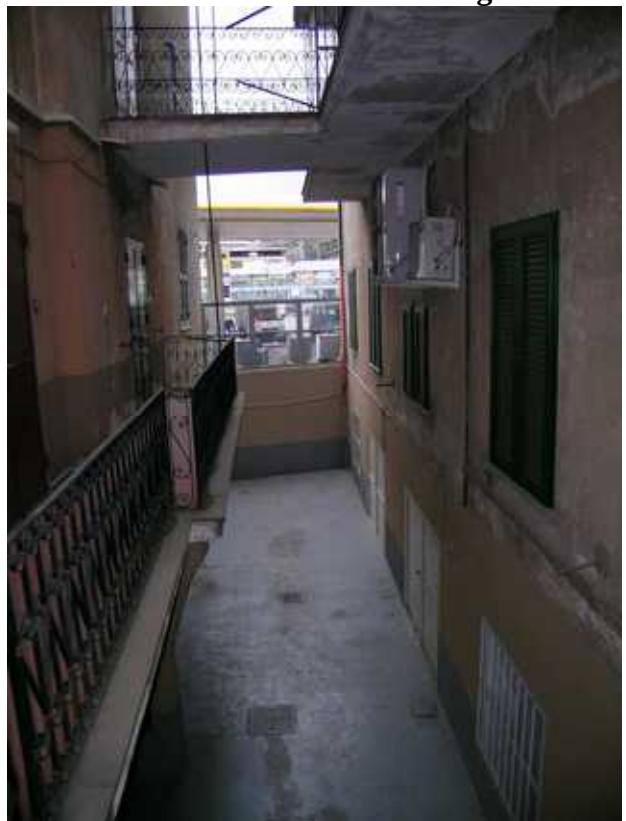
vista delle passerelle di accesso agli appartamenti e del piano fondi carrabile