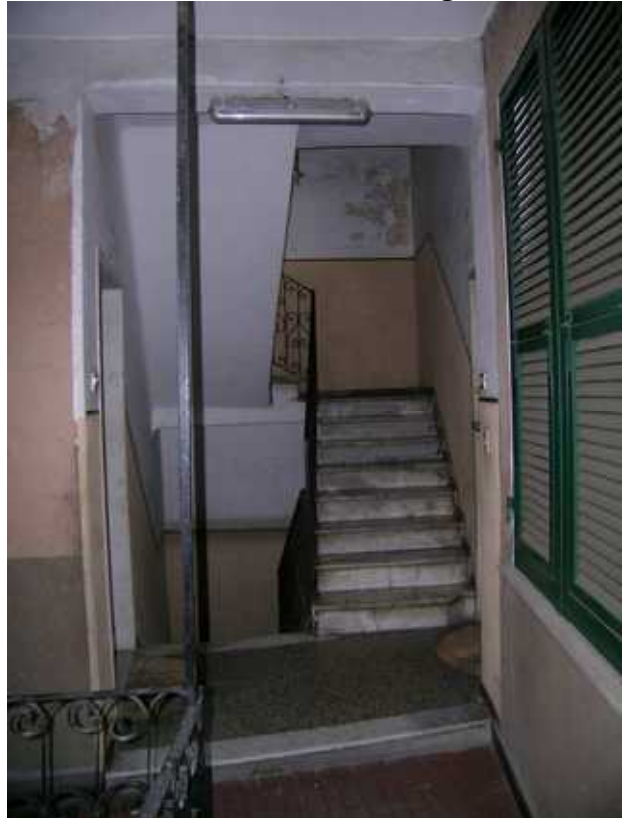
Vista del Vano Scala dalla passerella/ballatoio