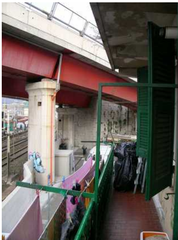
Affaccio lato Ovest - vista verso nord -dal Poggiolo