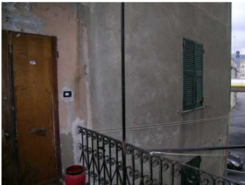
Vista della persiana della camera 1