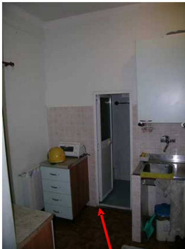
Cucina - vista verso l'ingresso al bagno