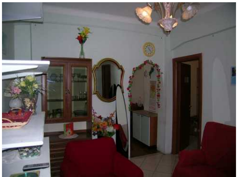
Vano Ingresso Soggiorno