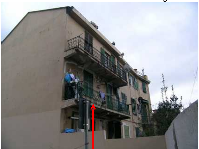
Prospetto Ovest- civ 34 Via A. Siffredi dettaglio del terrazzo di proprietà