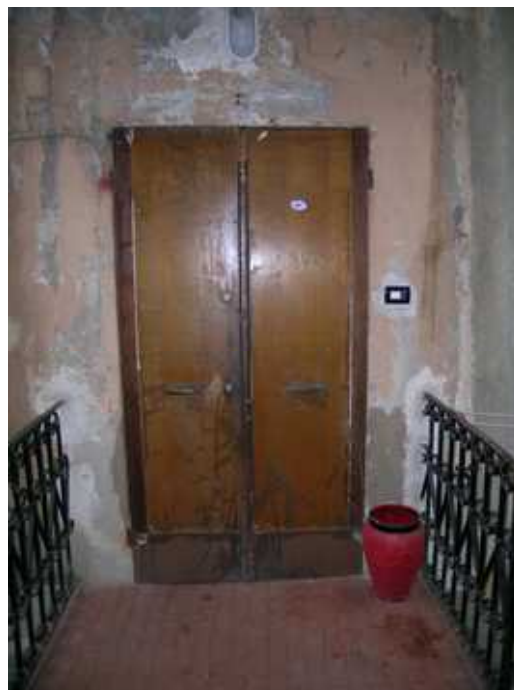
Vista dalla Porta di Ingresso esterna