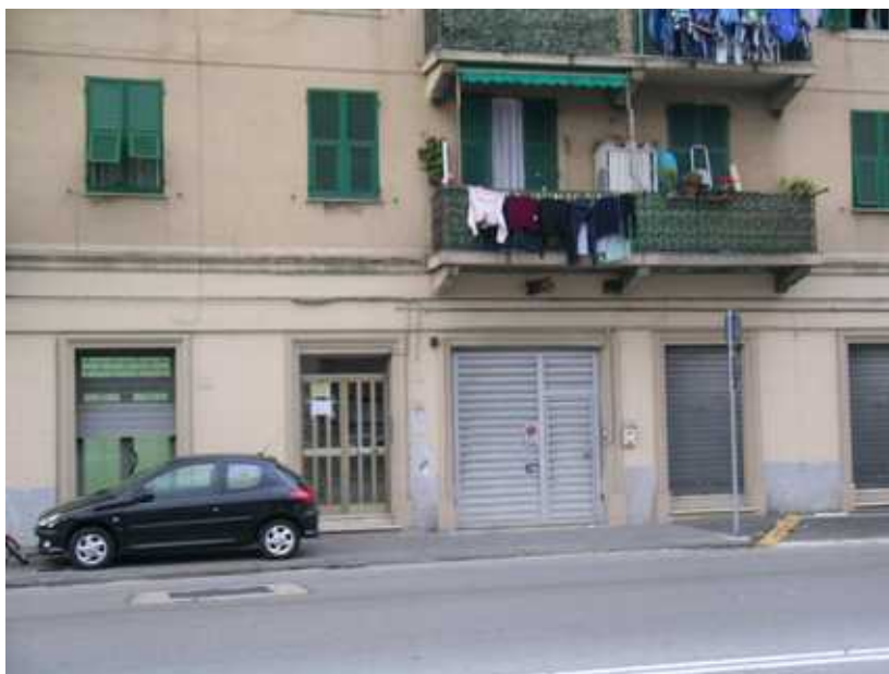
Prospetto - civ 34 Via A. Siffredi dettaglio del portone di accesso allo stabile