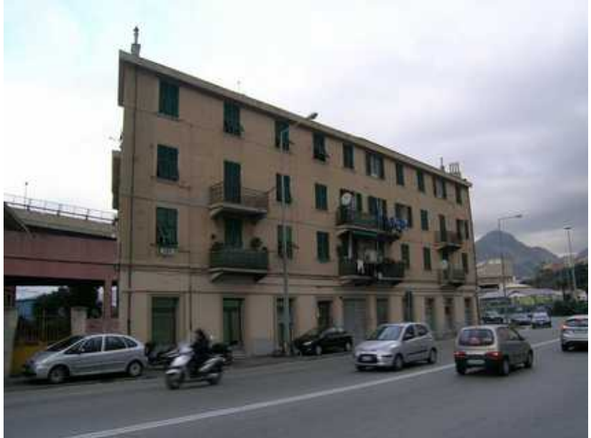
Prospetto Est- civ 34 Via A. Siffredi