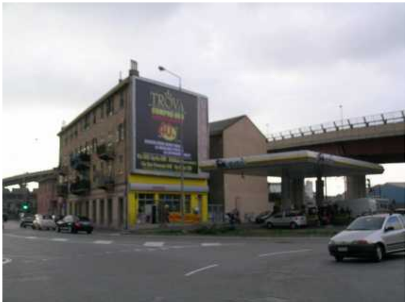
Prospetto Nord - civ 34 Via A. Siffredi