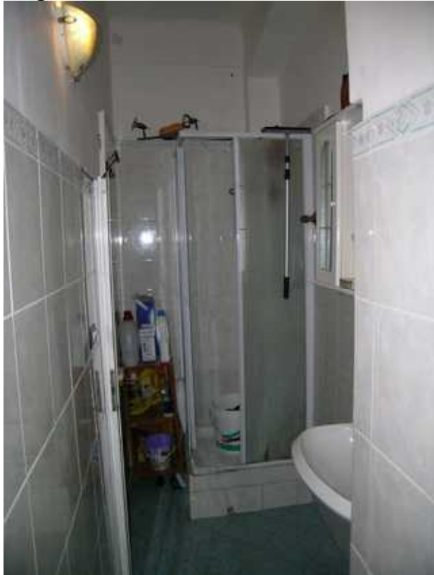
Servizio Igienico - antibagno