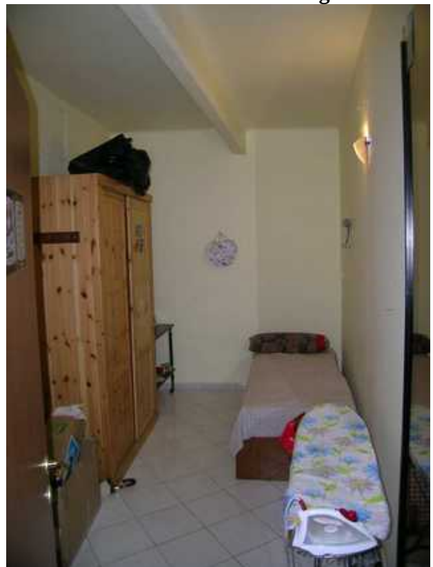
Ripostiglio- senza finestre adibito a camera 2