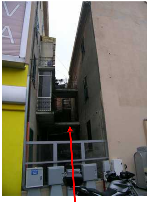
vista del cortile interno da Nord e della passerella di accesso all'unità in oggetto