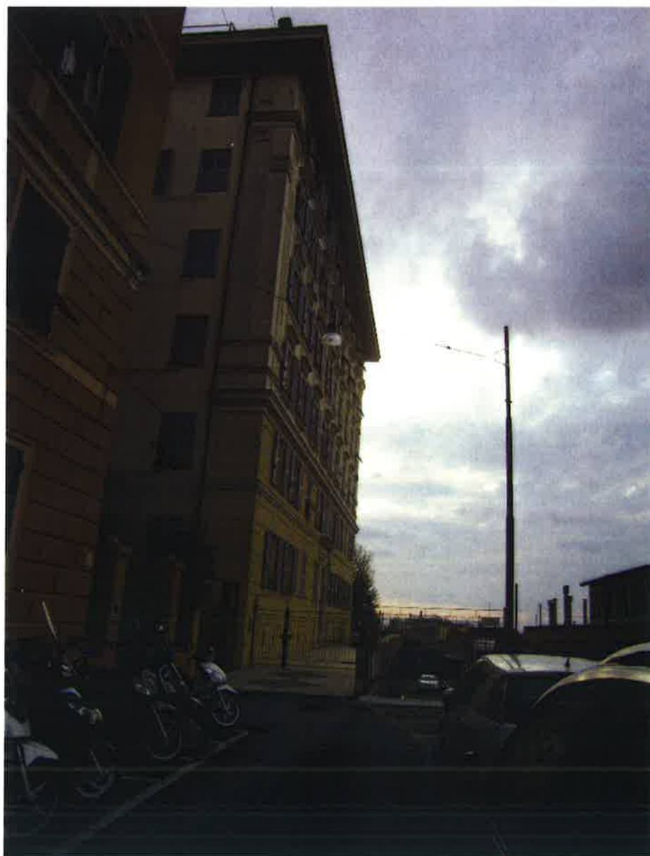
Foto 1 - il civico 26 – in primo piano il cancelletto di accesso al cortile pertinenziale