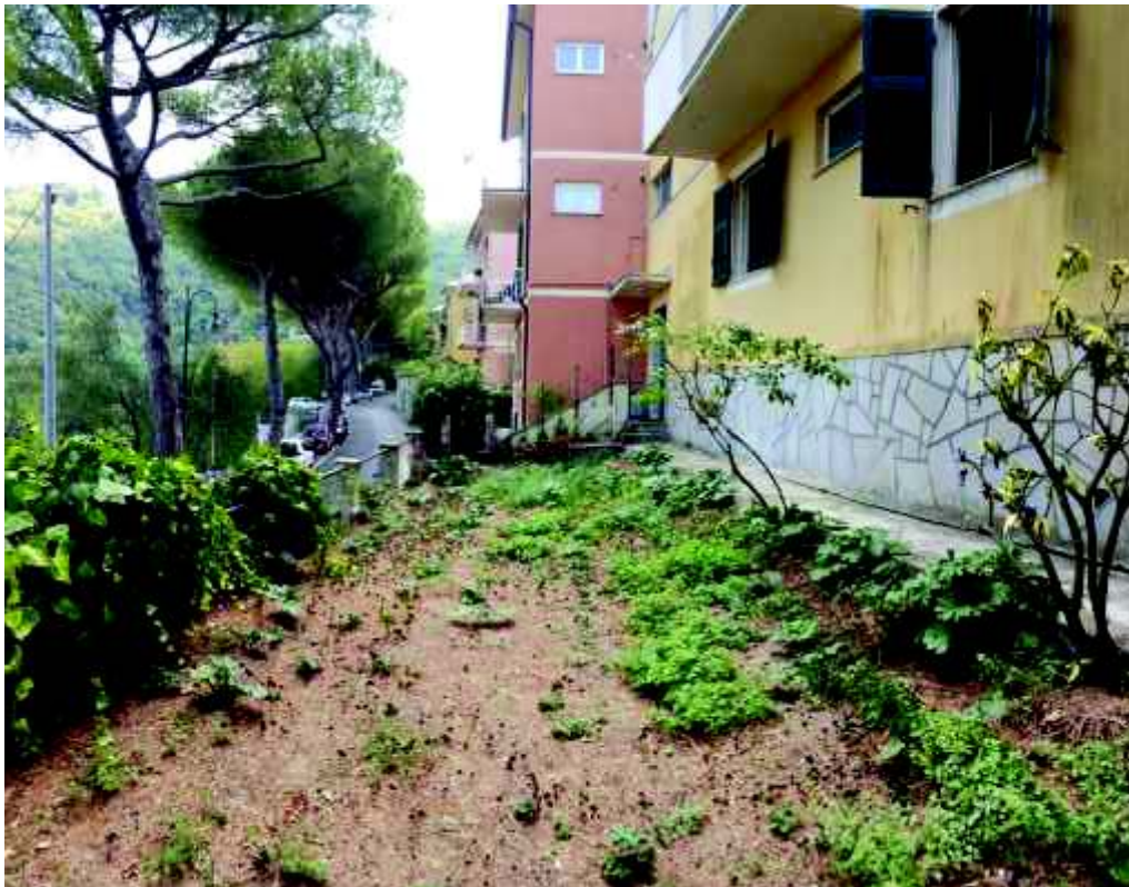
Giardino fronte strada