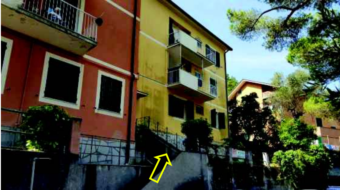
Vista da Via Molfino