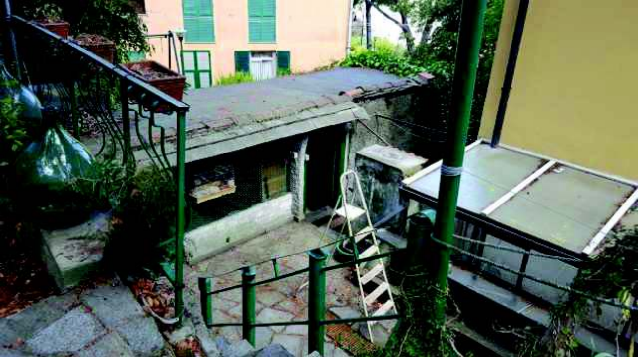
Giardino sul retro