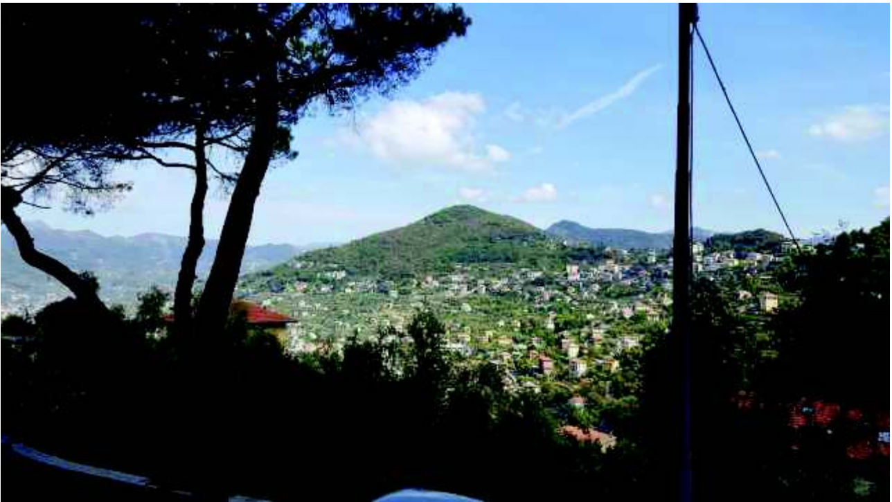
Veduta dal Soggiorno