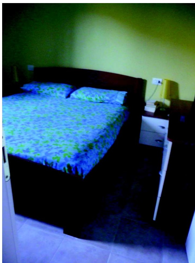
Foto n 12 Camera da letto dell'interno civ n.1 palazzina D