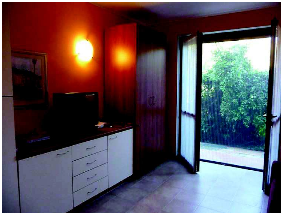
Foto n 10 Soggiorno civ n.1 palazzina D