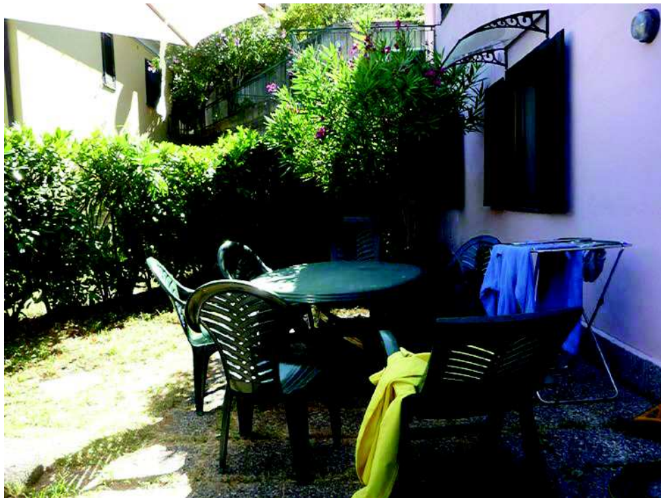
Foto n 9 Area laterale del giardino di pertinenza dell'interno n.1 edificio D