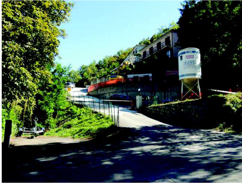
Foto n 1 Ingresso con sbarra al Condominio la Pineta e area parcheggio a destra