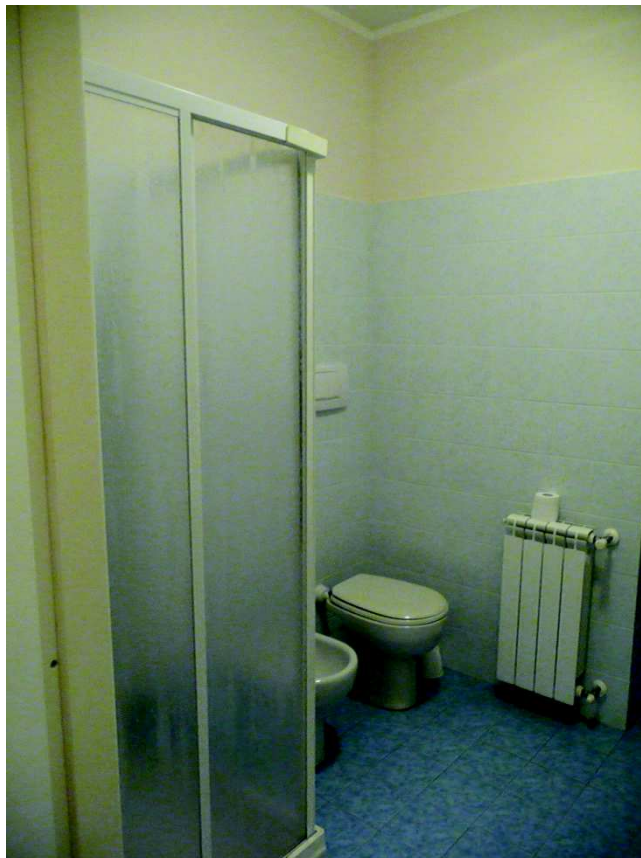
Foto n 13 Bagno con doccia all'interno civ n.1 palazzina D