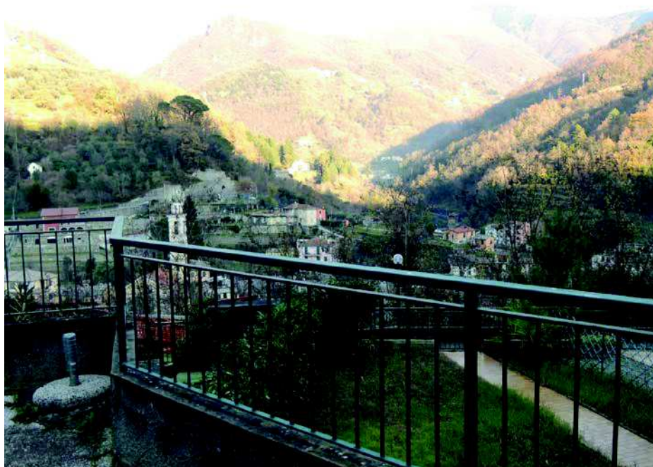
Foto n 8 Vista sulla vallata verso nord est