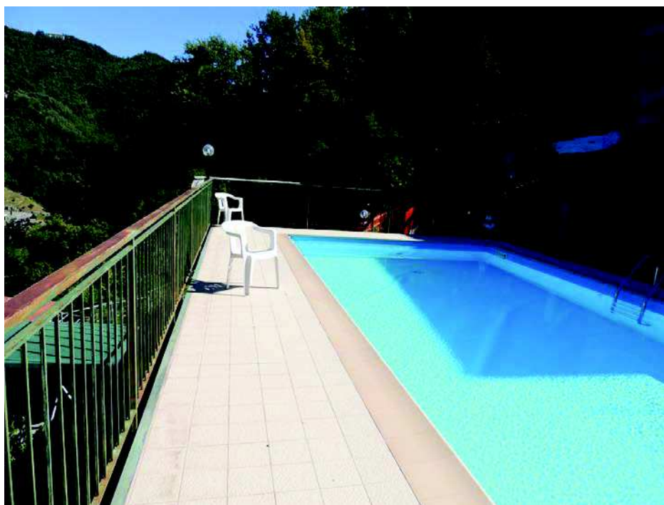
Foto n 16 Zona Piscina