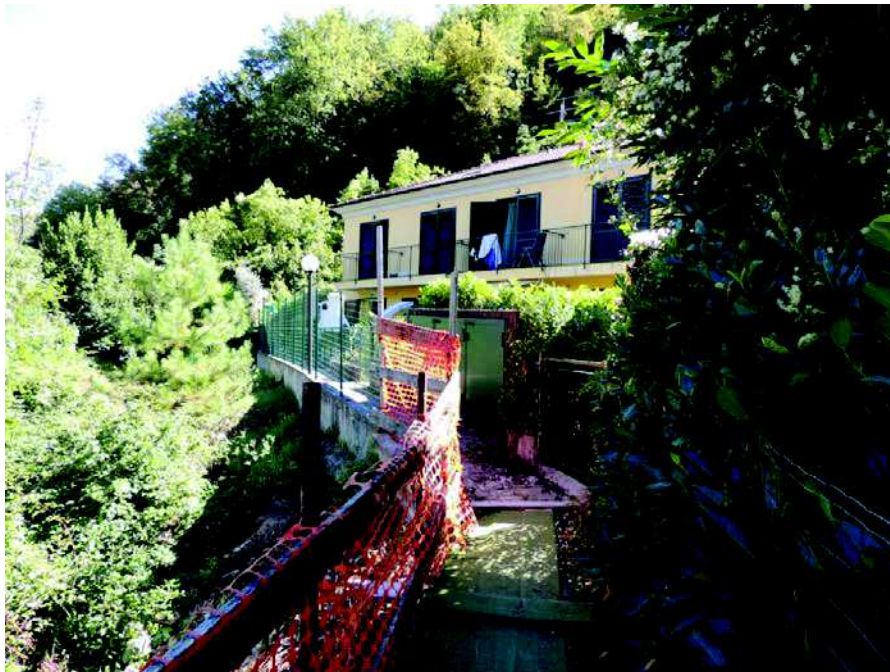
Foto n 5 Passaggio pedonale attuale per accesso al piano terra dell'Edificio D