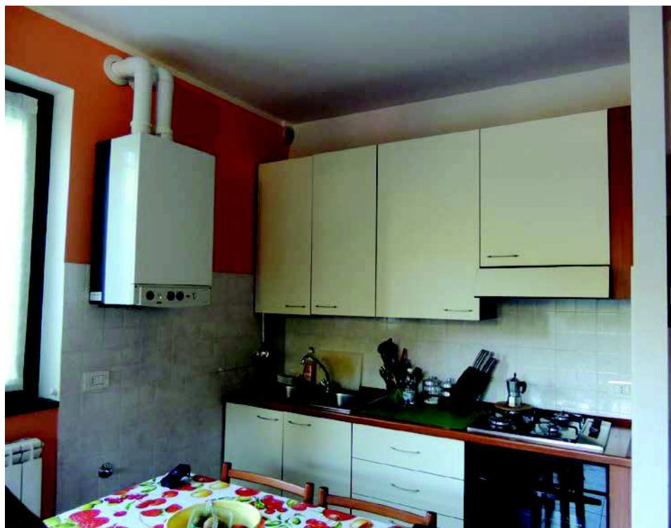
Foto n 11 Angolo cottura dell'interno civ n.1 palazzina D