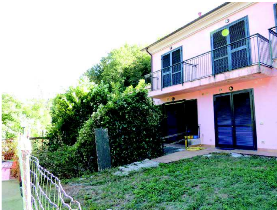
Foto n 6 Giardino di pertinenza dell'interno n.1 dell'edificio D, parte terminale