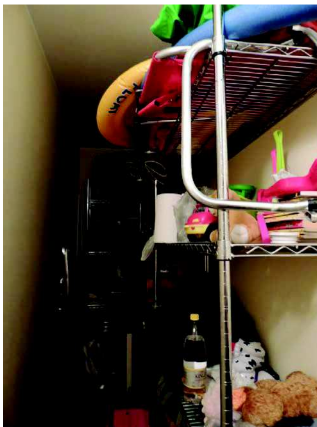
Foto n 14 Intercapedine dell'immobile all'interno civ n.1 palazzina D