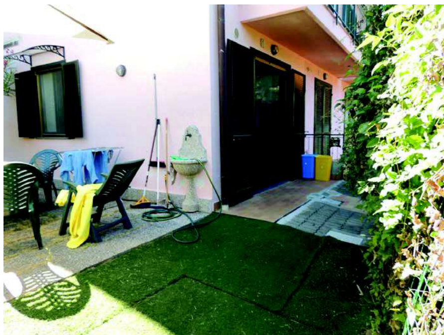
Foto n 7 Ingresso all'interno n. 1 dell'edificio D con giardino di pertinenza con parte attualmente non agibile