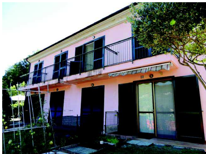
Foto n 4 Edificio D piano terra