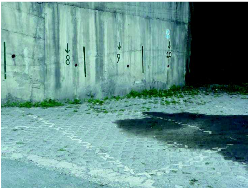
Foto n 15 Posto auto n.8 di pertinenza civ n.1 palazzina D